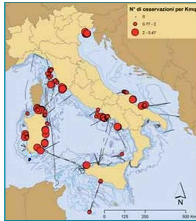
Diverse densità di Berta minore lungo i transetti effettuati.