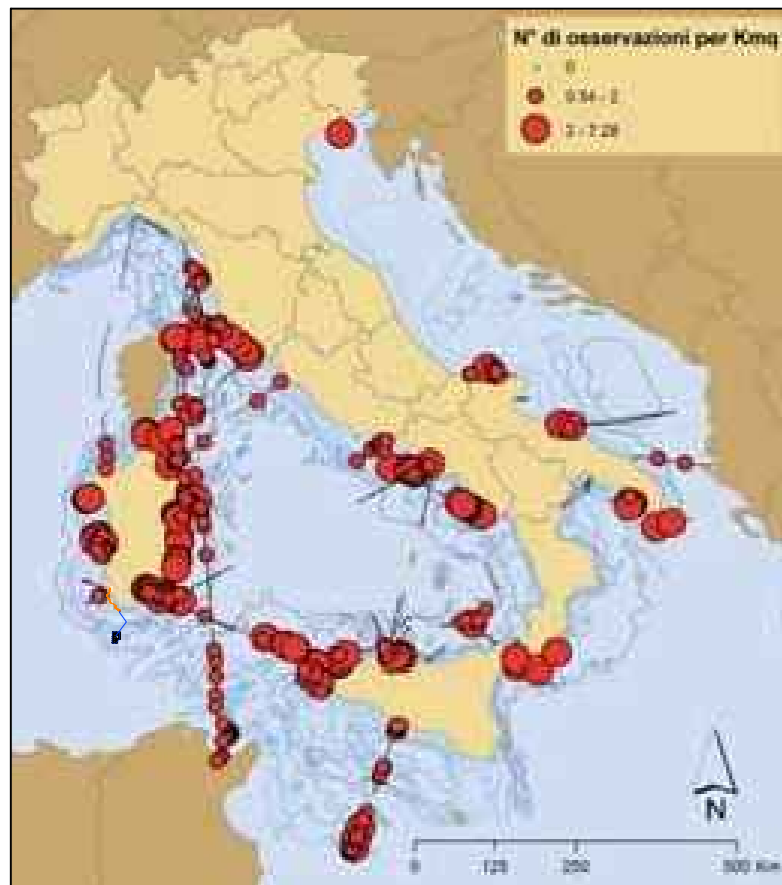
Diverse densità di Berta maggiore lungo i transetti effettuati.