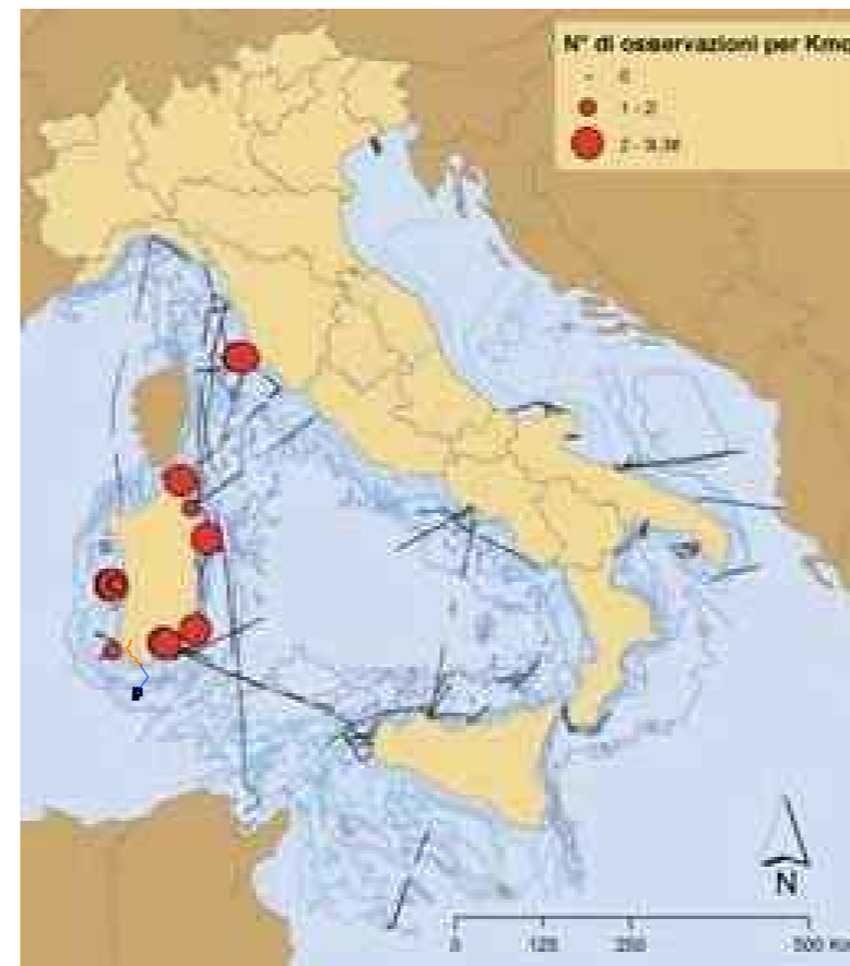
Diverse densità di Marangone dal ciuffo lungo i transetti effettuati.