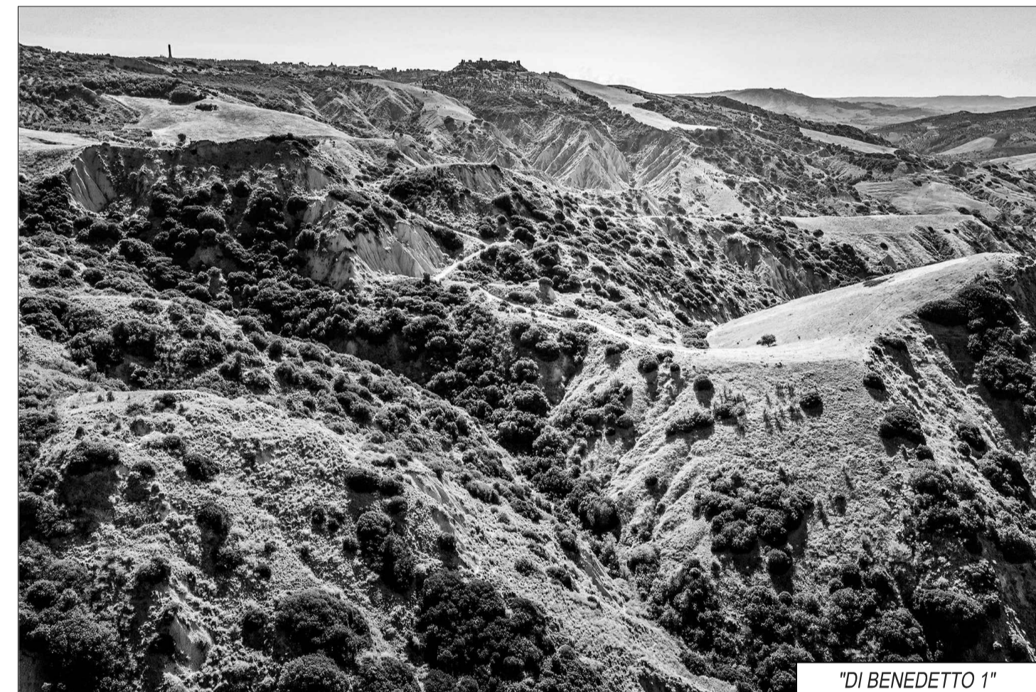
"DI BENEDETTO 1"