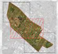
CARTA DELLA VEGETAZIONE - AREA VASTA DI STUDIO 01 MTG 001 VEH TAV 003 A TAVOLA DI DETTAGLIO 2 DI 3