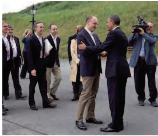
Il nostro premier Enrico Letta debutta al G8 e incontra per la prima volta il presidente Usa (nella foto) con il quale ha un colloquio bilaterale. Barack Obama lo invita entro la fine dell'anno alla Casa Bianca. ALLE PAGINE 2, 3, 10 E 11