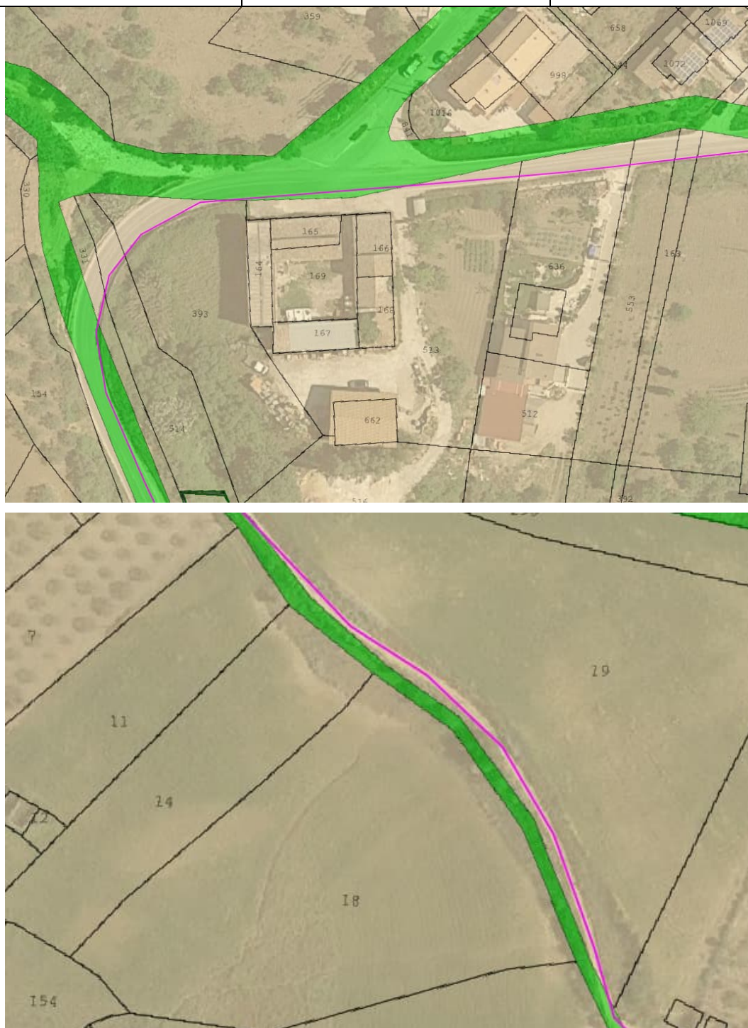
Figura 1: Esempi di incongruenza tra i corpi stradali presenti catastalmente e gli stessi presenti in sito. In verde le strade accatastate; in magenta il cavidotto di connessione.

Oltre alla incongruenza precedentemente attenzionata, si segnala che alcuni corpi stradali esistenti e pubblici, non risultano essere accatastati come tali. Tale non corrispondenza comporta l'interferenza tra il cavidotto di connessione e particelle catastali private anche se in corrispondenza di corpi stradali esistenti.