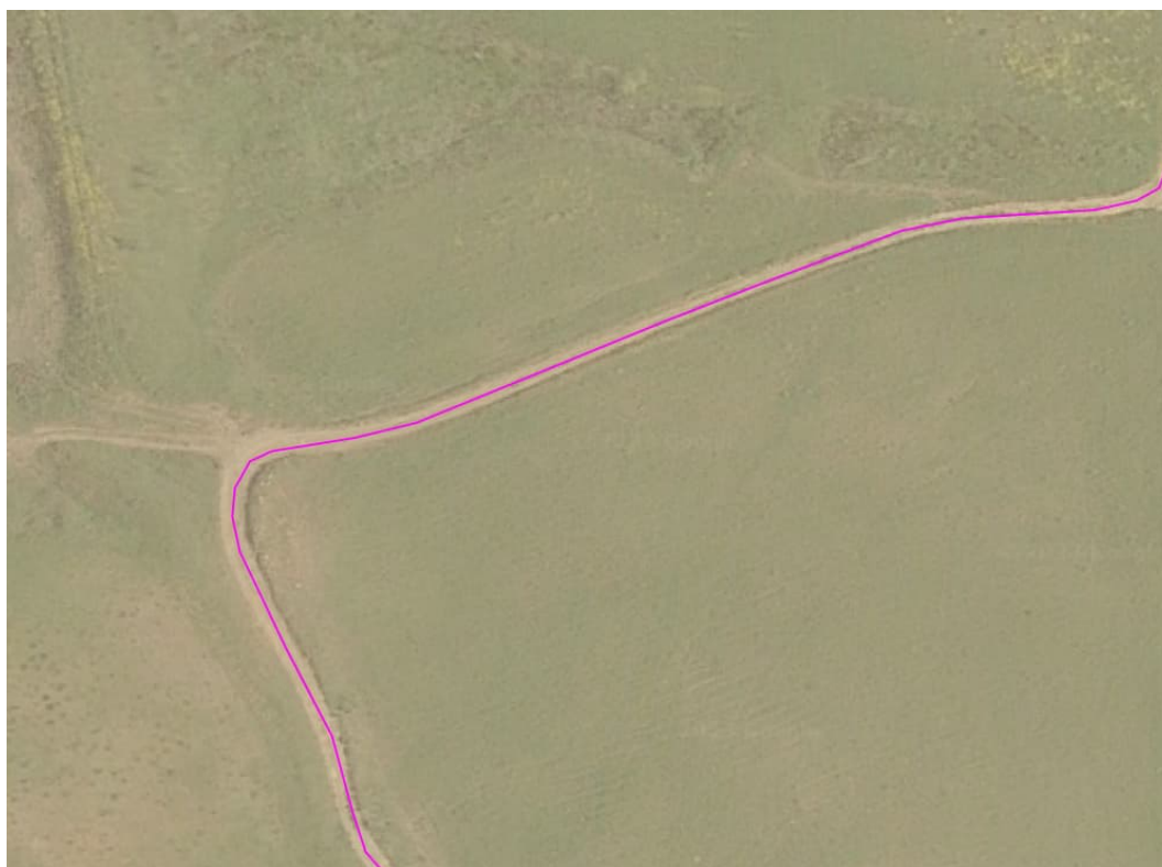
Figura 2: Esempi di corpi stradali presenti ma non accatastati. In magenta il cavidotto MT.