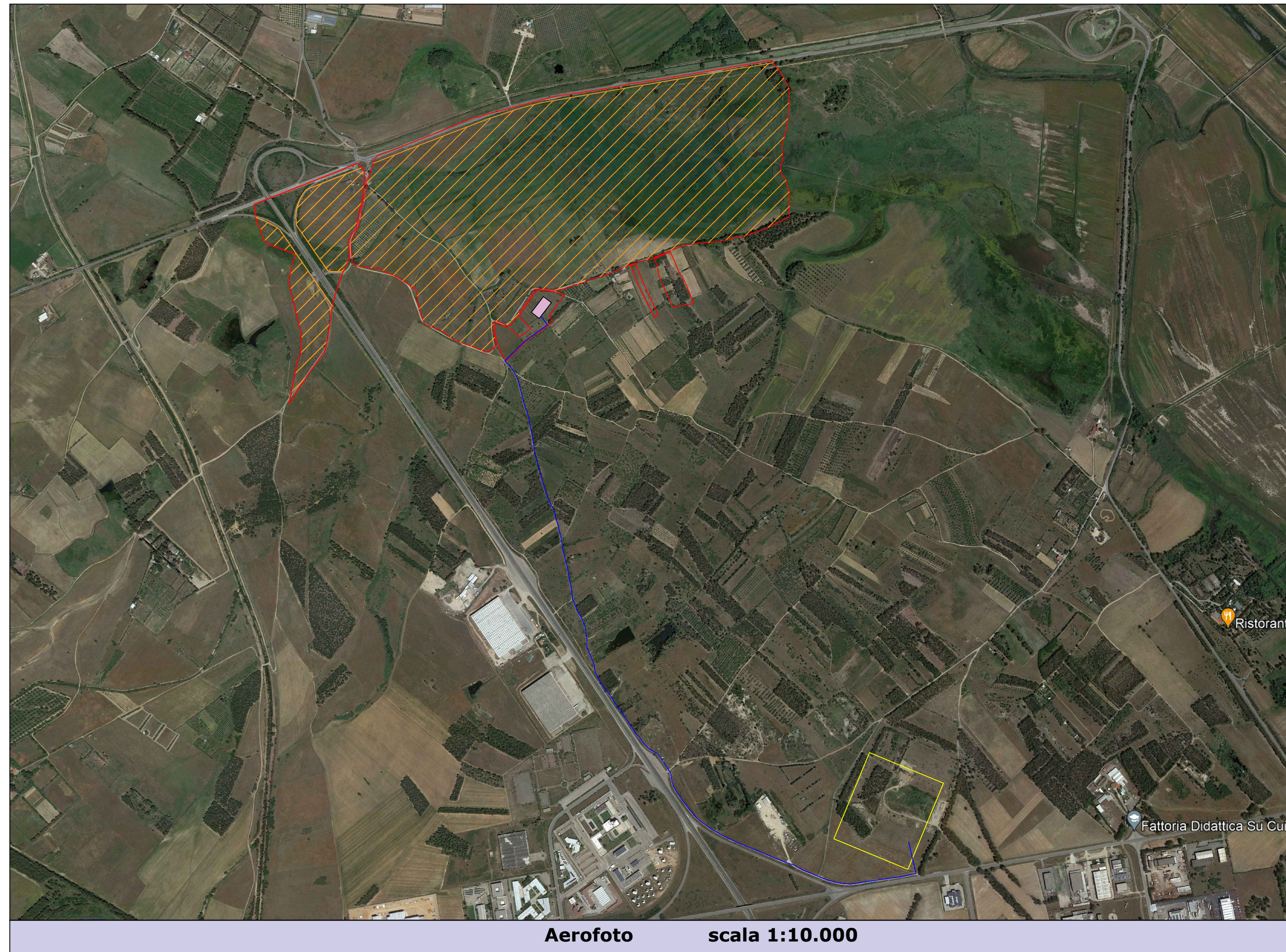
Aerofoto scala 1:10.000