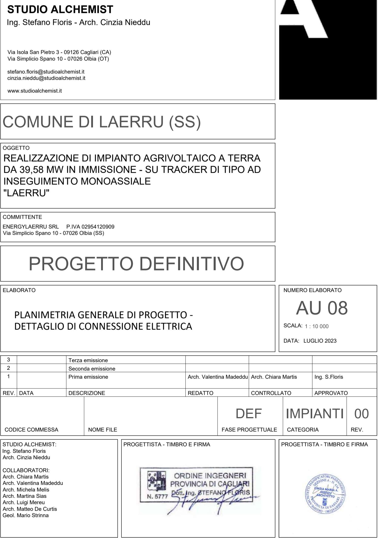
SOTTOSTAZIONE SU BASE CTR_Scala 1: 10 000