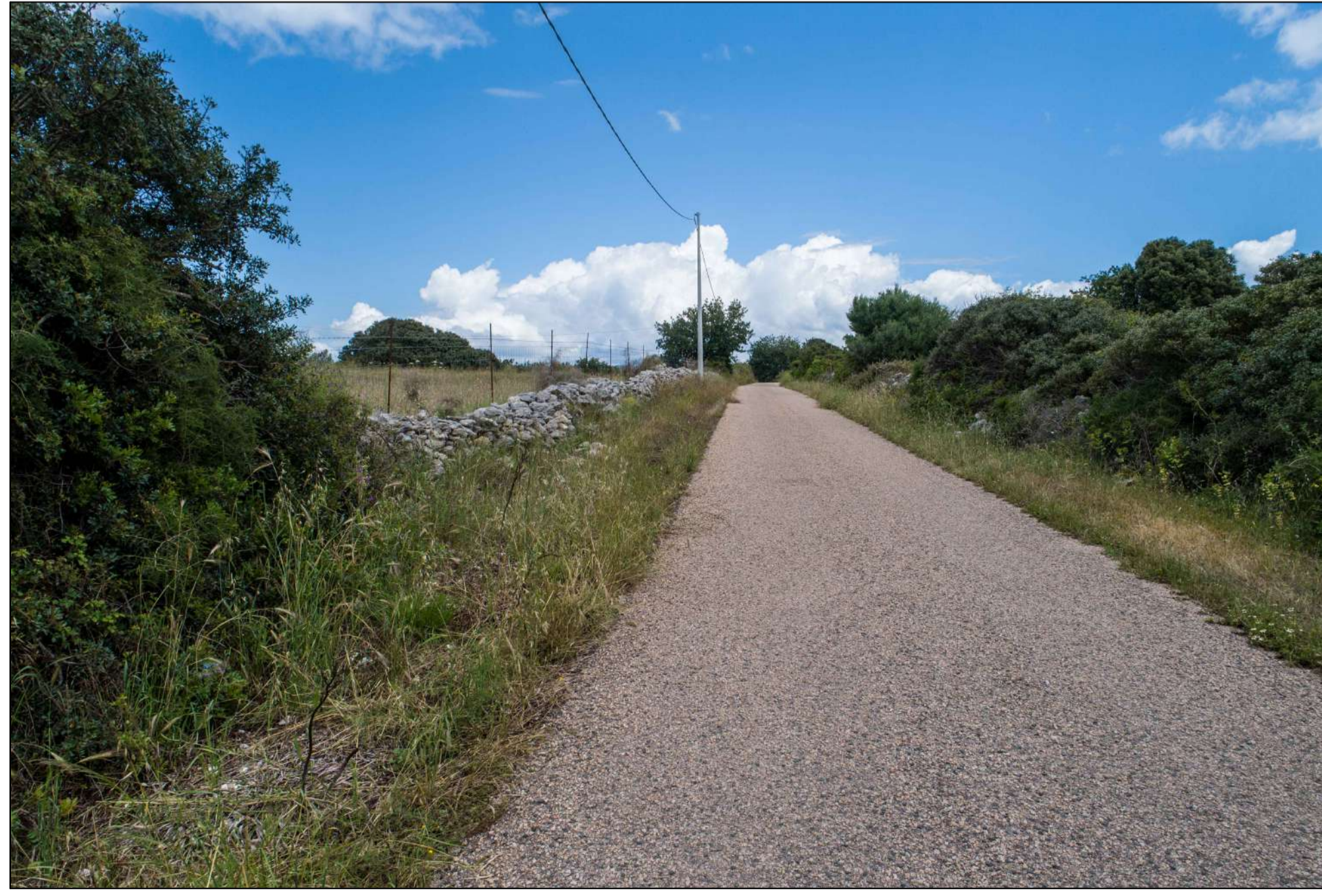
VISTA PUNTO DI SCATTO 3 - FOTO DELL'AREA (P.6)