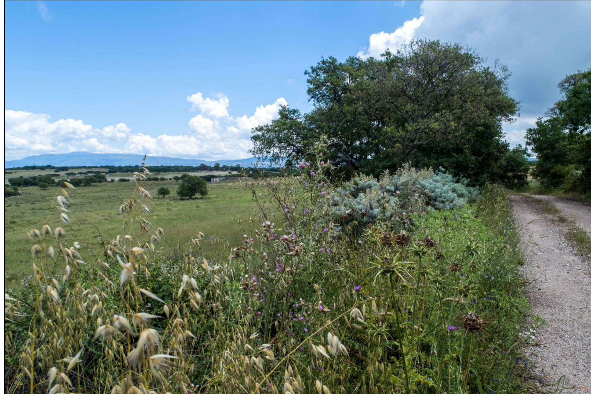
VISTA PUNTO DI SCATTO 2 - FOTO DELL'AREA (P.9)