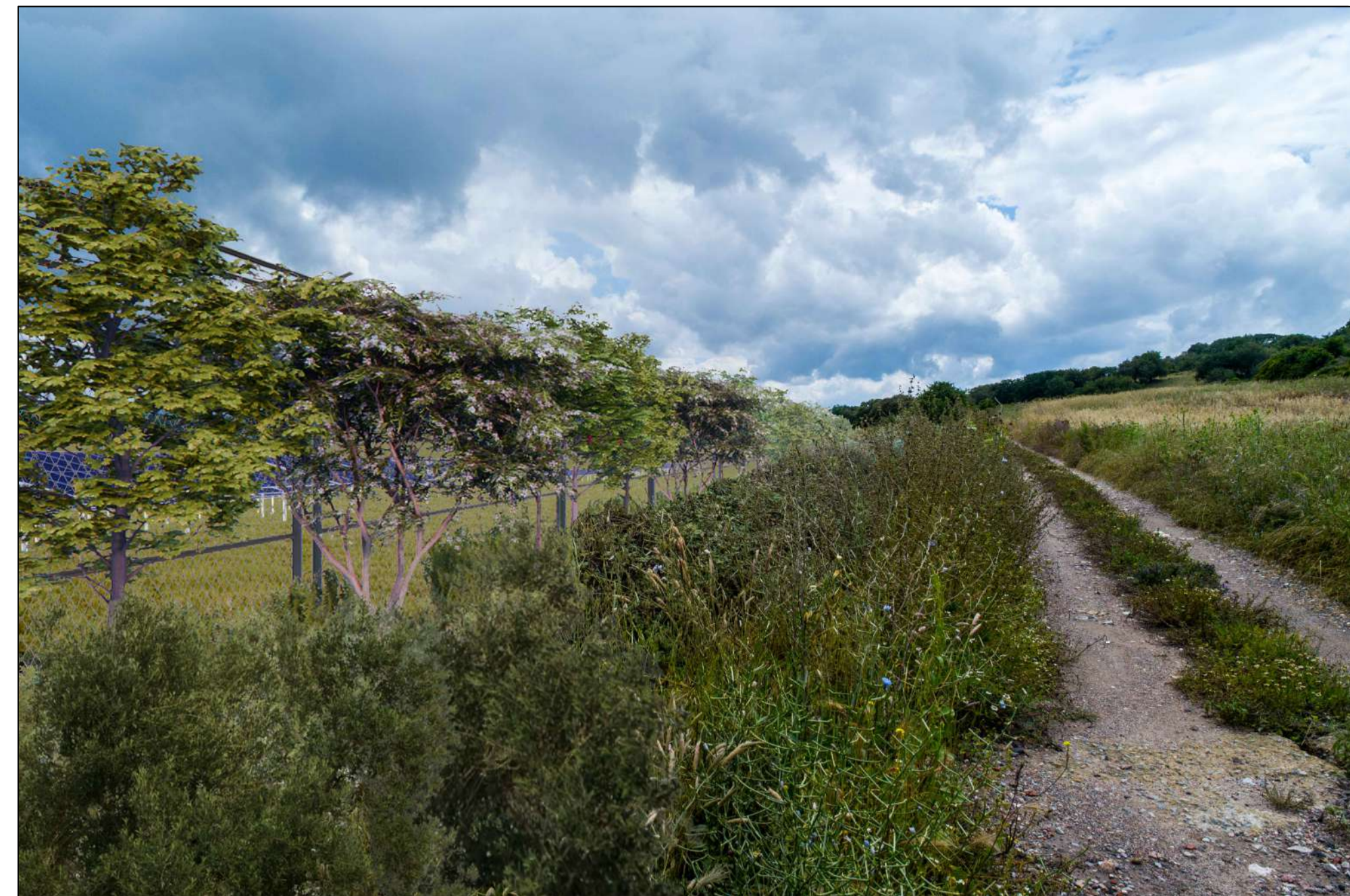
VISTA PUNTO DI SCATTO 1 - MITIGAZIONE (P.12)