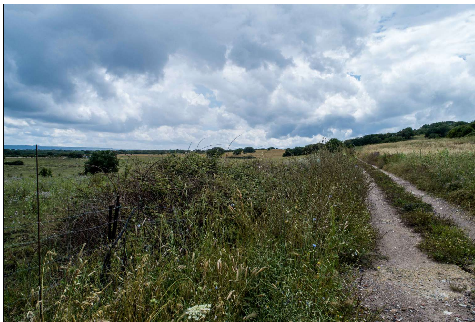
VISTA PUNTO DI SCATTO 1 - FOTO DELL'AREA (P.12)