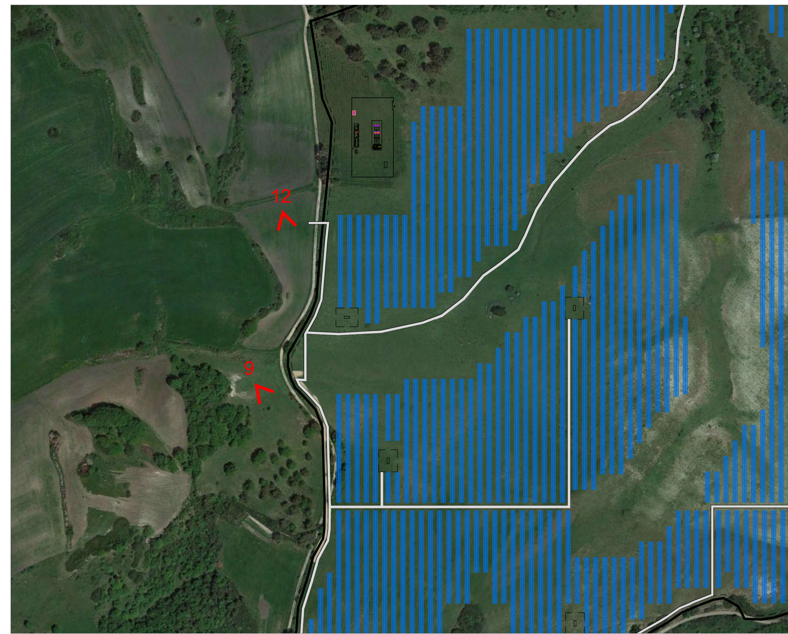
Punti di scatto_Zoom Area