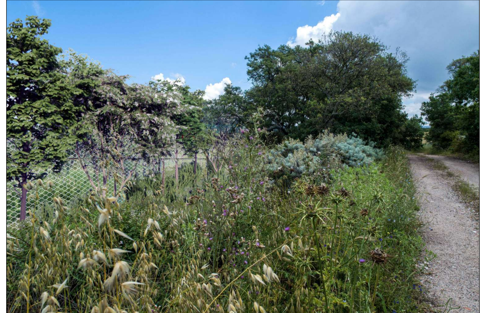
VISTA PUNTO DI SCATTO 2 - MITIGAZIONE (P.9)