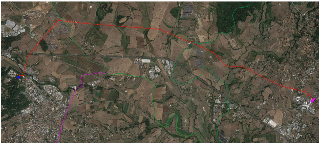
Figura 2 - Inquadramento dell'area su Ortofoto

Il tracciato dell'elettrodotto "CP Colleferro – CP Anagni" è riportato sulla corografia in scala 1:10.000 allegata (doc. n. 202100606_PTO_06-01).