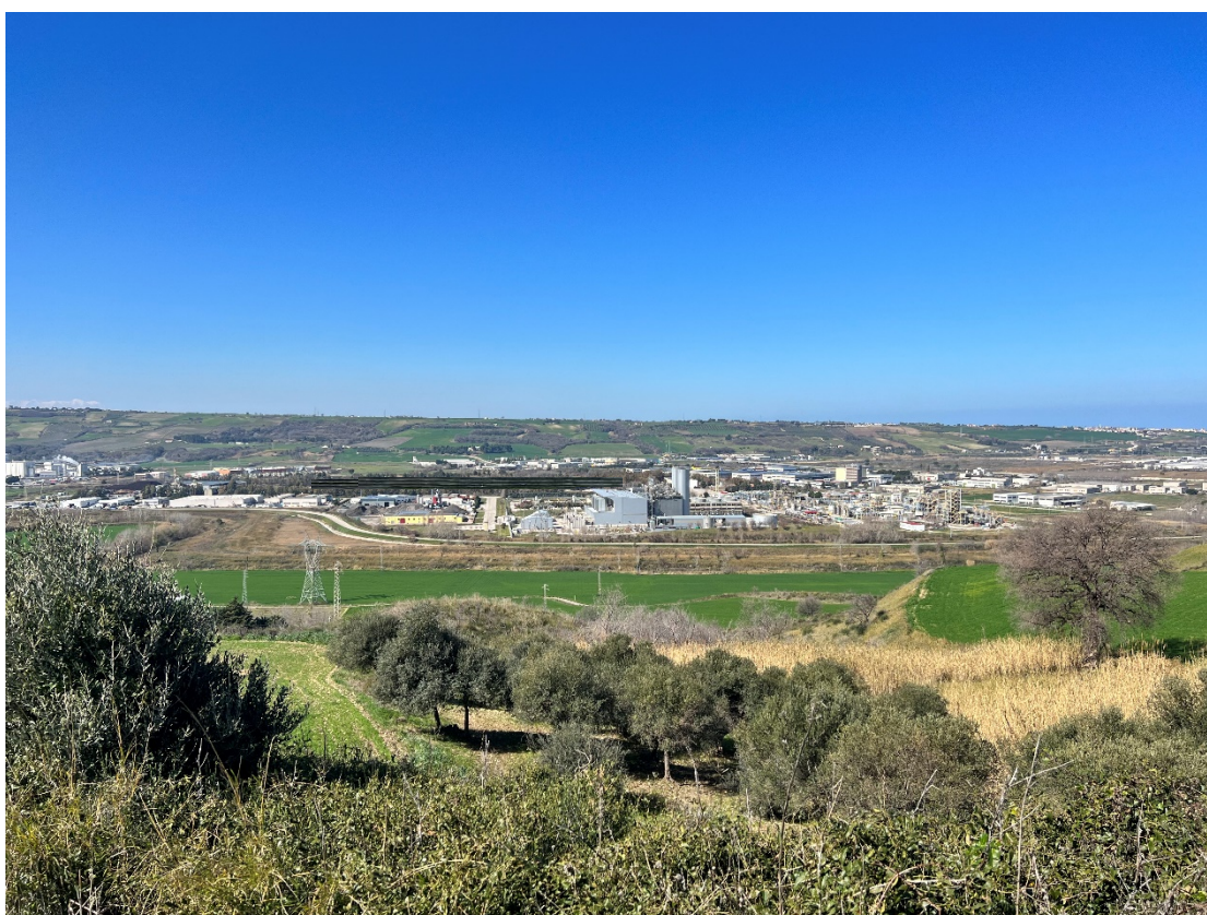
Foto 6 - Punto dinamico Strada provinciale 40 "Adriatica" - Stato di progetto con foto inserimento delle opere – L'opera si inserisce nel contesto, attenuando l'impatto di visuale della Zona Industriale