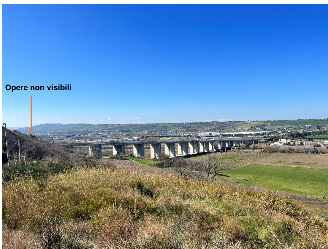
Foto 7 - Punto statico nell'abitato di Campomarino - Stato di progetto dove non è possibile vedere l'impianto