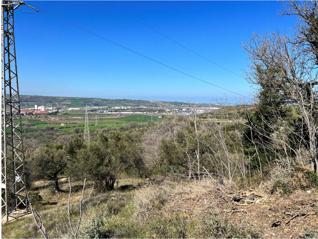
Foto 5 – Punto statico nell'abitato di Portocannone – Stato di fatto