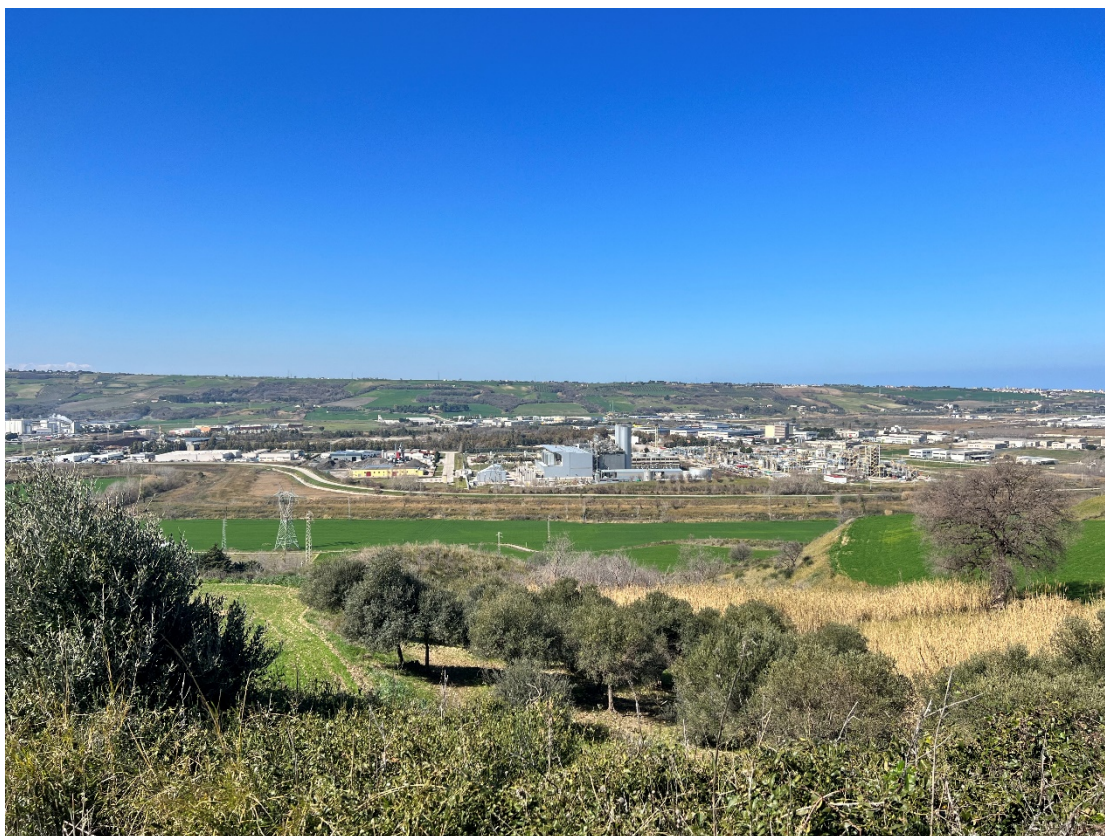
Foto 6 - Punto dinamico Strada provinciale 40 "Adriatica" – Stato di fatto