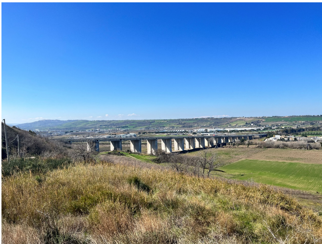
Foto 7 - Punto statico nell'abitato di Campomarino - Stato di fatto