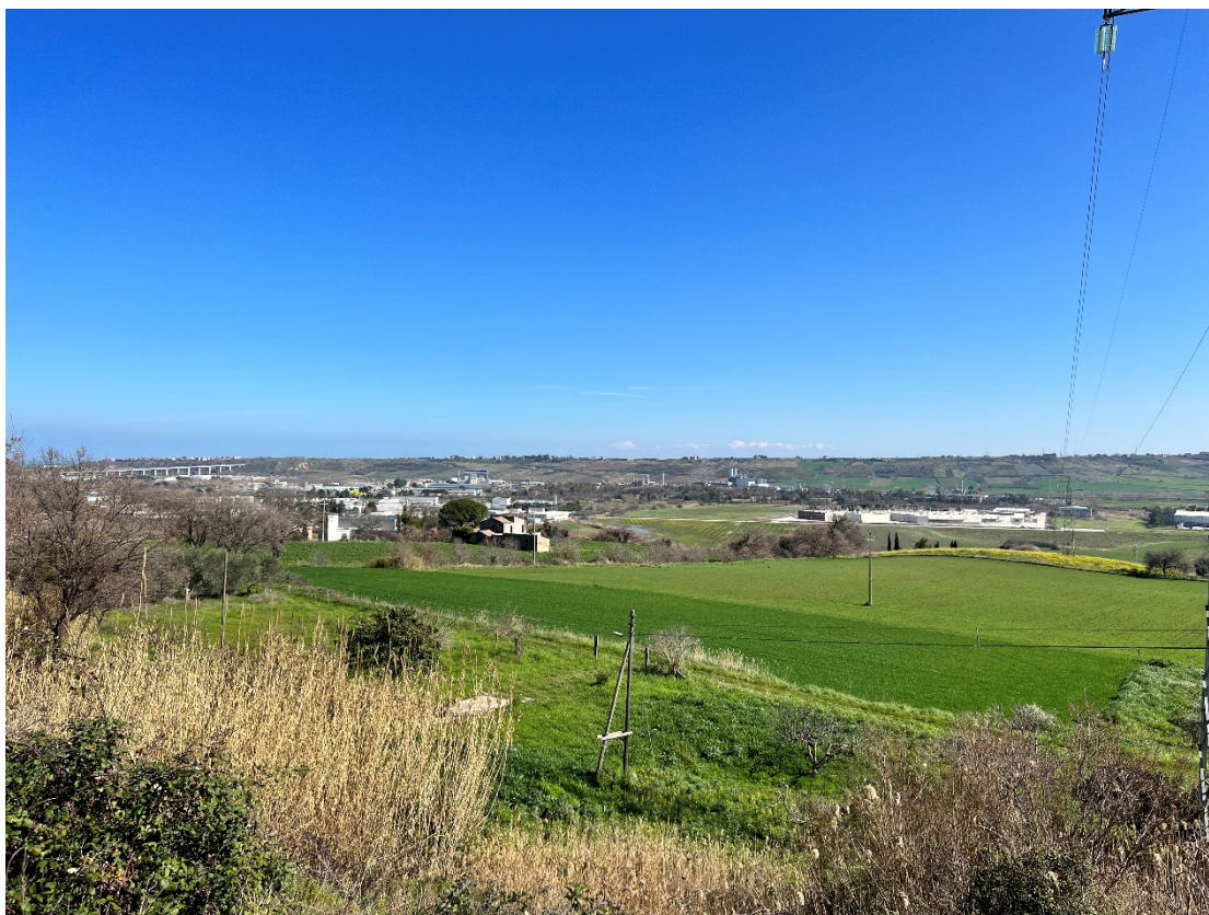
Foto 3 - Punto dinamico Strada comunale di Guglionesi (CB) – Stato di fatto