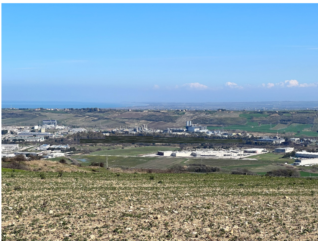
Foto 4 - Punto dinamico Strada provinciale "Difesa grande" – Stato di progetto con foto inserimento delle opere – L'opera si inserisce nel contesto, attenuando l'impatto di visuale della Zona Industriale