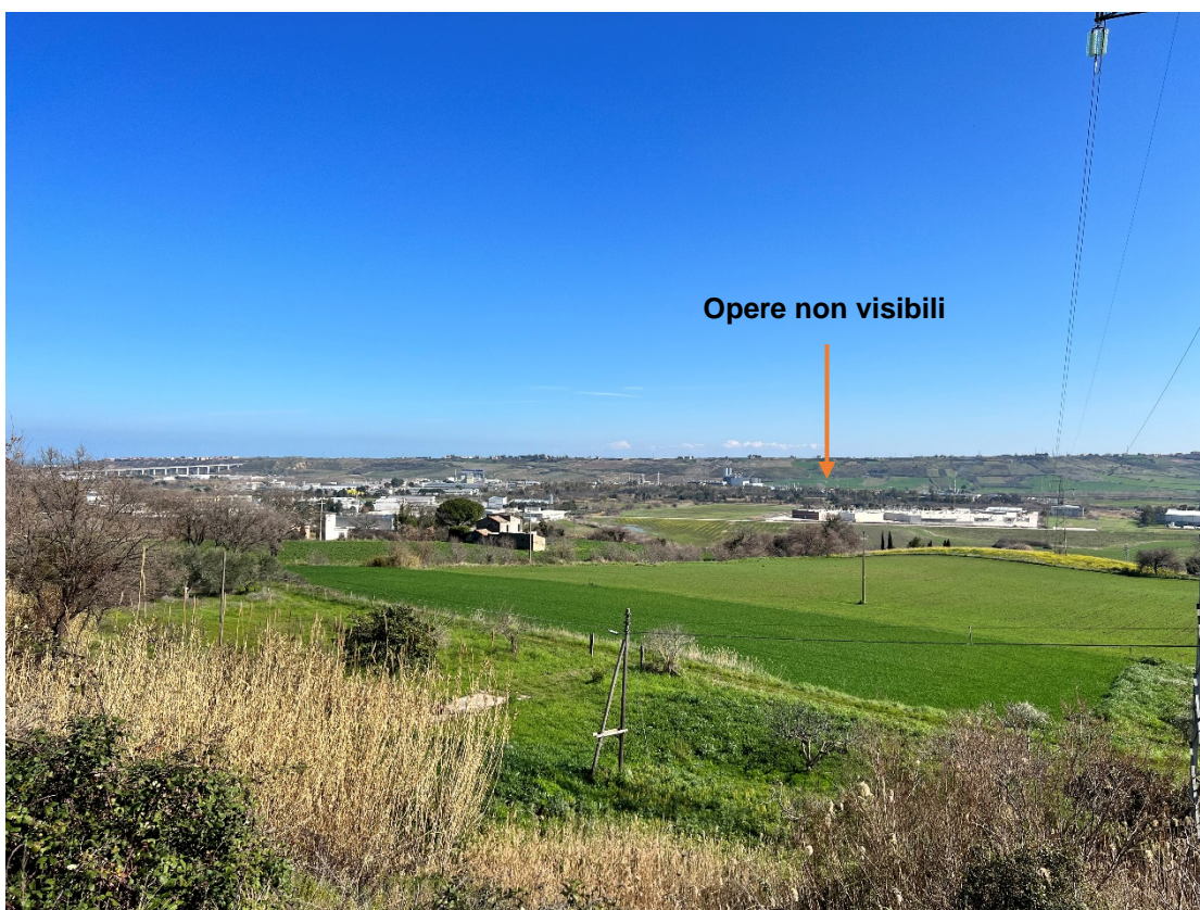
Foto 3 - Punto dinamico Strada comunale di Guglionesi (CB) – Stato di progetto dove non è possibile vedere l'impianto per le alberature che formano una barriera percettiva verde