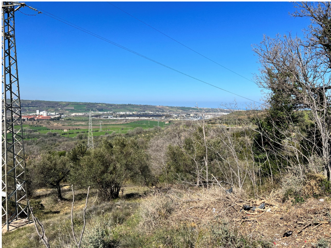
Foto 5 – Punto statico nell'abitato di Portocannone - Stato di progetto con foto inserimento delle opere – L'opera si inserisce nel contesto, attenuando l'impatto di visuale della Zona Industriale