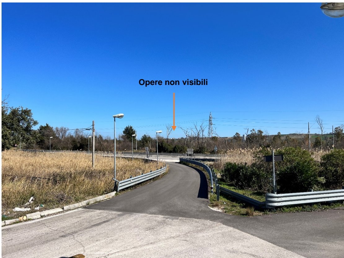
Foto 2 – Punto dinamico Strada Statale 87 Bifernina - Stato di progetto dove non è possibile vedere l'impianto per le alberature che formano una barriera percettiva verde