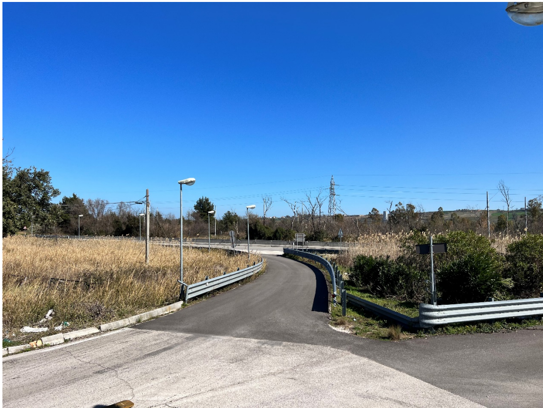
Foto 2 - Punto dinamico Strada Statale 87 Bifernina – Stato di fatto