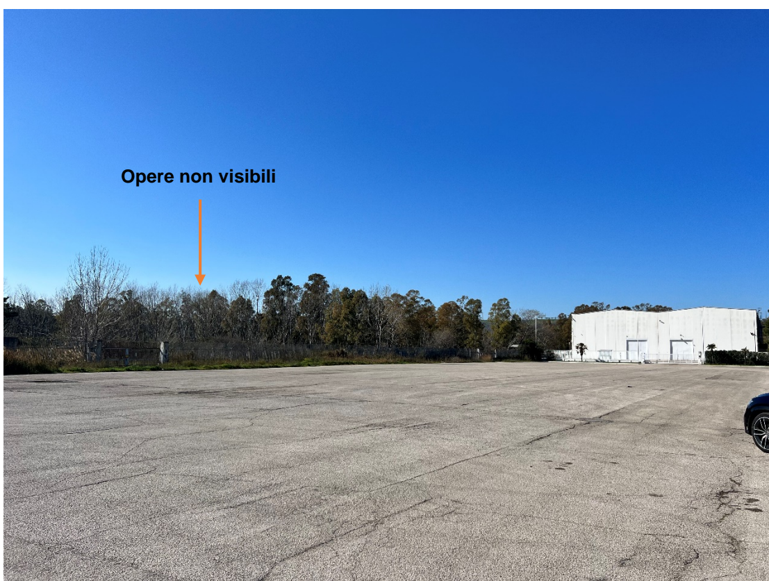
Foto 1 – Punto dinamico Strada consortile - Stato di progetto dove non è possibile vedere l'impianto per le alberature che formano una barriera percettiva verde