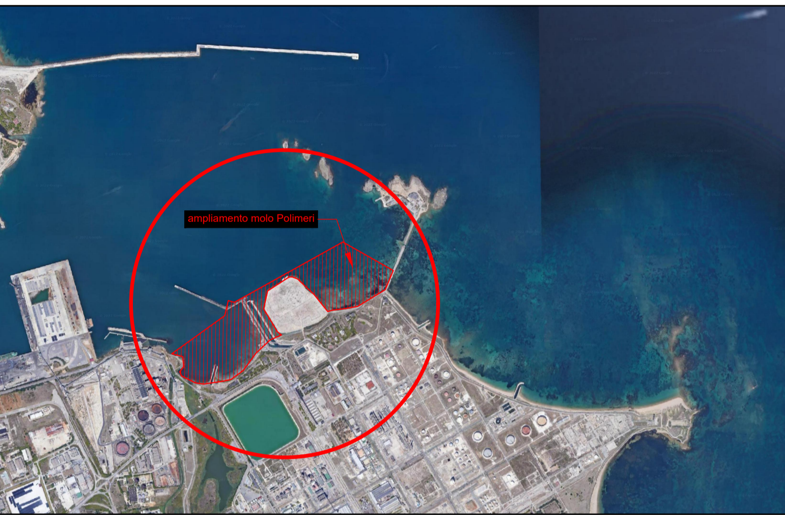
ORTOFOTO - PORTO DI BRINDISI - SCALA 1:25.000