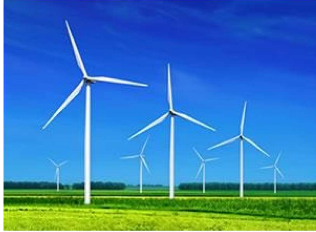
PROGETTO DEFINITIVO PARCO EOLICO "E90"