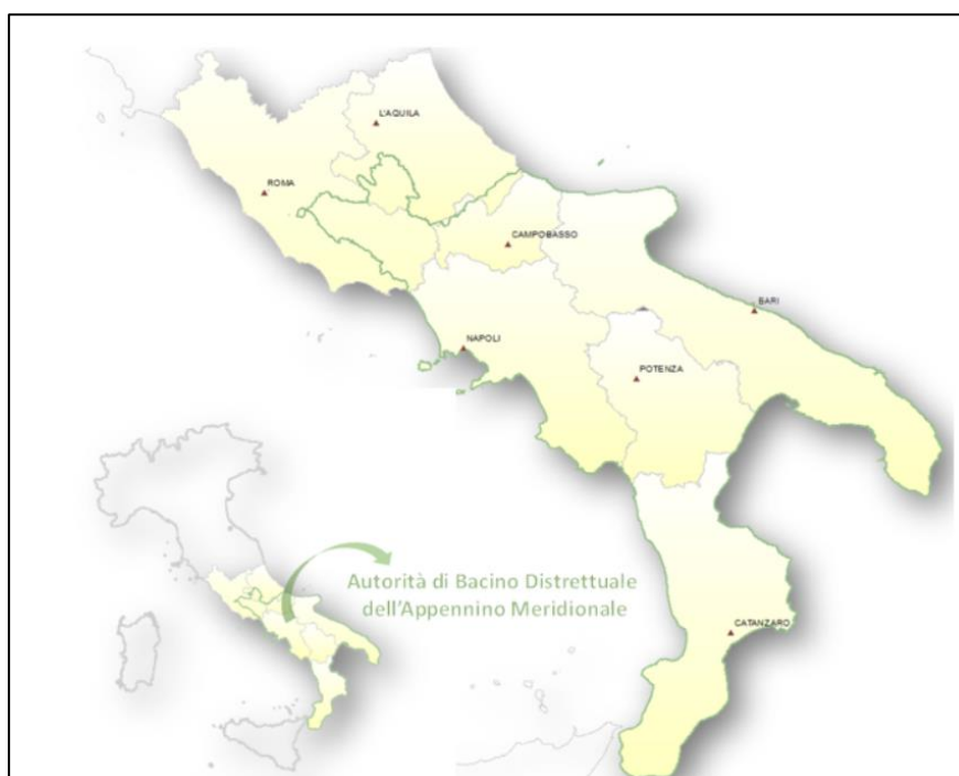
Fig. 6-2 – Territorio del Distretto Idrografico dell'Appennino Meridionale

I territori su cui sono localizzate le opere in progetto fanno parte del nuovo Distretto Idrografico dell'Appennino meridionale (vedi Fig. 6-1 –).