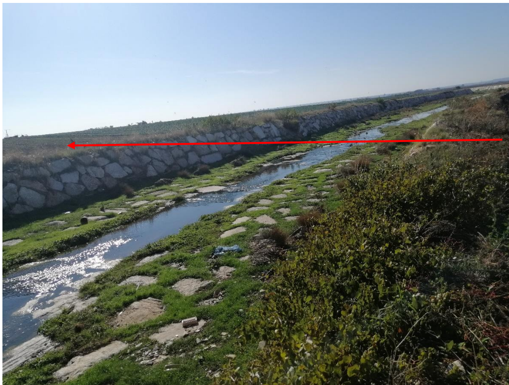
Fig. 5-3 – Il Canale San Martino (dir.) nei pressi dell'interferenza con il metanodotto in progetto Bretella 3 (in rosso il tracciato del metanodotto).

Gli attraversamenti saranno svolti con tecnologia spingitubo.