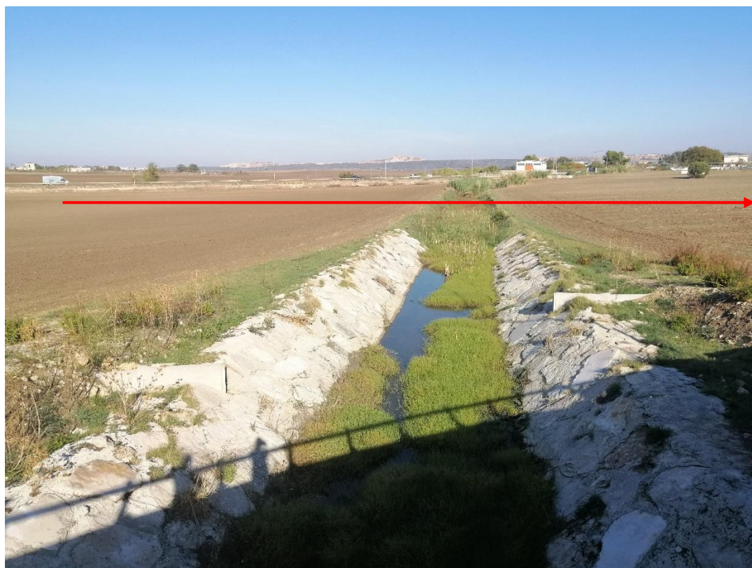
Fig. 5-2 – Il Torrente Santa Lucia nei pressi dell’interferenza con il metanodotto in progetto Bretella 3 (in rosso il tracciato del metanodotto).

Il Torrente Santa Lucia è un corso d’acqua del foggiano che scorre a sud-ovest del centro abitato di Apricena. Dopo aver attraversato la S.S: n.89, si unisce al corso della direttrice del Canale San Martino. In prossimità dell’attraversamento del metanodotto, il canale presenta un alveo regolare, di forma trapezia, ricoperto da vegetazione ripariale. A valle dell’attraversamento, il canale è rivestito in massi, a protezione del sottopasso per la nuova viabilità.