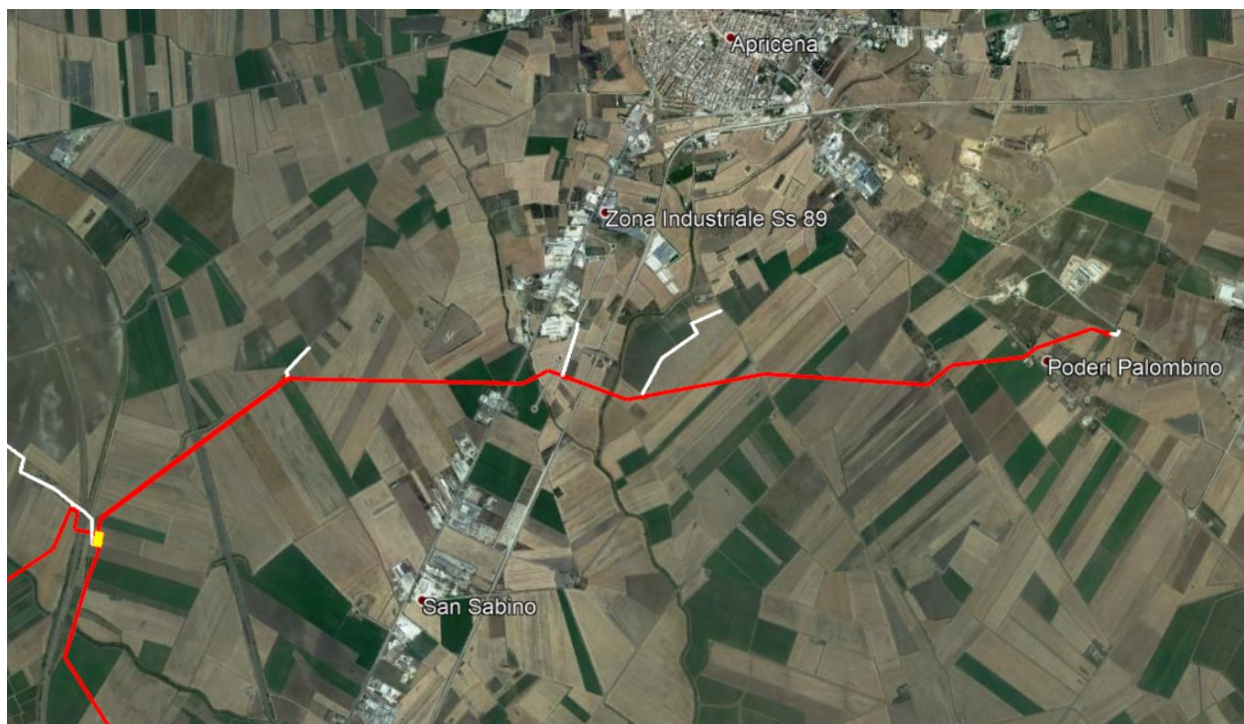
Fig. 2-1 – Inquadramento geografico dell'opera in progetto (tratto rosso)