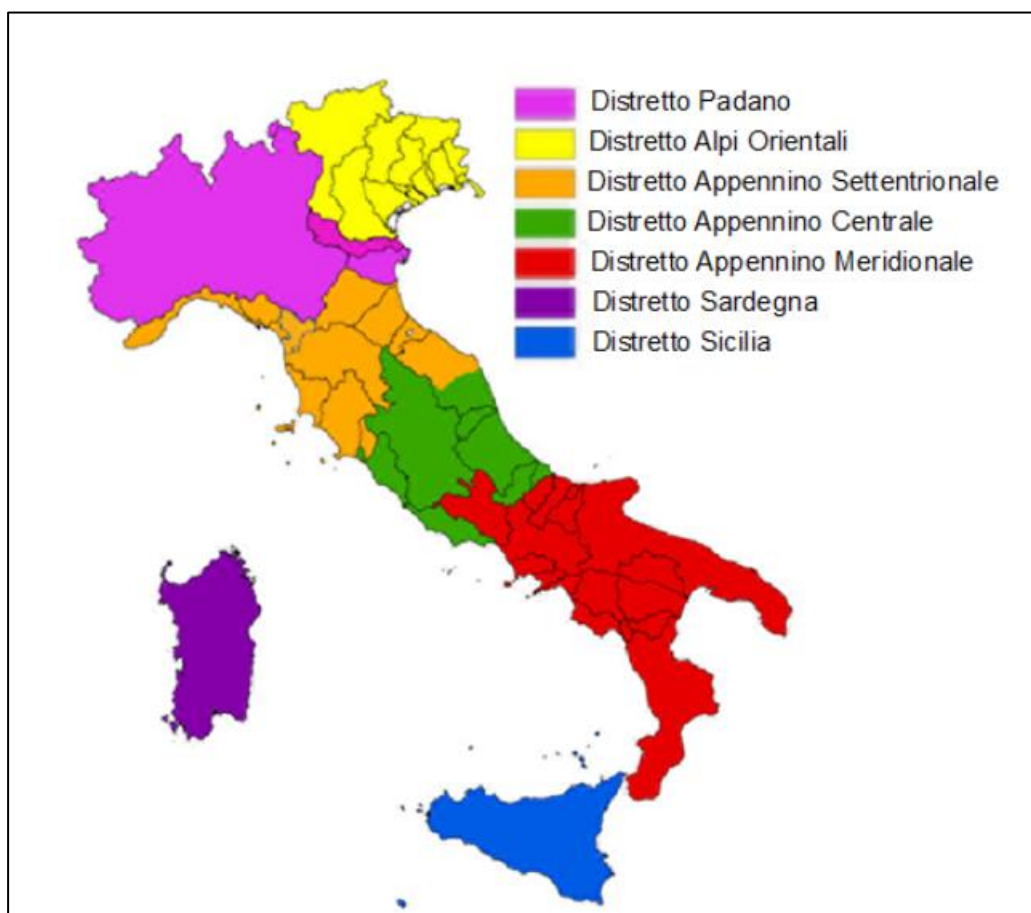
Fig. 6-1 – Territorio Italiano diviso in Distretti Idrografici, in rosso quello dell'Appennino Meridionale.

Soppresse le Autorità di Bacino definite dalla Legge 183/89, vengono quindi introdotte le Autorità di bacino distrettuale che provvedono all'elaborazione dei piani di bacino: questi possono essere redatti ed approvati anche per sottobacini o