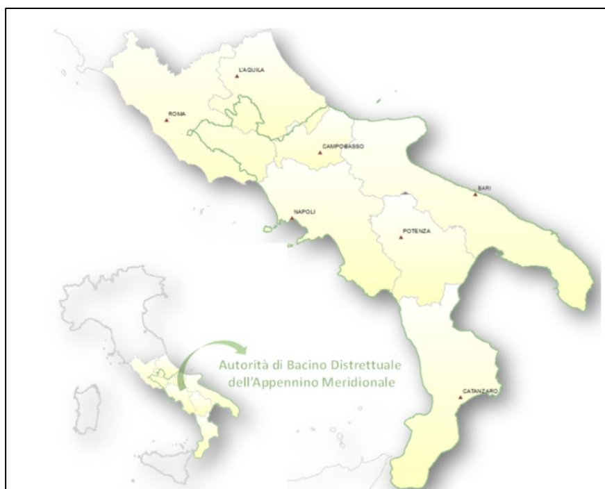
Fig. 6-2 – Territorio del Distretto Idrografico dell'Appennino Meridionale

I territori su cui sono localizzate le opere in progetto fanno parte del nuovo Distretto Idrografico dell'Appennino meridionale (vedi Fig. 6-1 –).