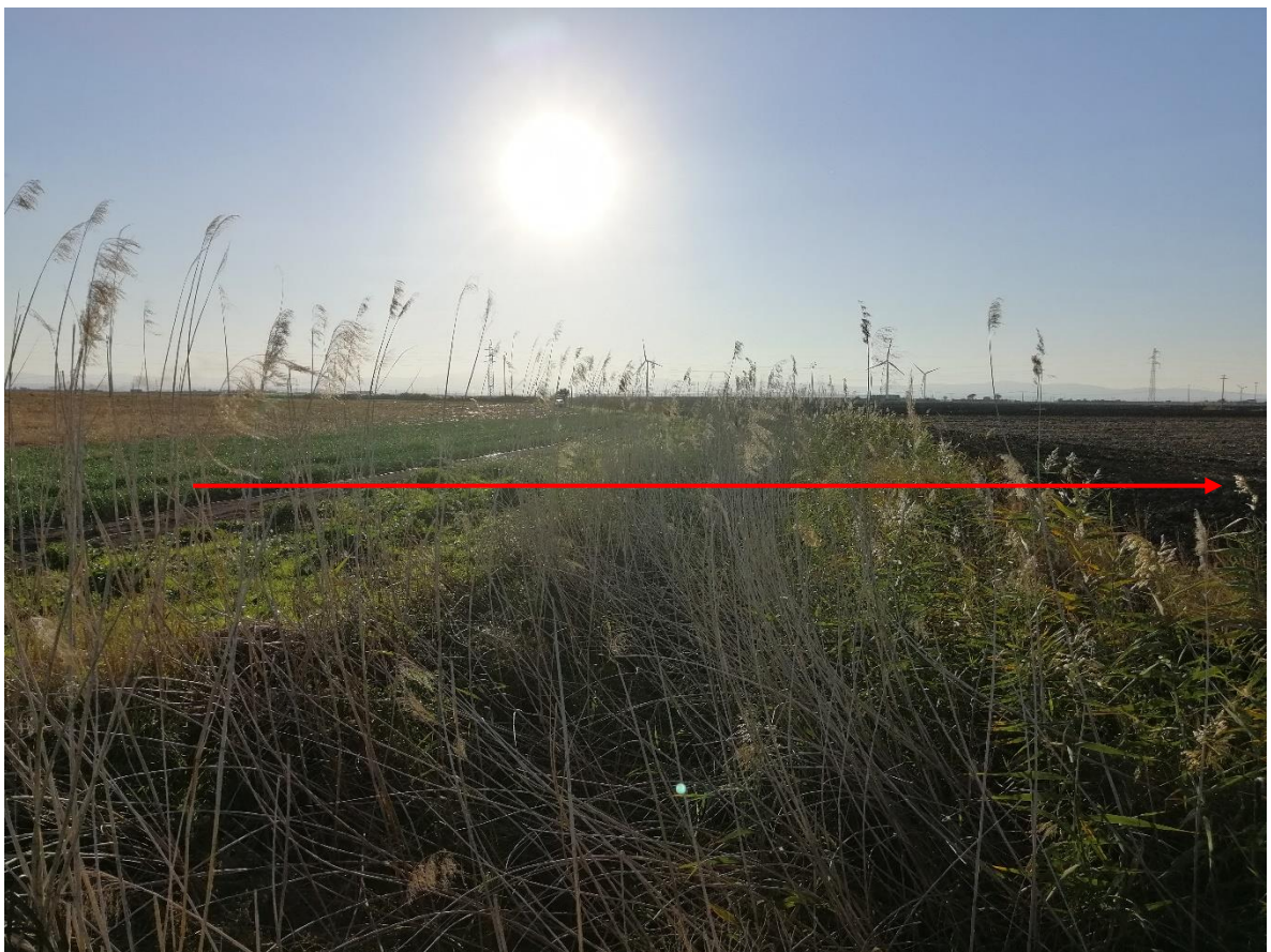
Fig. 5-2 – Canale Duanera nei pressi dell'interferenza con il metanodotto in progetto Tratto 2 (in rosso il tracciato del metanodotto).

Il Canale Duanera è un affluente del Torrente Celone, uno dei principali affluenti del Candelaro. E' un canale sfruttato per l'irrigazione, con andamento regolare sub-rettilineo. Nella zona dell'attraversamento l'alveo è di forma trapezia, con sponde e argini ricoperti di vegetazione ripariale.