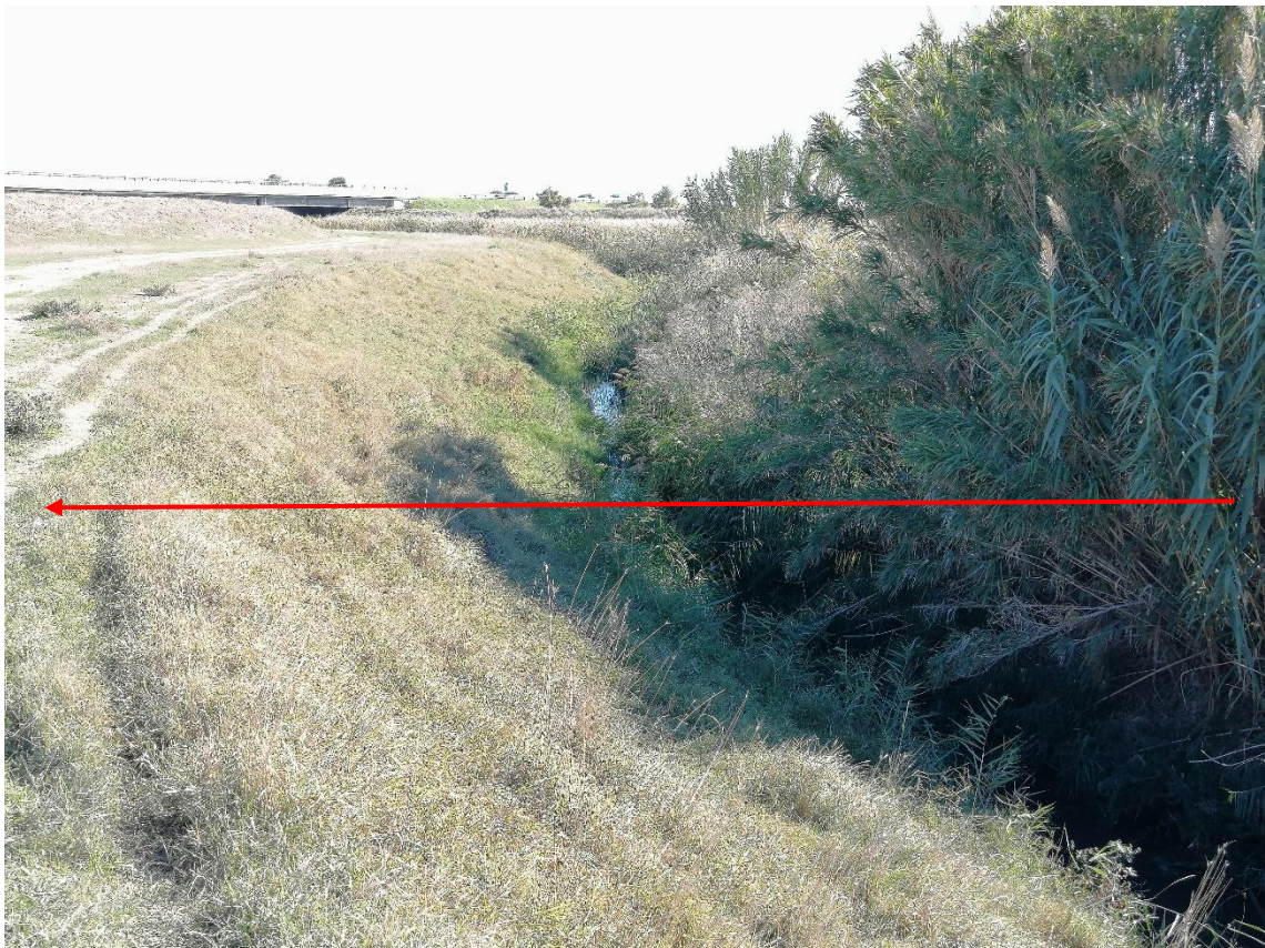
Fig. 5-3 – Torrente Salsola nei pressi dell'interferenza con il metanodotto in progetto Tratto 2 (in rosso il tracciato del metanodotto).

Nella zona in esame il torrente presenta un alveo regolare, con fitta vegetazione ripariale, soprattutto in sponda destra. L'andamento è lievemente meandrizzato.