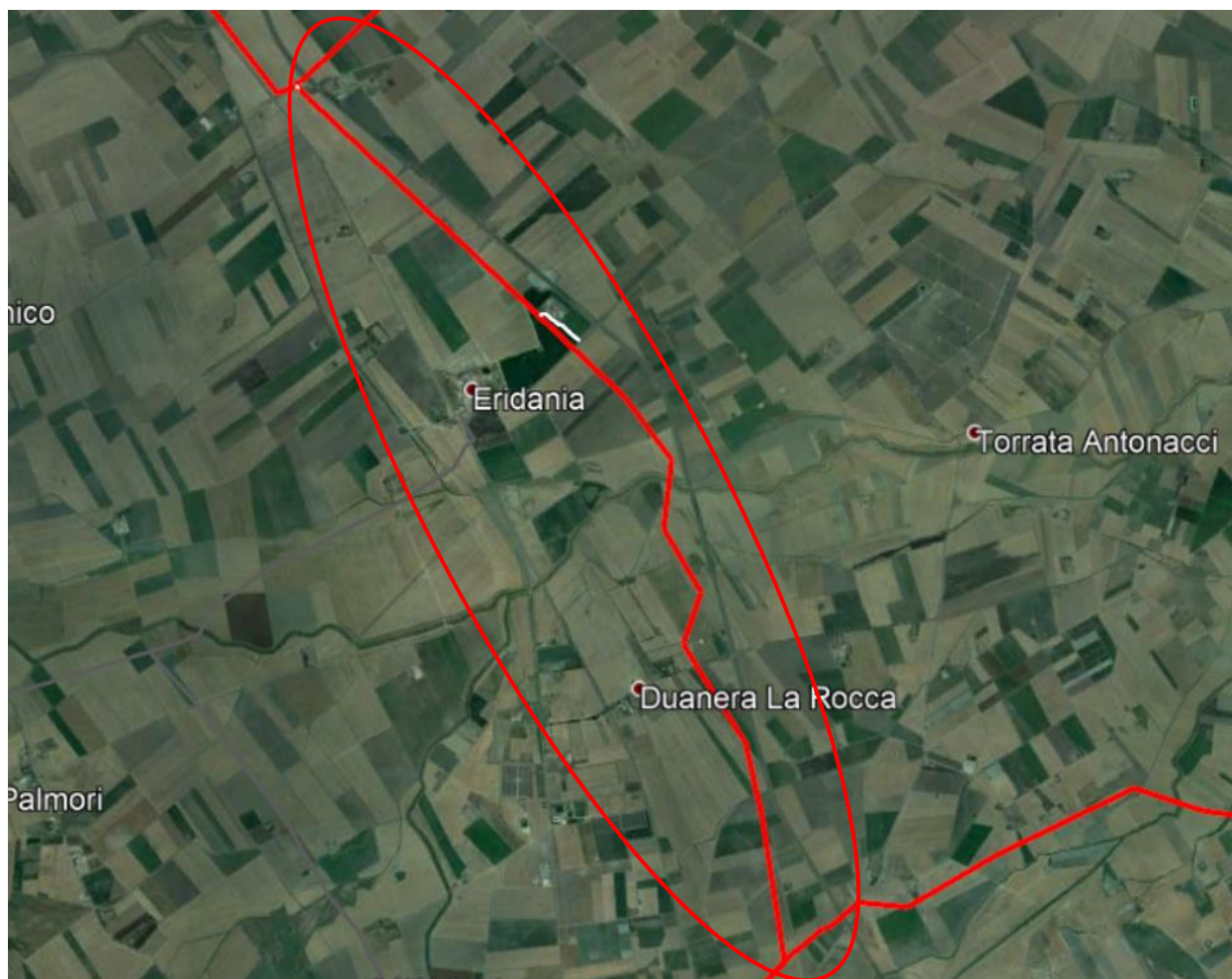
Fig. 2-1 – Inquadramento geografico dell'opera in progetto (Tratto 2 evidenziato nel cerchio rosso)