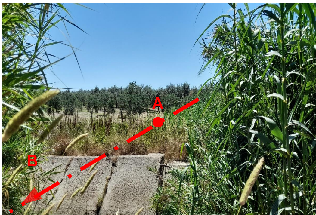
Figura 3.a: Panoramica della zona dell' attraversamento del Torrente Radicosa.

Si riporta di seguito la documentazione fotografica relativa all' attraversamenti del Torrente Radicosa oggetto di studio.