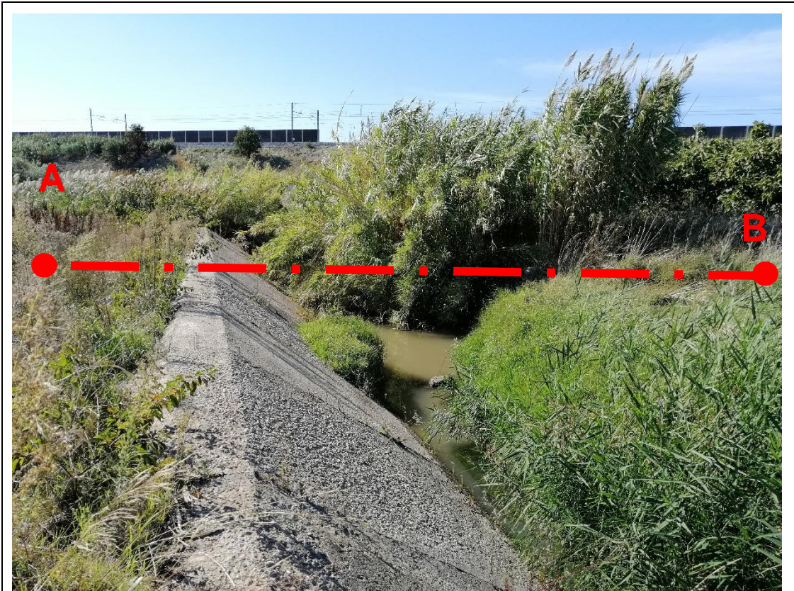
Figura 3.b: Panoramica della zona dell'attraversamento del Torrente Radicosa.