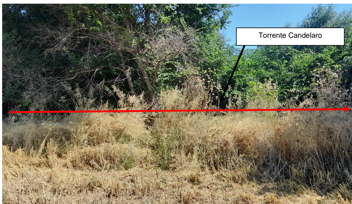
Figura 3.1: Attraversamento del Torrente Candelaro

Si riporta di seguito la documentazione fotografica relativa all' attraversamento oggetto di studio.