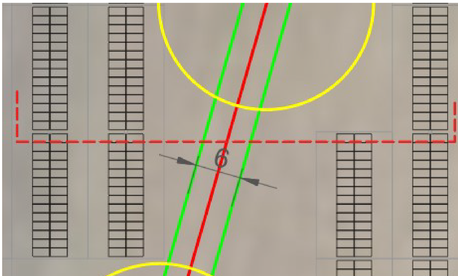
Punto di sezione - distanza minima dalla condotta comiziale SRTA: 6m (3 m per lato)