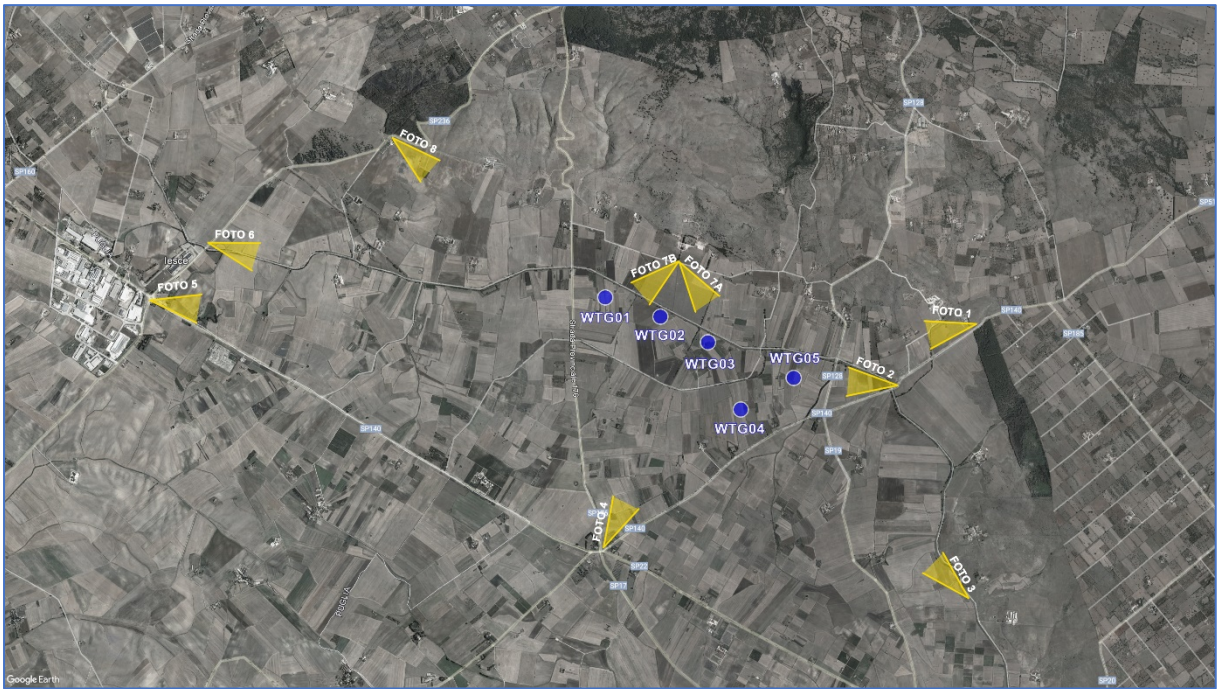
Figura 4 - Individuazione dei punti di presa fotografica dagli elementi sensibili

mentre i punti di vista da cui si è analizzata la visibilità del parco eolico di progetto sono indicati sull'ortofoto seguente: