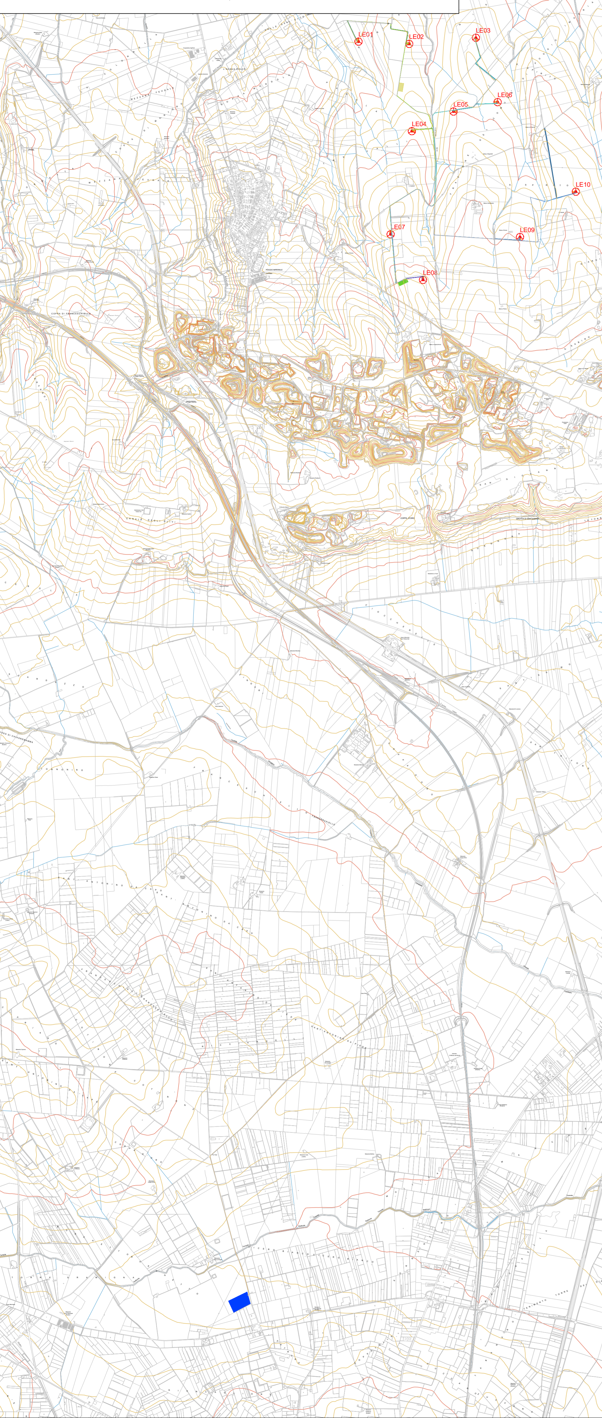
Planimetria su CTR ubicazione impianto eolico scala 1:25.000