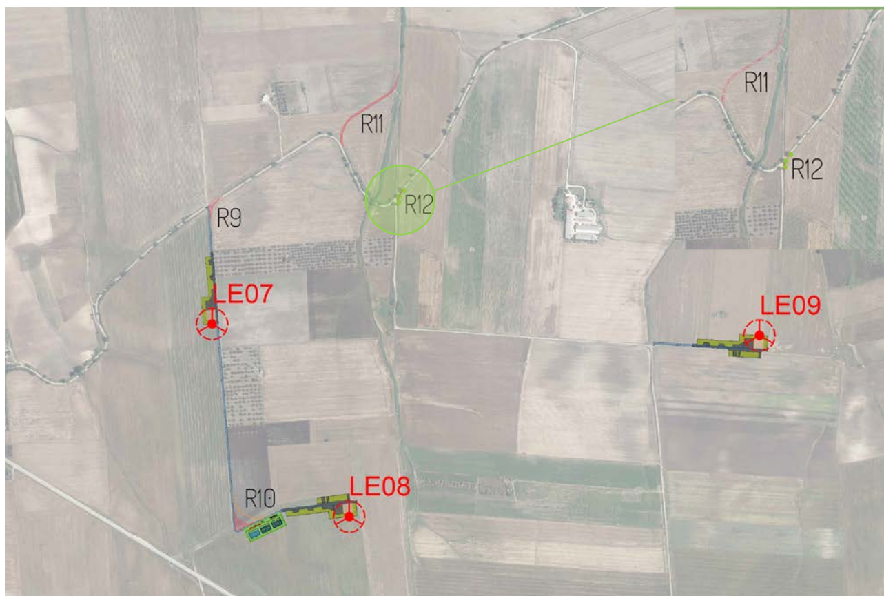
Alberi da espantare per realizzazione viabilità di cantiere (R12)