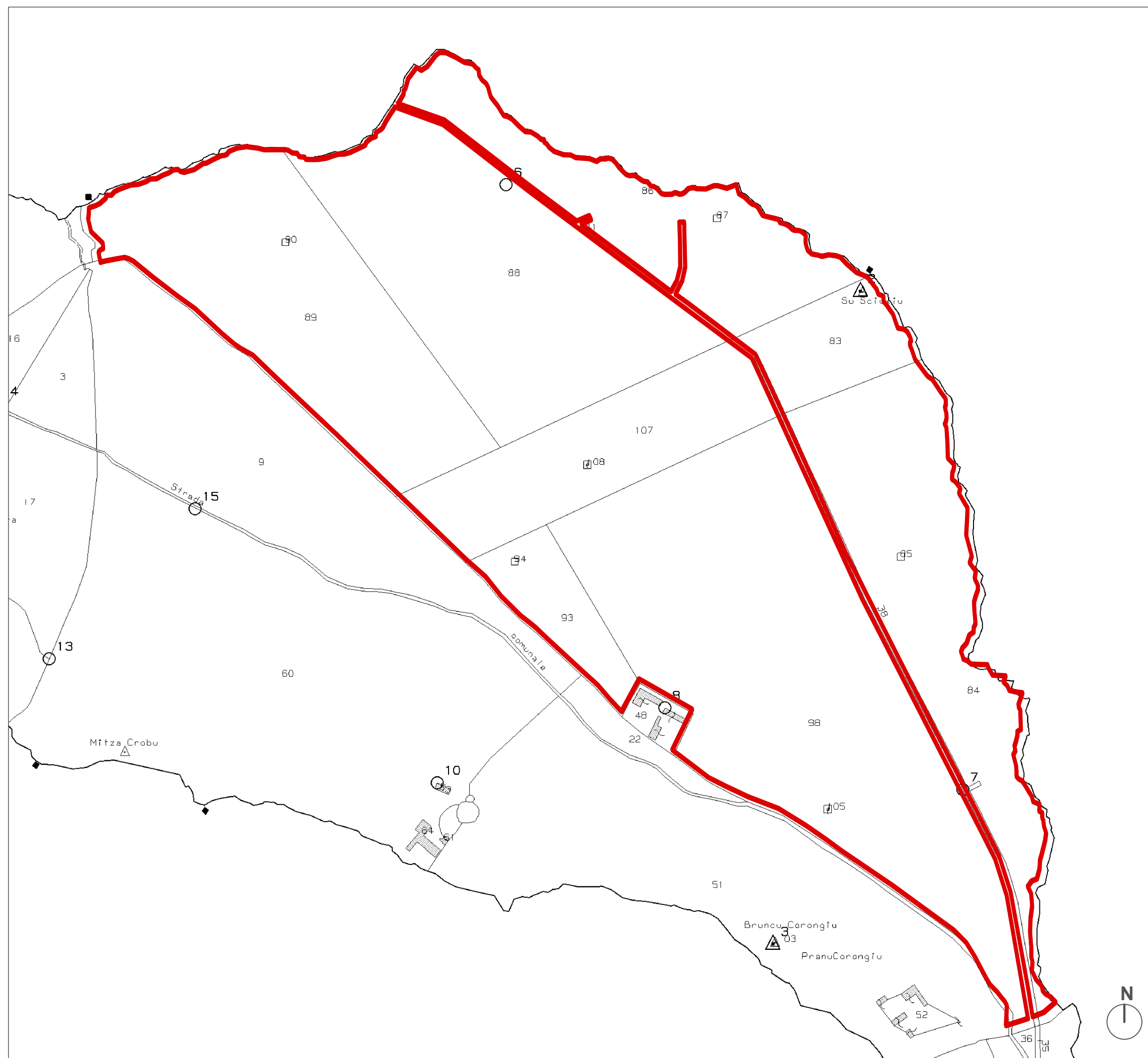
PLANIMETRIA CATASTALE scala 1: 5 000