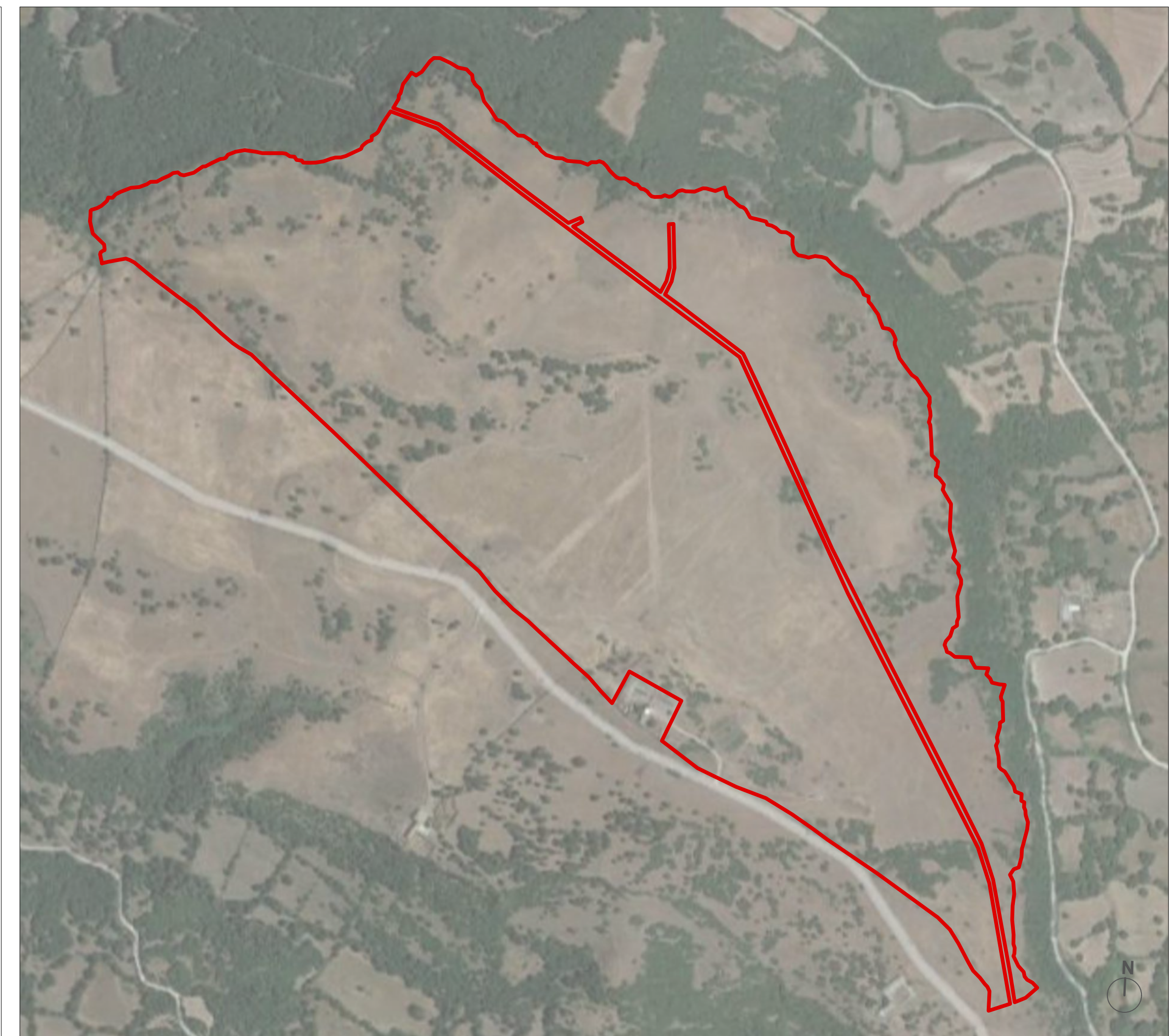
PLANIMETRIA ORTOFOTO scala 1:5 000