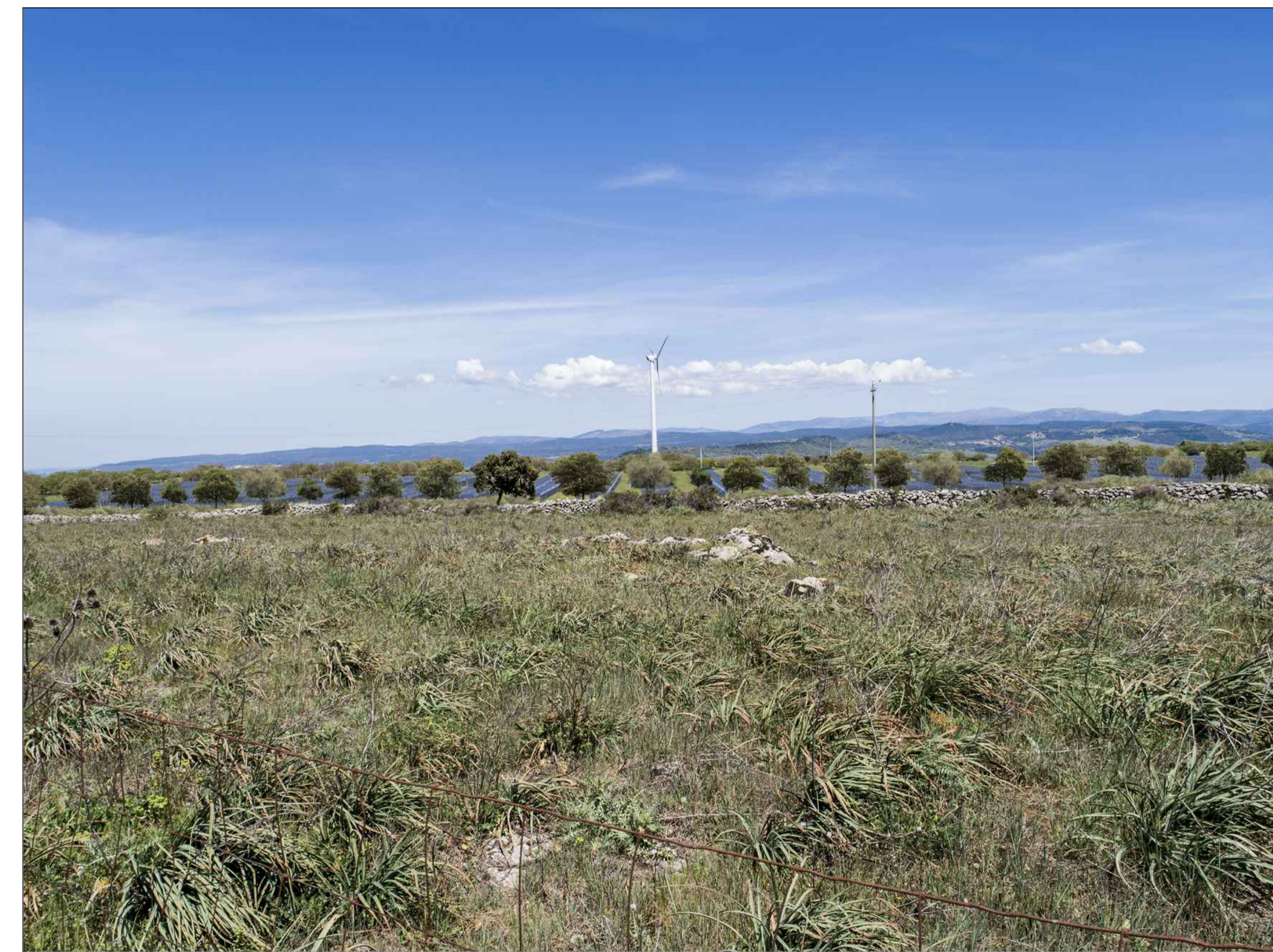
VISTA PUNTO DI SCATTO 2 - MITIGAZIONE (P.2)