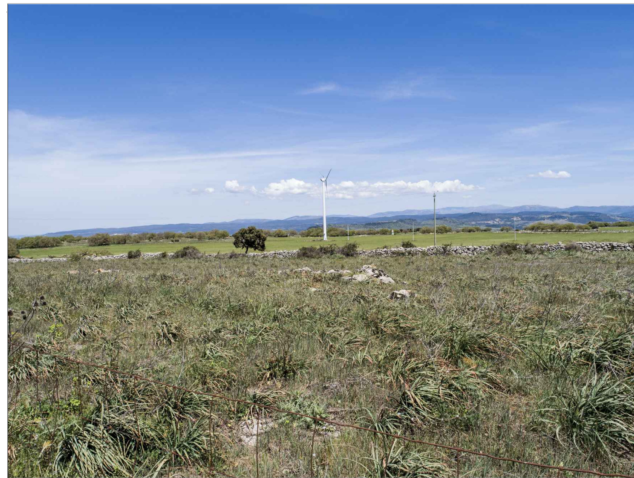
VISTA PUNTO DI SCATTO 2 - FOTO DELL'AREA (P.2)