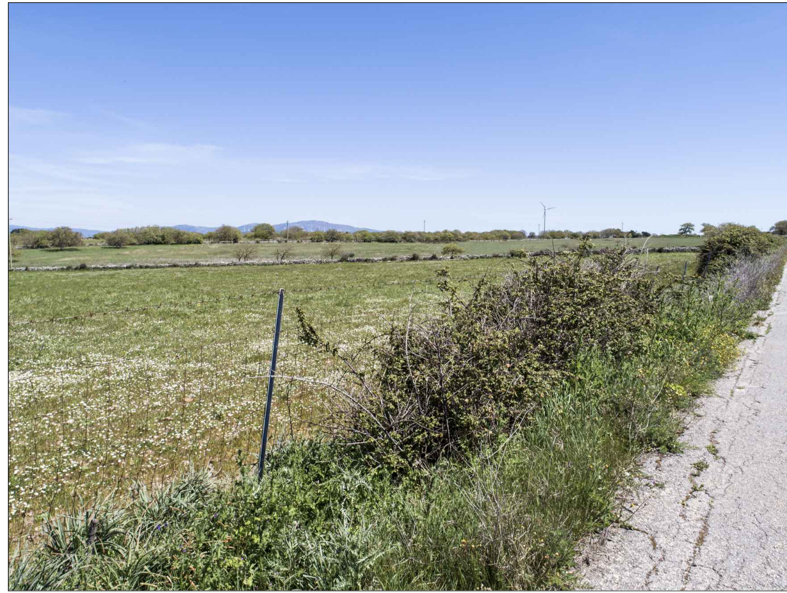
VISTA PUNTO DI SCATTO 1 - FOTO DELL'AREA (P.1)