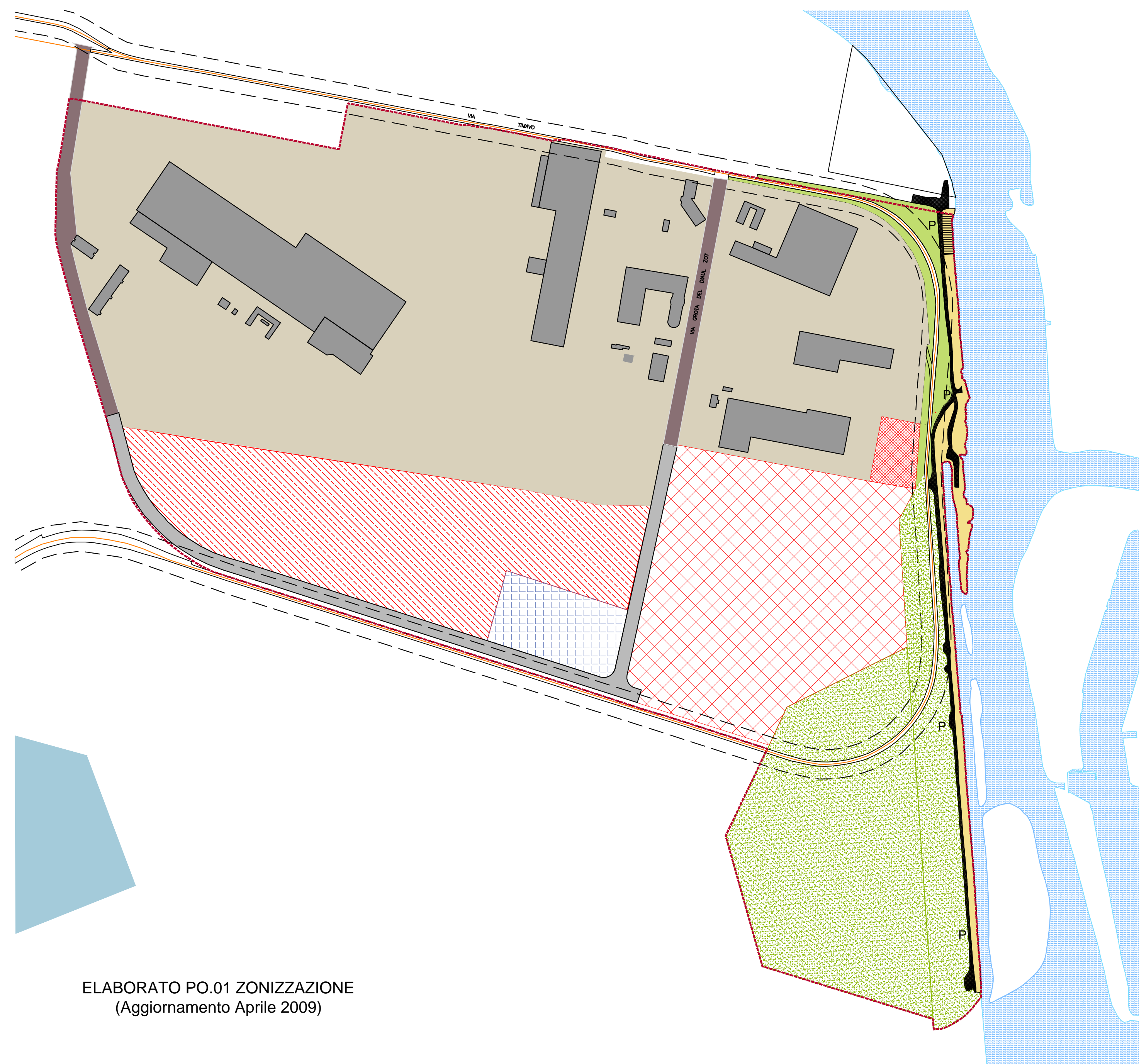
ELABORATO PO.01 ZONIZZAZIONE (Aggiornamento Aprile 2009)