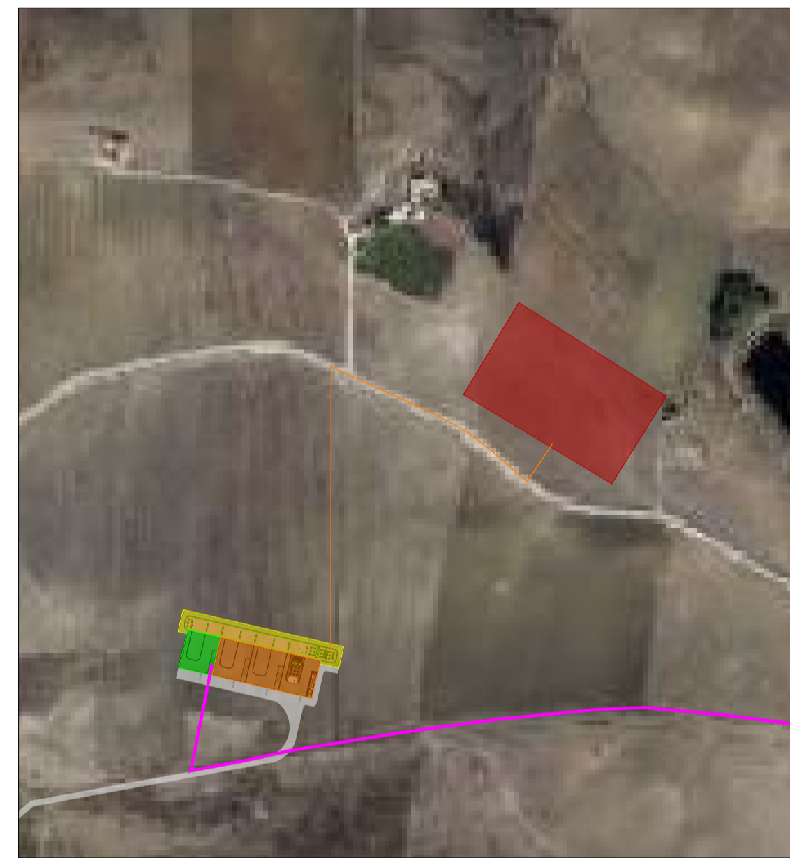
Inquadramento SSE e SE