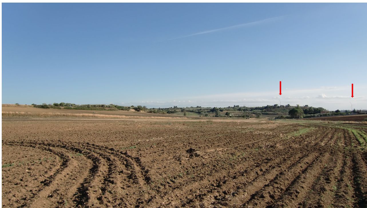
Punto 3 - FOTOINSERIMENTO