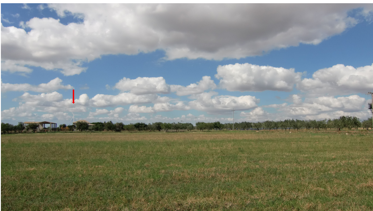
Punto 6 - FOTOINSERIMENTO