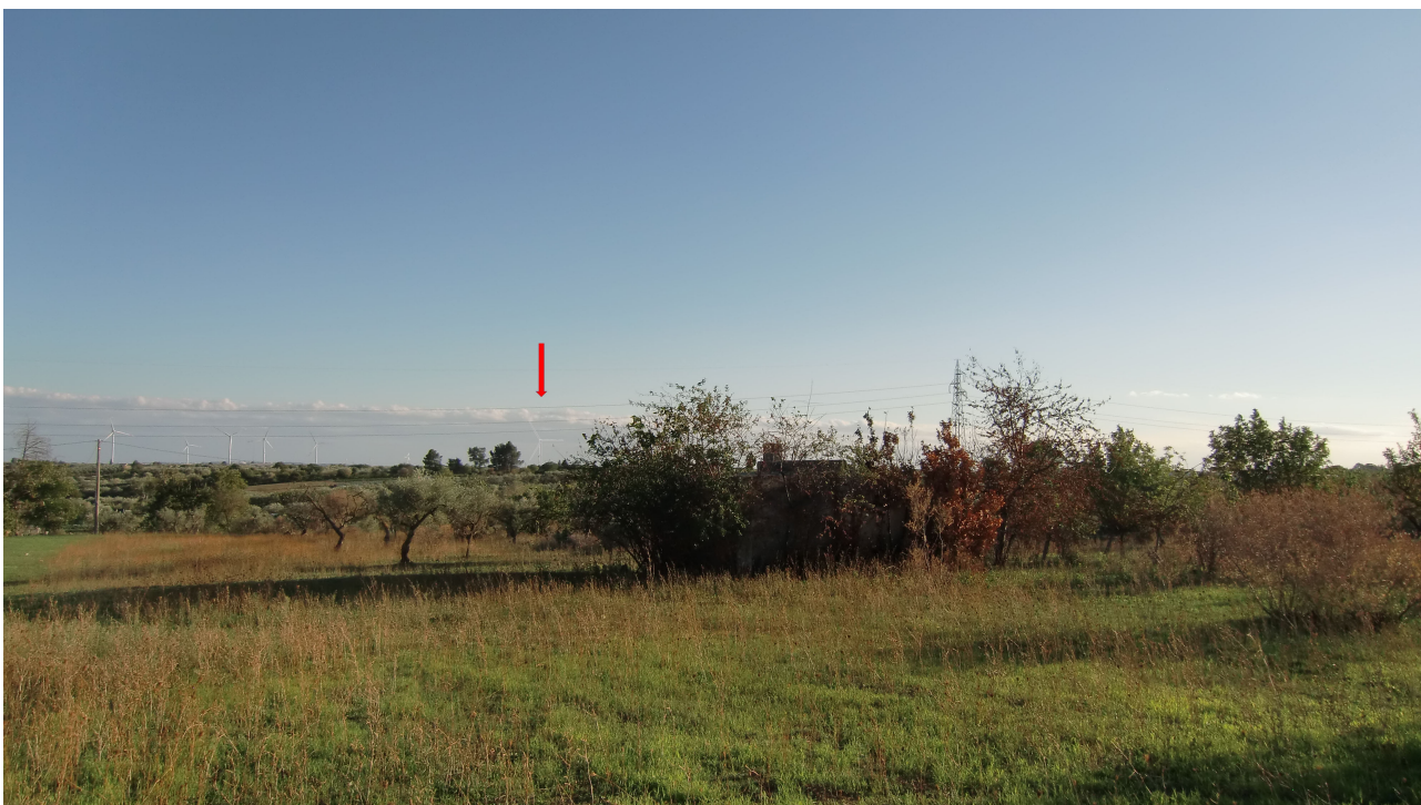
Punto 9 - FOTOINSERIMENTO