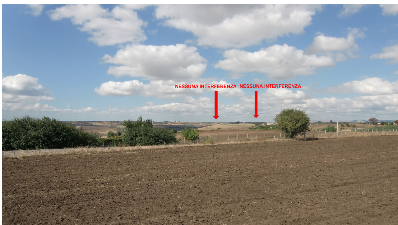
Punto 8 - FOTOINSERIMENTO