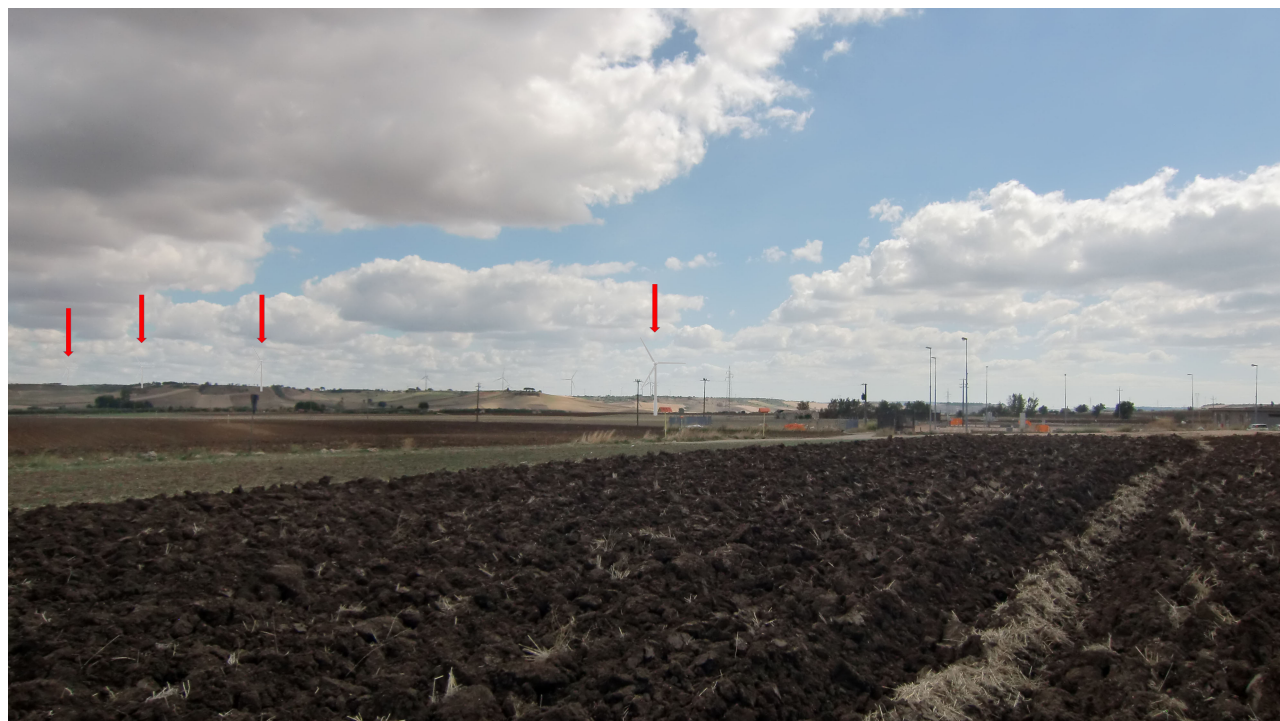
Punto 2 - FOTOINSERIMENTO