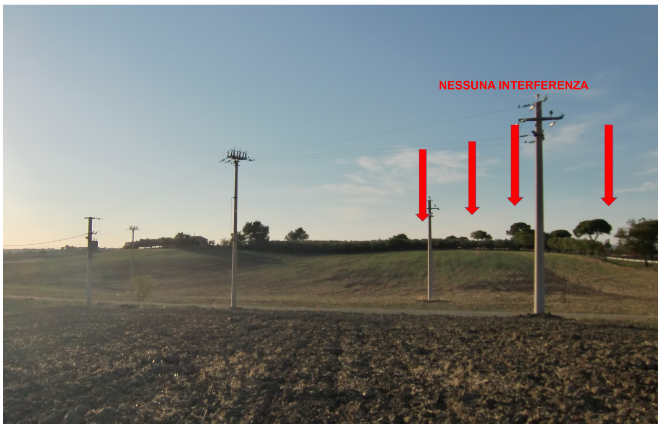
Punto 11 - FOTOINSERIMENTI