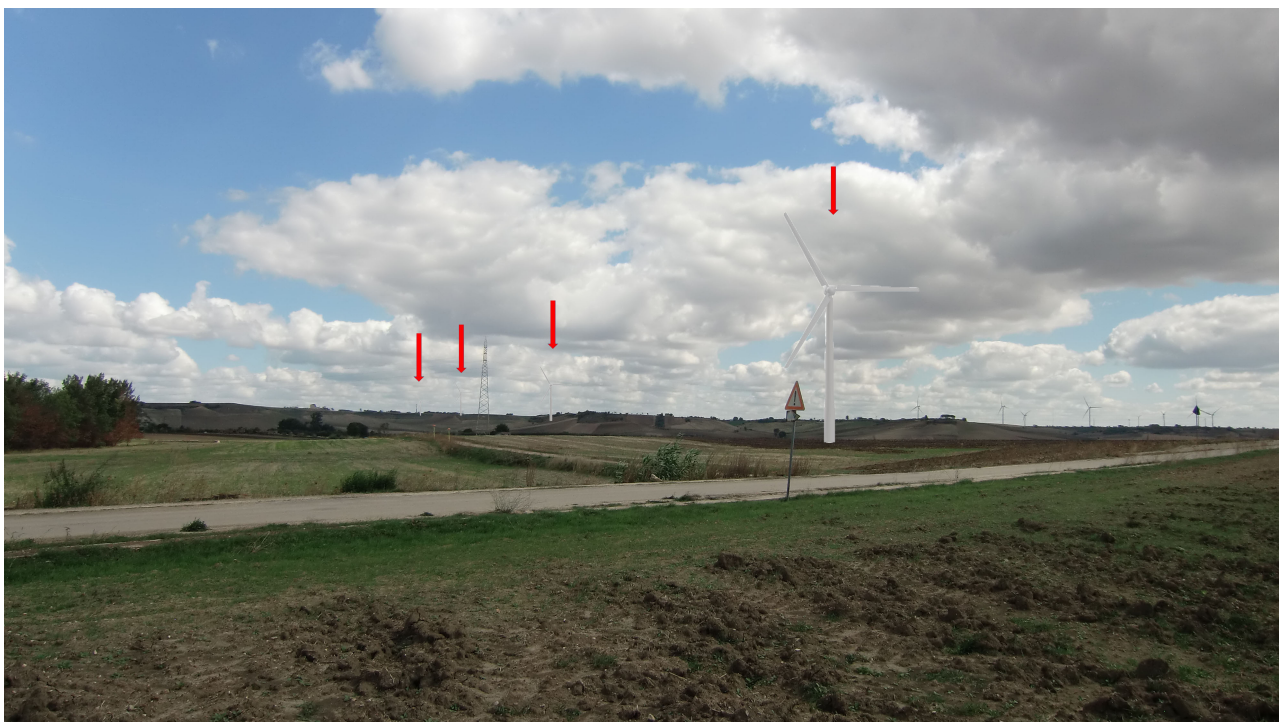
Punto 14 - FOTOINSERIMENTI