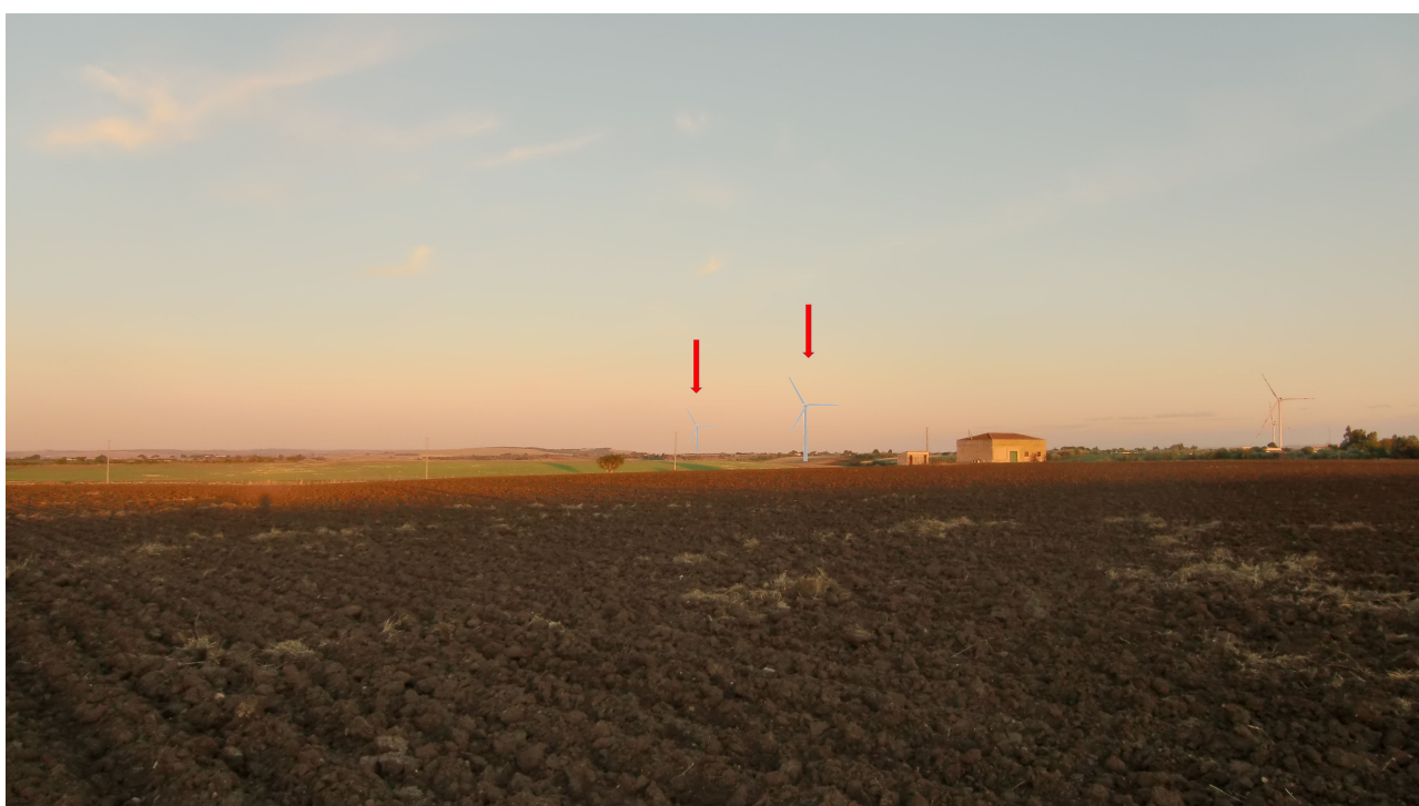
Punto 7 - FOTOINSERIMENTO