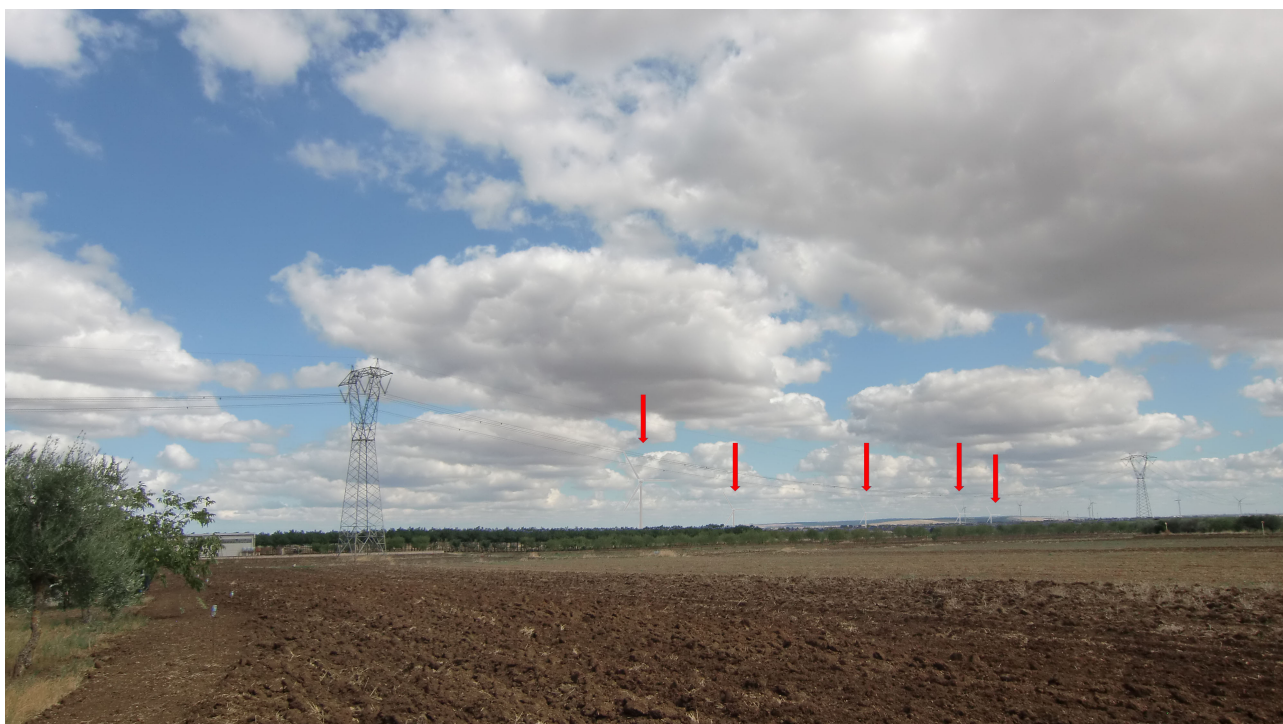
Punto 1 - FOTOINSERIMENTO