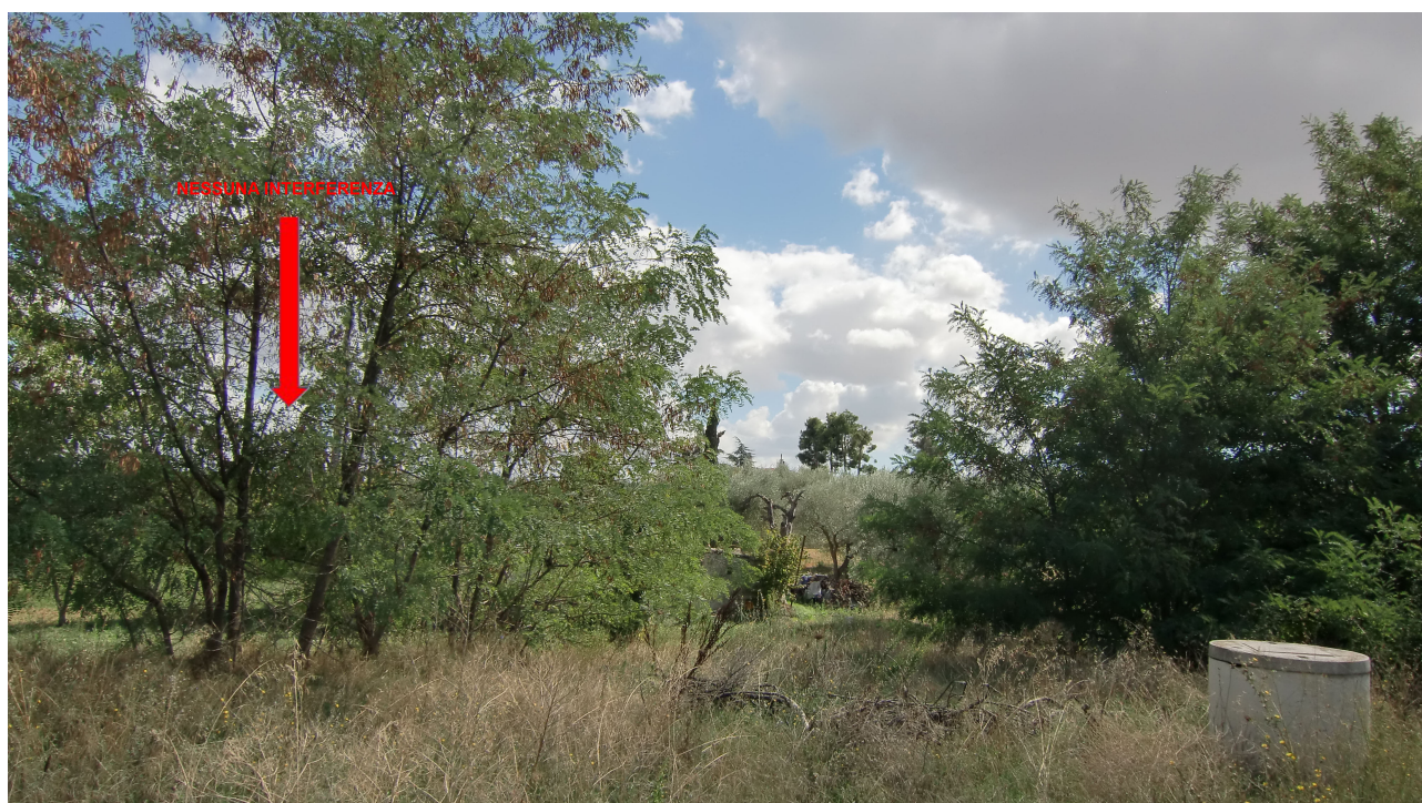
Punto 4 - FOTOINSERIMENTO