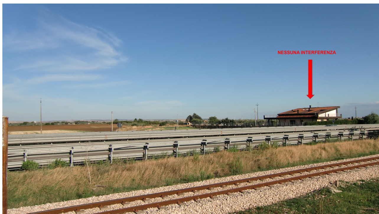
Punto 5 - FOTOINSERIMENTO