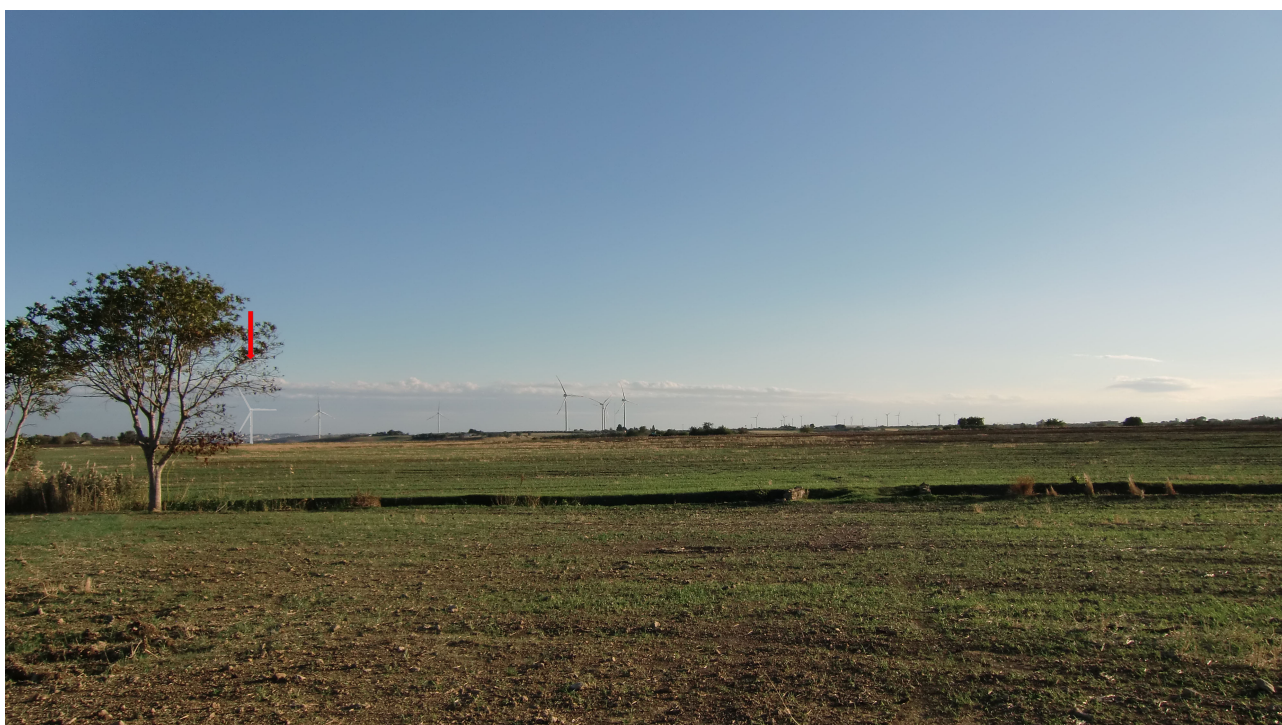
Punto 10 - FOTOINSERIMENTO