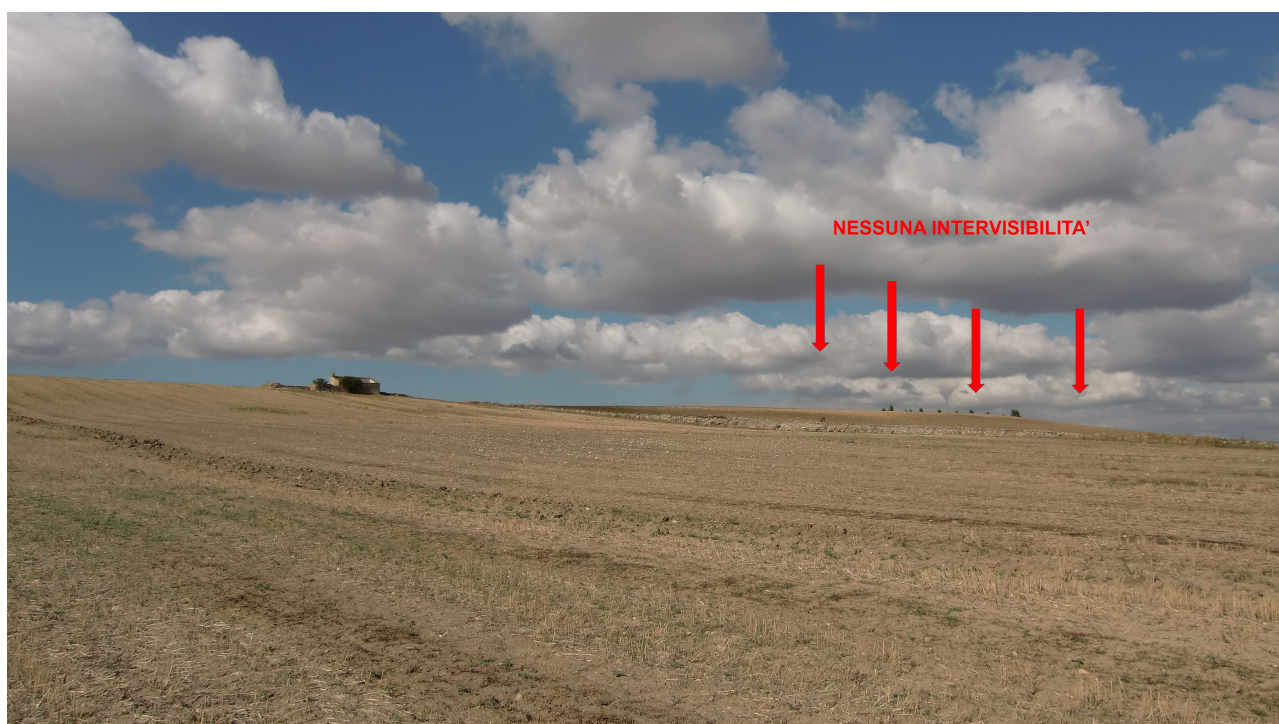
Punto 12 - FOTOINSERIMENTO