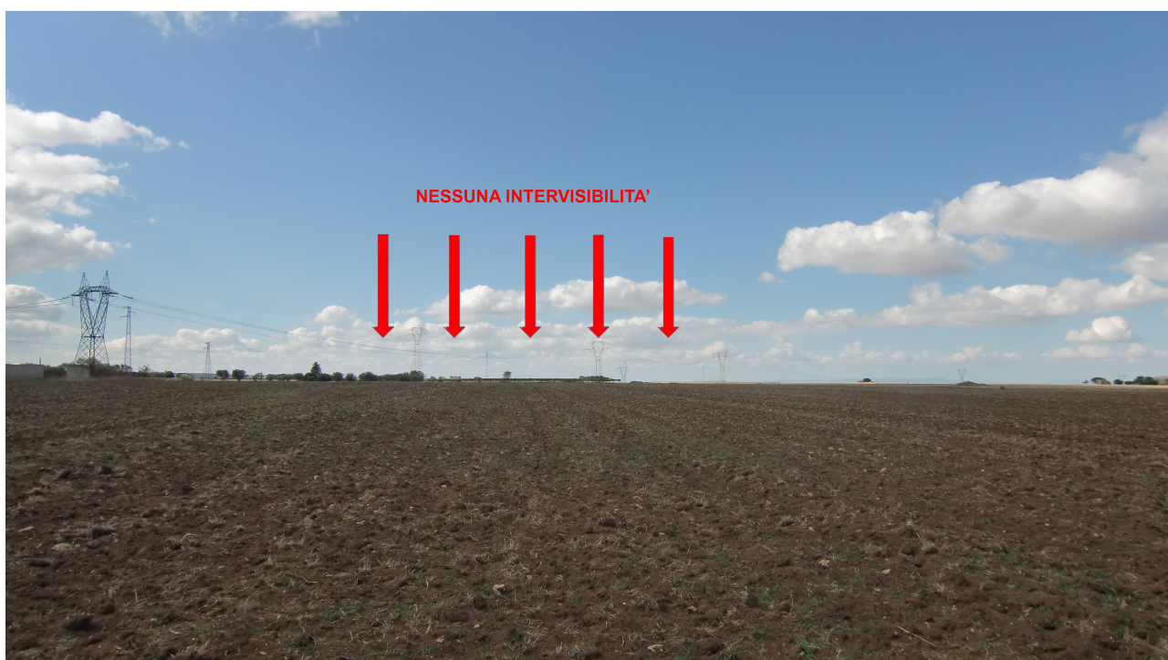
Punto 13 - FOTOINSERIMENTO