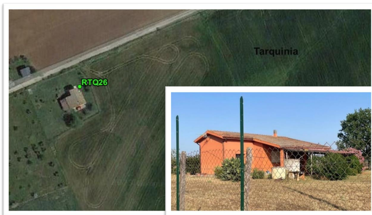
Figura 14 - Inquadramento su ortofoto e da sopralluogo RTQ26 (A4)