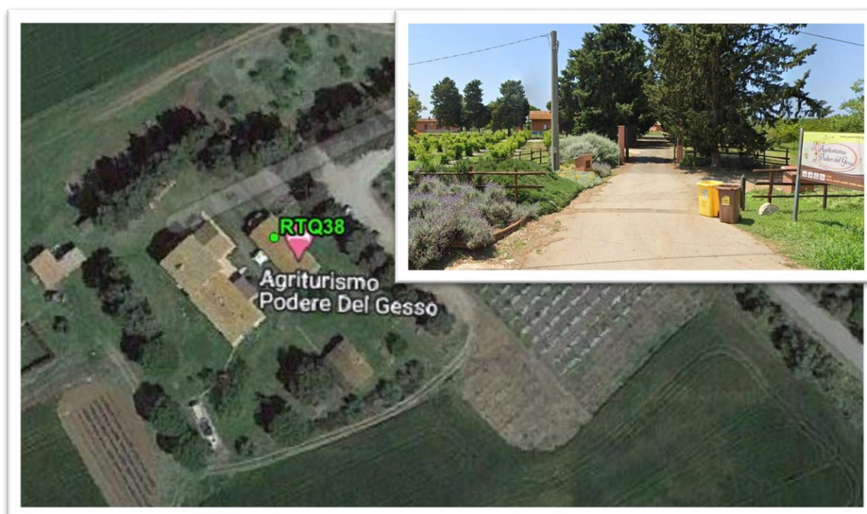
Figura 30 - Inquadramento su ortofoto e da sopralluogo RTQ38 (D10)