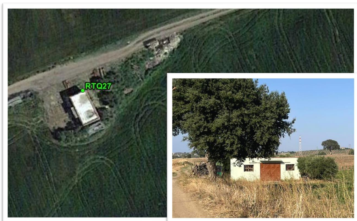
Figura 23 -Inquadramento su ortofoto e da sopralluogo RTQ27 (C2)