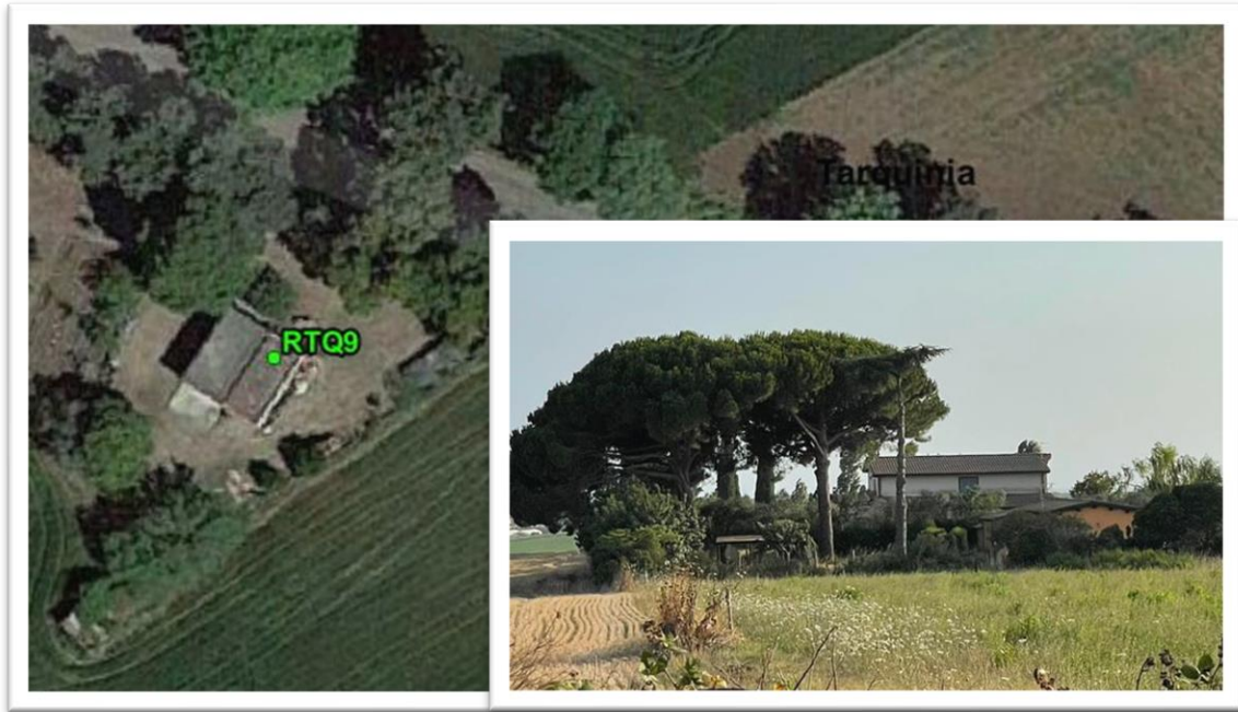
Figura 21 - Inquadramento su ortofoto e da sopralluogo RTQ9 (C2)