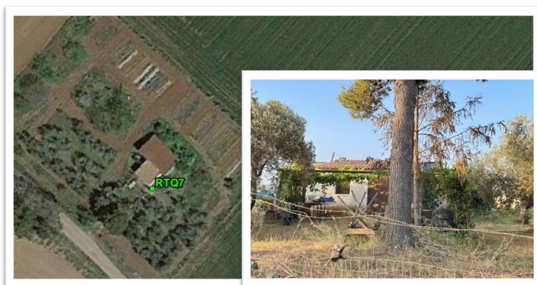
Figura 19 - Inquadramento su ortofoto e da sopralluogo RTQ7 (C2)