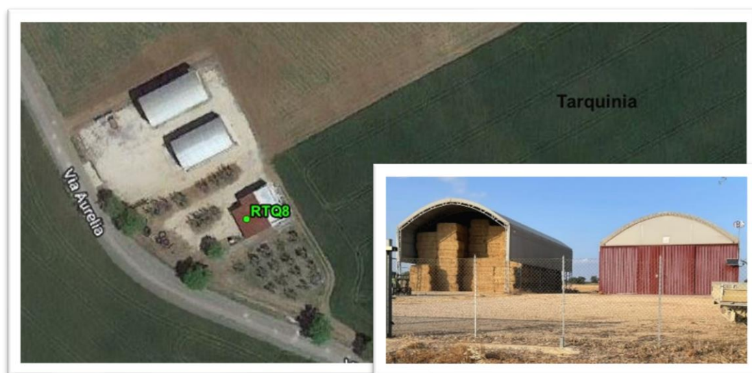
Figura 20 - Inquadramento su ortofoto e da sopralluogo RTQ8 (C6)