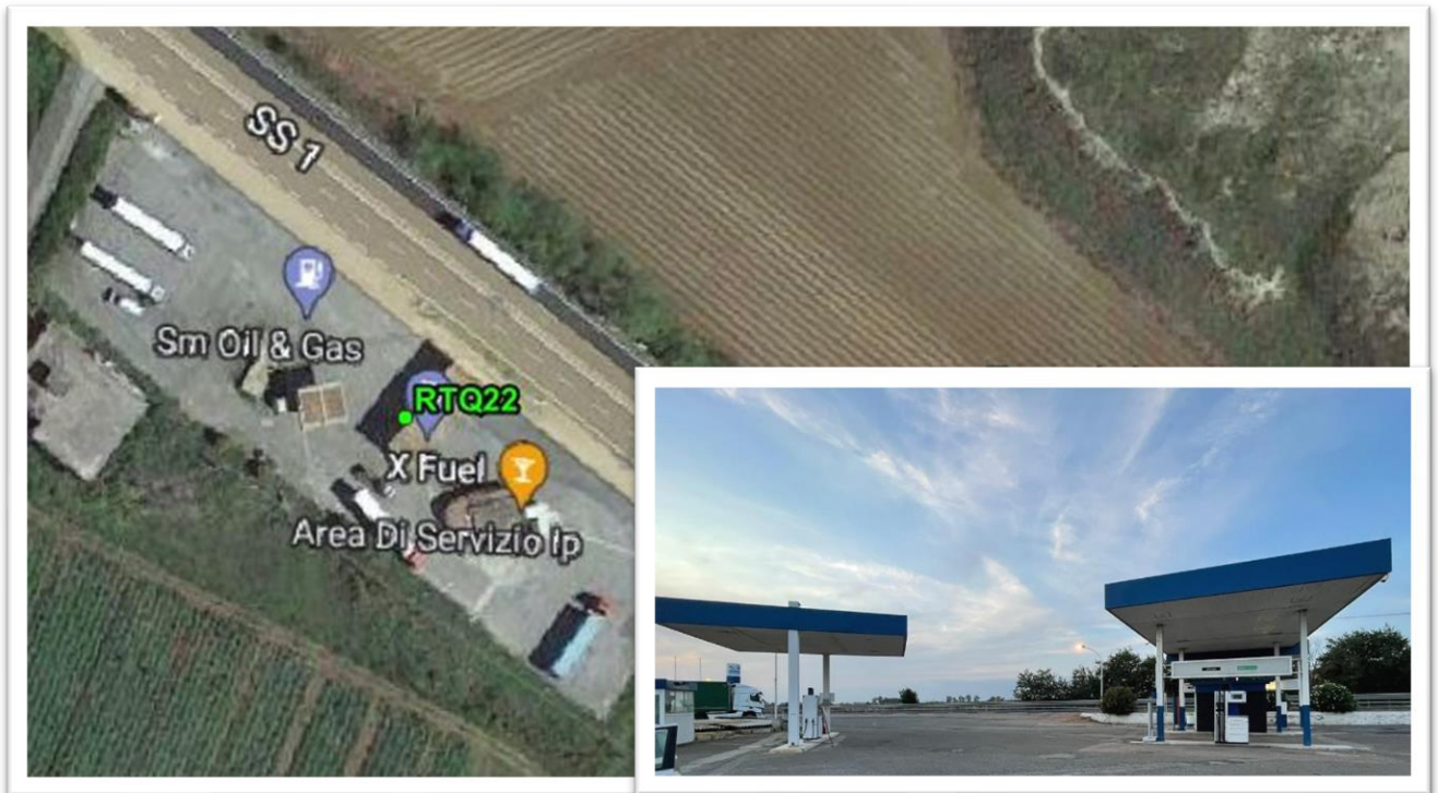
Figura 31 - Inquadramento su ortofoto e da sopralluogo RTQ22 (E3)