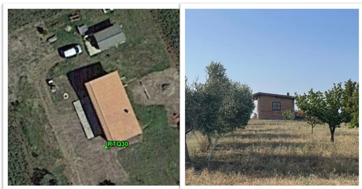
Figura 24 -Inquadramento su ortofoto e da sopralluogo RTQ30 (C2)