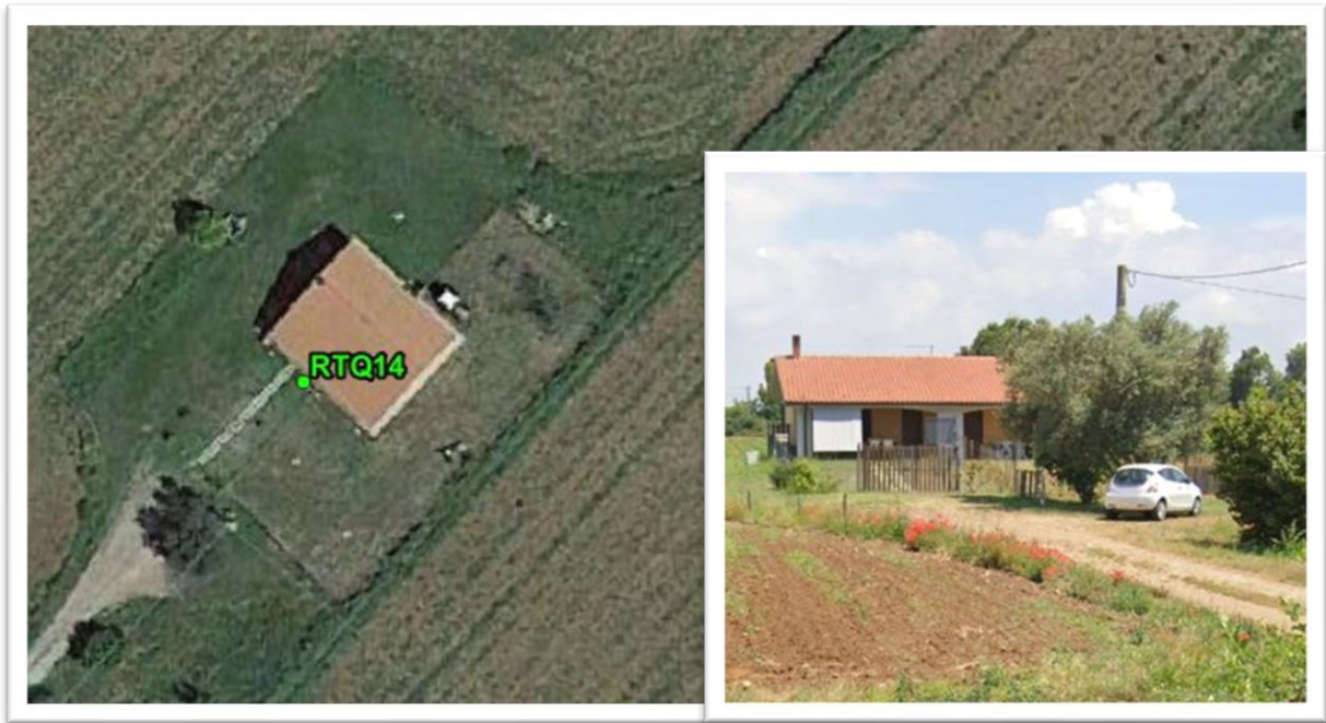
Figura 7 - Inquadramento su ortofoto e da sopralluogo RTQ14 (A3)