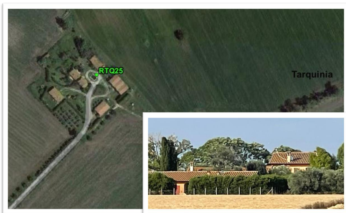
Figura 13 - Inquadramento su ortofoto e da sopralluogo RTQ25 (A2)