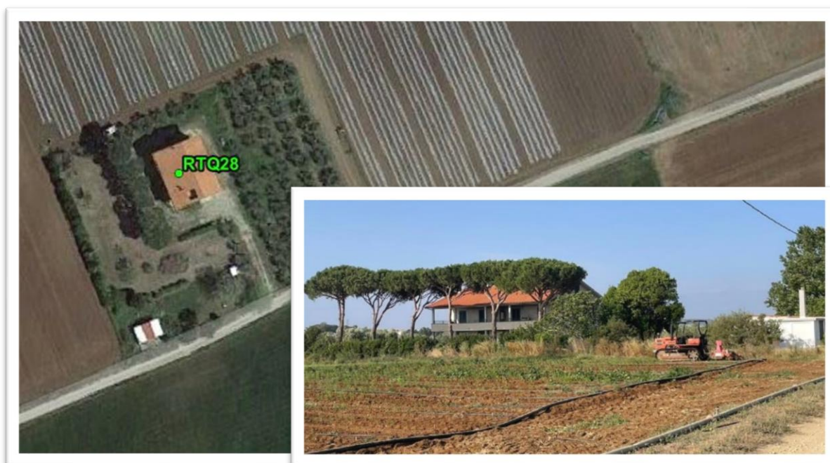
Figura 15 - Inquadramento su ortofoto e da sopralluogo RTQ28 (A2)