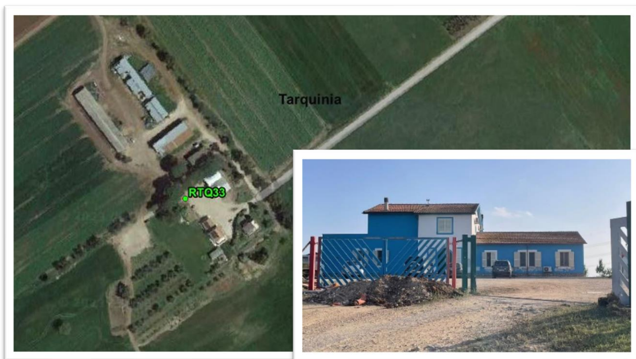
Figura 17 - Inquadramento su ortofot e da sopralluogo o RTQ33 (A3)