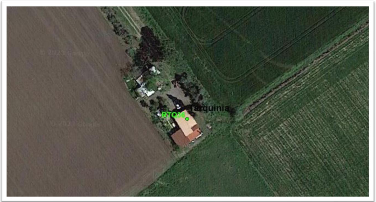
Figura 35 - Inquadramento su ortofoto RTQ36

Il ricettore RTQ36 presenta una strada di accesso percorribile, ma non è stato possibile effettuare un riscontro visivo in quanto era presente un cancello che non permetteva il proseguo. Da ortofoto sembra riconducibile ad un deposito per ricovero attrezzi, per cui sarà prevista la verifica del rispetto dei limiti assoluti sia per il diurno che per il notturno, mentre la verifica differenziale riguarderà il solo periodo Diurno.