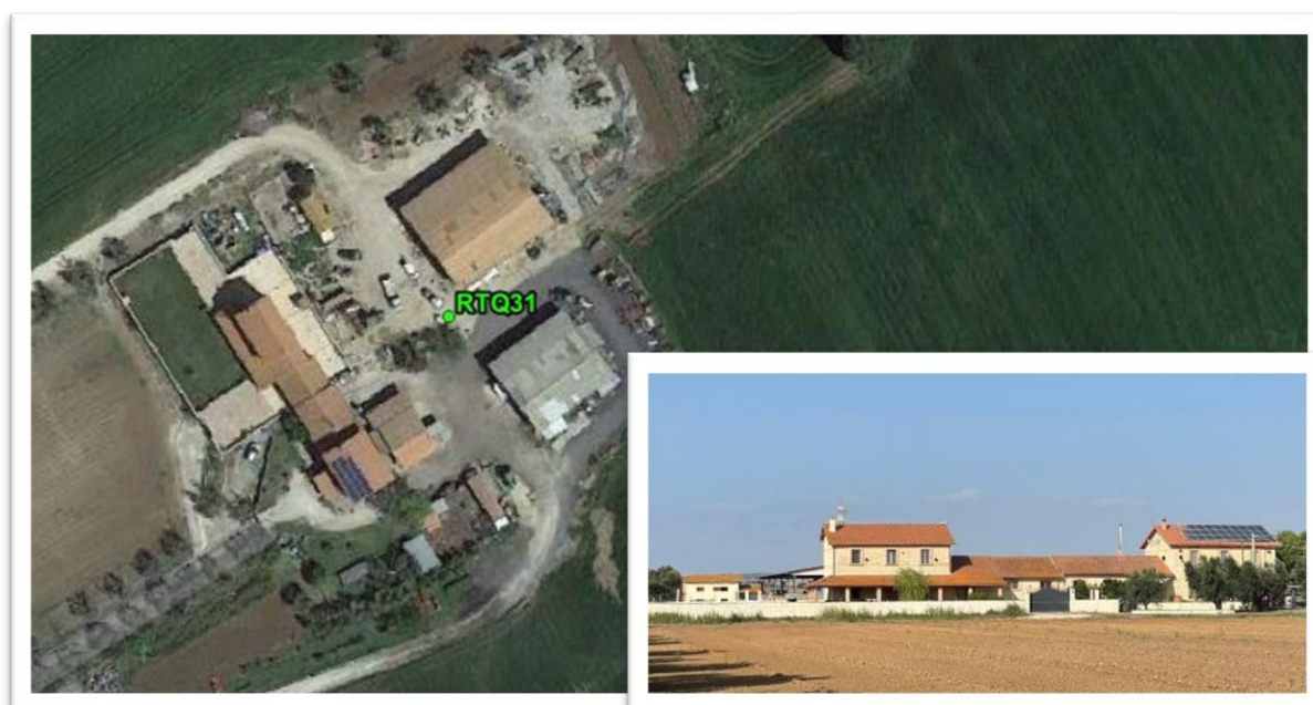
Figura 16 - Inquadramento su ortofoto e da sopralluogo RTQ31 (A2)