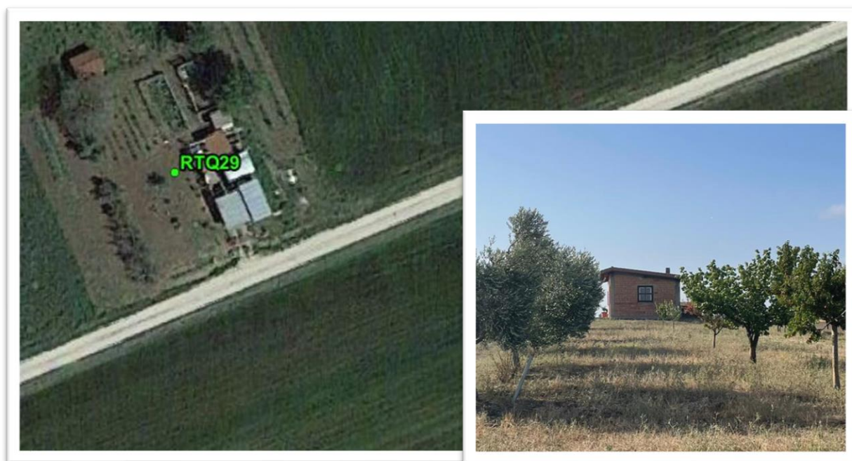
Figura 29 - Inquadramento su ortofoto e da sopralluogo RTQ29 (D1)