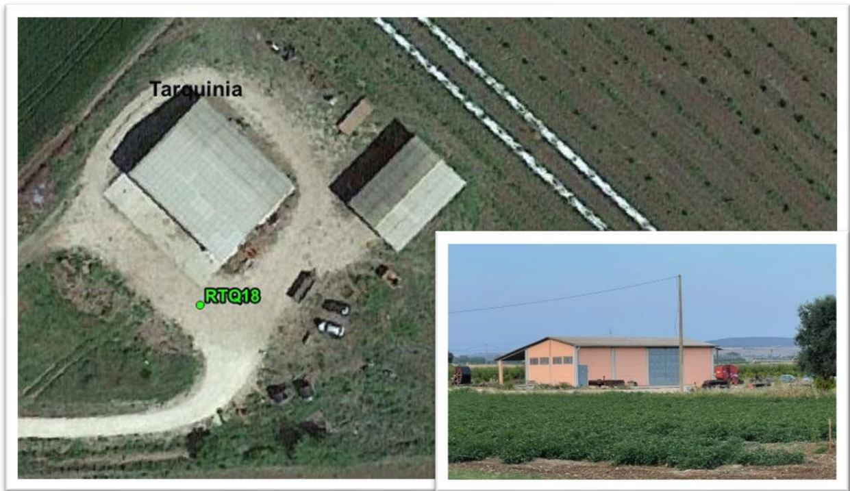
Figura 26 - Inquadramento su ortofoto e da sopralluogo RTQ18 (D10)