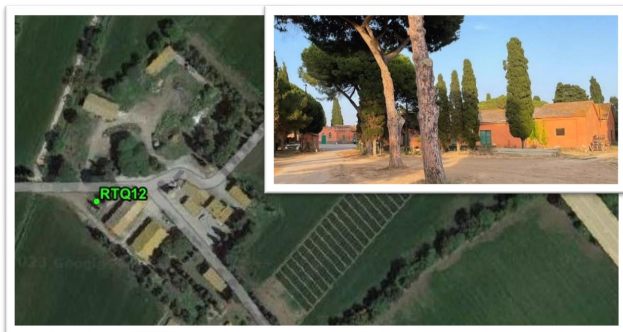
Figura 6 - Inquadramento su ortofoto e da sopralluogo RTQ12 (A3)