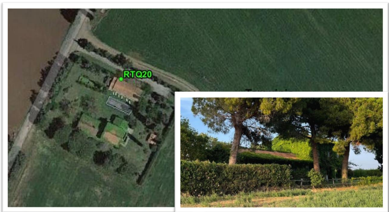
Figura 27 - Inquadramento su ortofoto e da sopralluogo RTQ20 (D8)