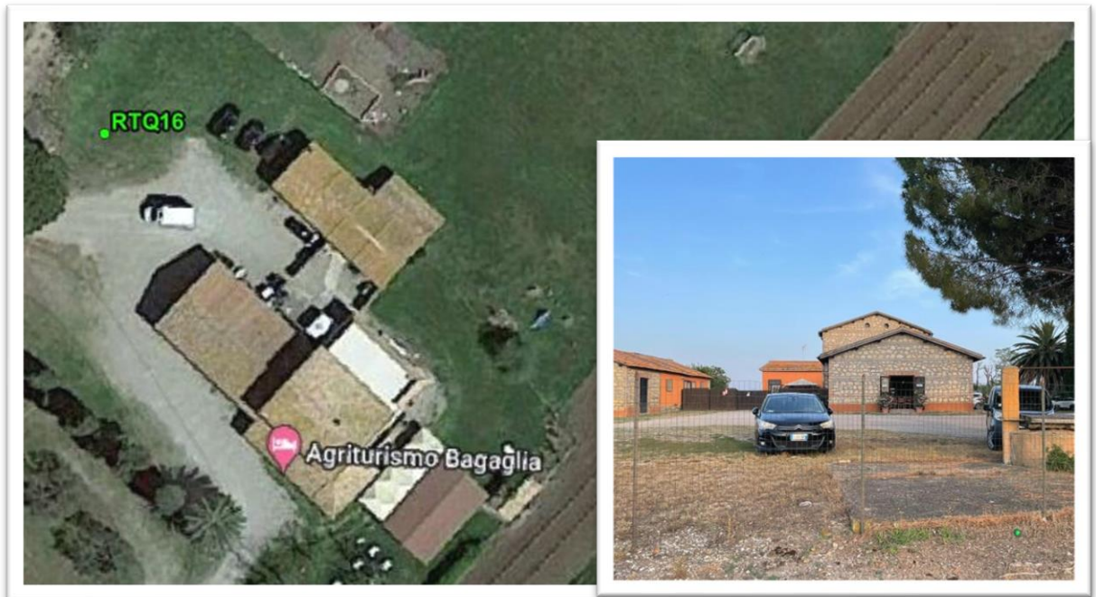
Figura 8 - Inquadramento su ortofoto e da sopralluogo RTQ16 (A3)