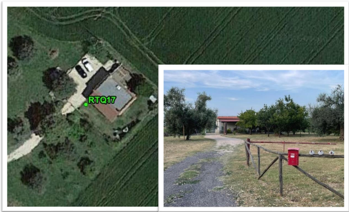
Figura 9 – Inquadramento su ortofoto e da sopralluogo RTQ17 (A3)