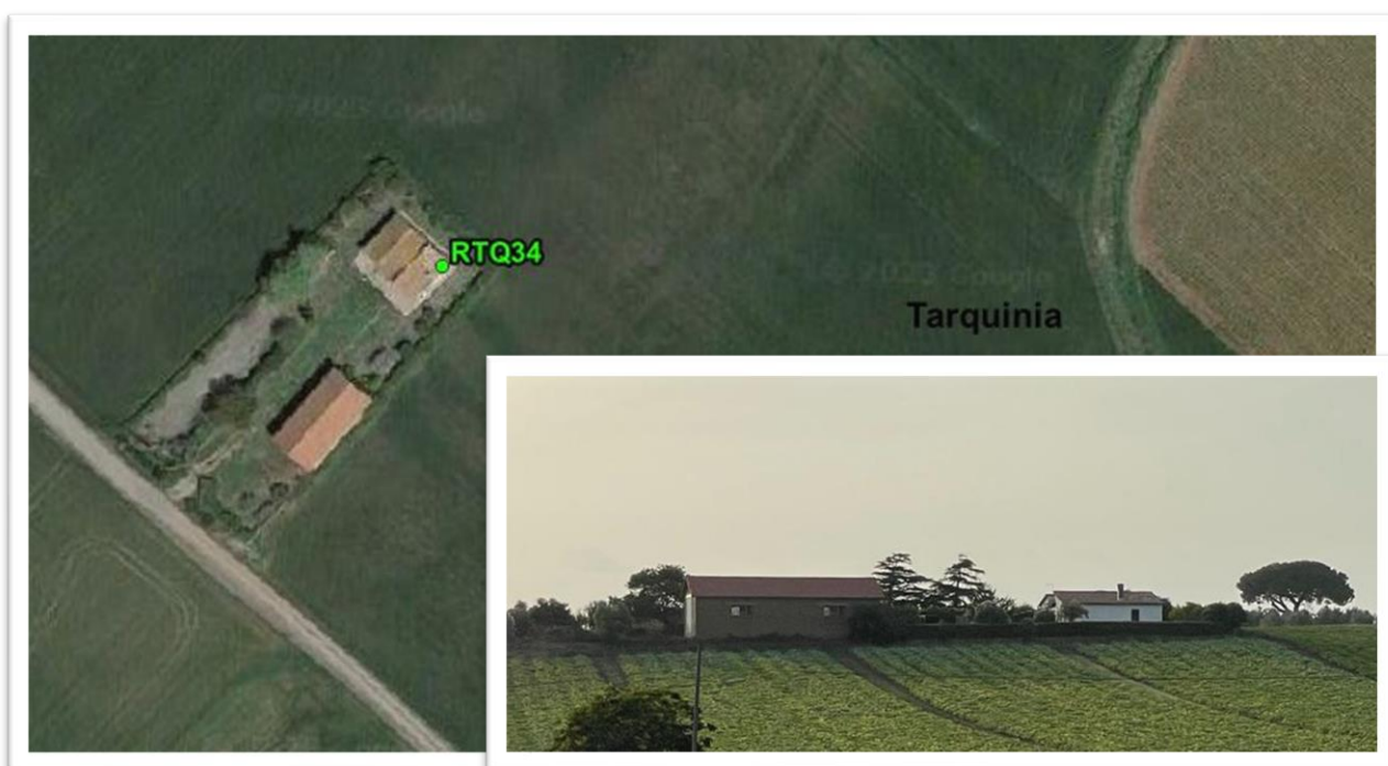
Figura 18 - Inquadramento su ortofoto e da sopralluogo RTQ34 (A3)