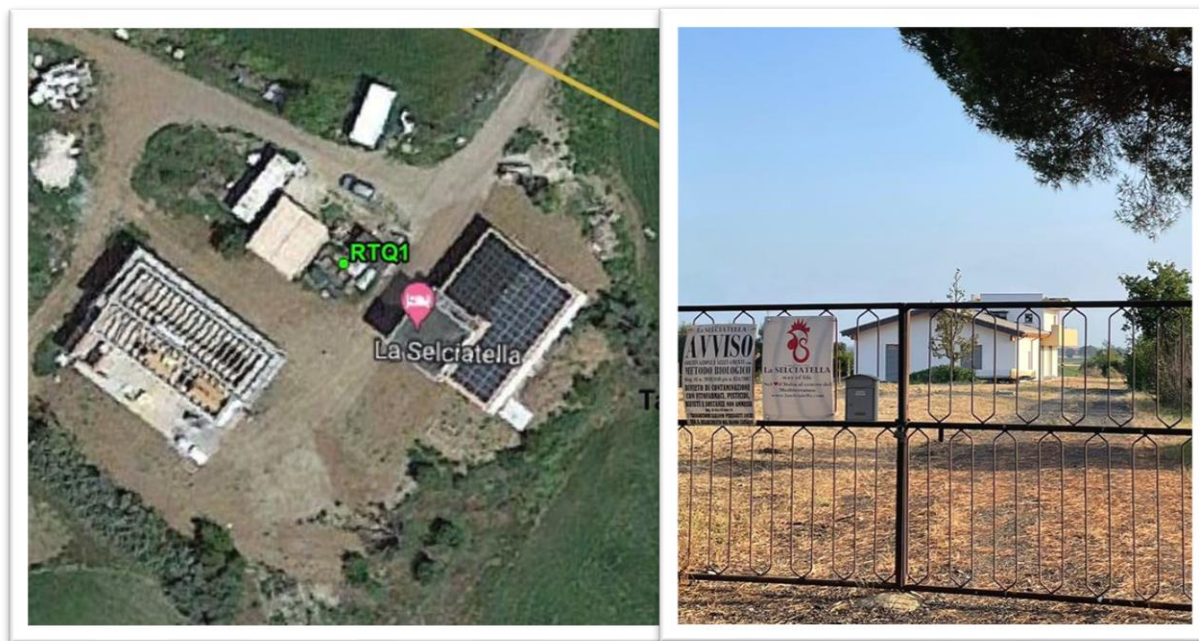
Figura 1 – Inquadramento su Ortofoto e da sopralluogo RTQ1 (A2)