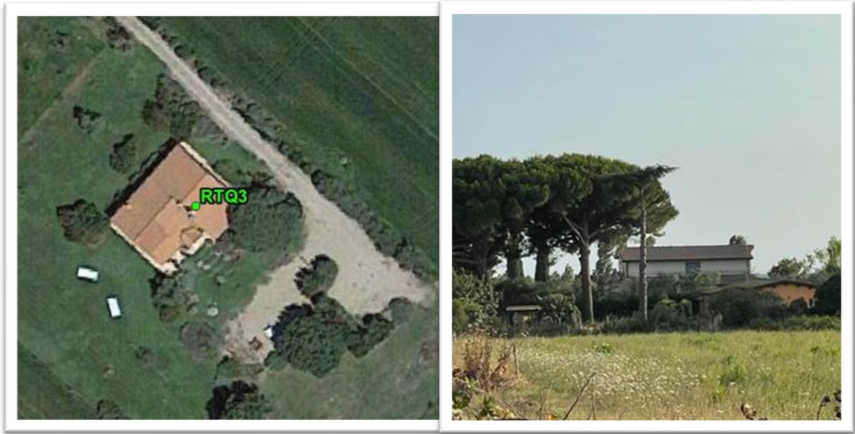
Figura 3 - Inquadramento su Ortofoto e da sopralluogo RTQ3 (A7)