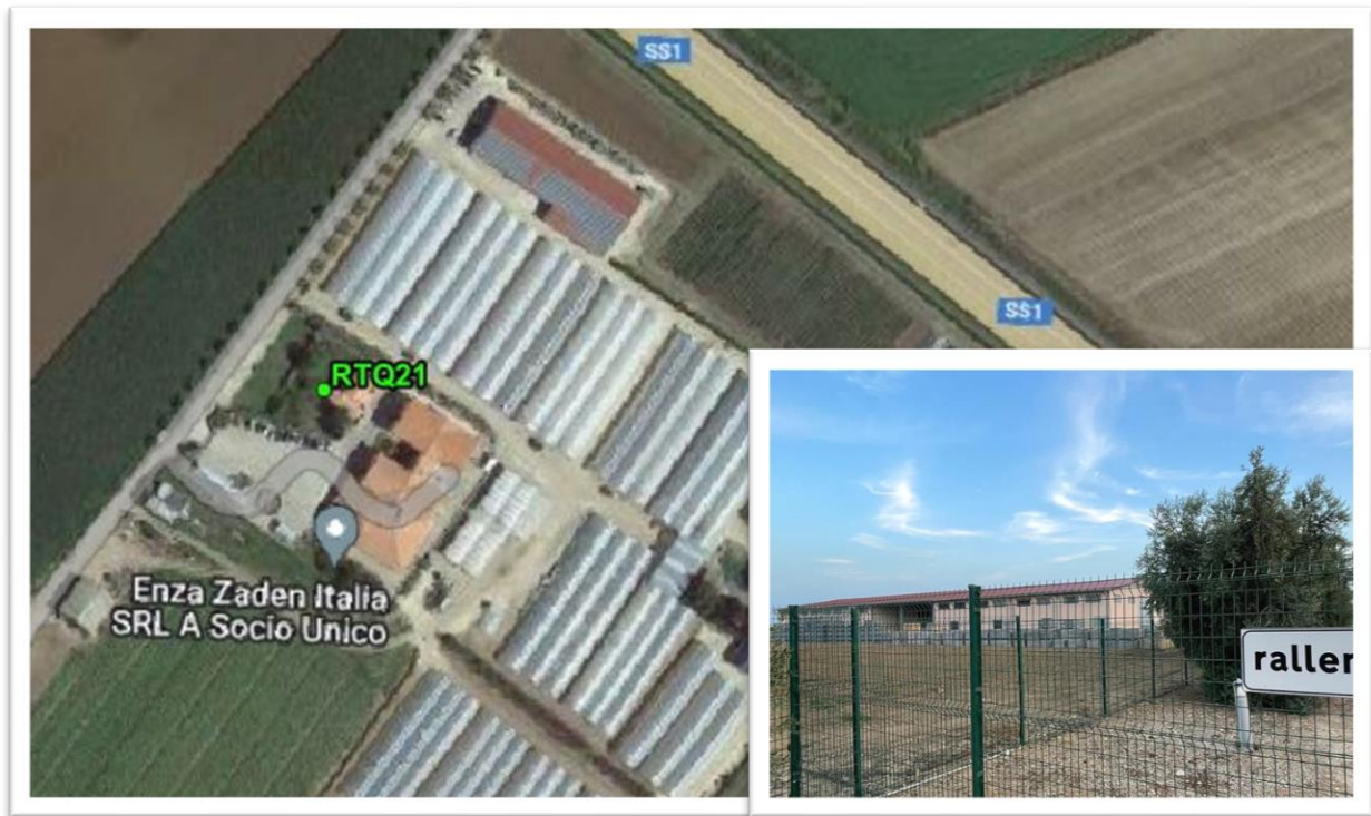
Figura 11 - Inquadramento su ortofoto e da sopralluogo RTQ21 (A7)