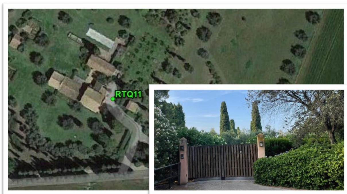
Figura 5 - Inquadramento su ortofoto e da sopralluogo RTQ11 (A8)