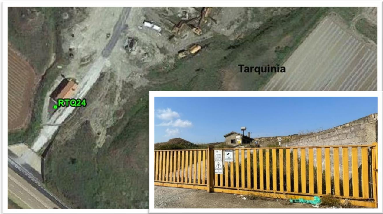
Figura 28 - Inquadramento su ortofoto e da sopralluogo RTQ24 (D10)