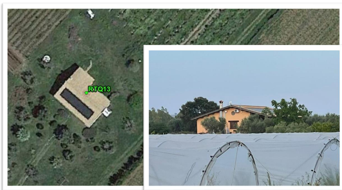
Figura 25 - Inquadramento su ortofoto e da sopralluogo RTQ13 (D10)