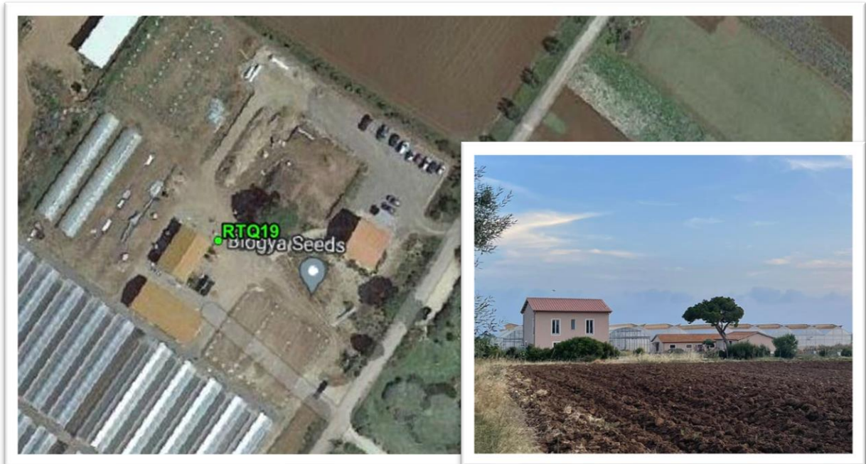
Figura 10 - Inquadramento su ortofoto e da sopralluogo RTQ19 (A2)