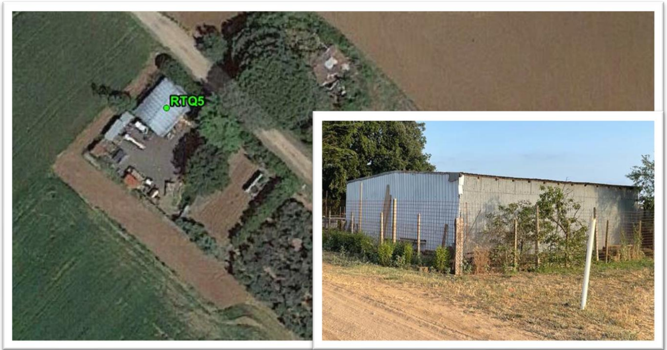
Figura 32 - Inquadramento su ortofoto e da sopralluogo RTQ5 (NC)

Il ricettore RTQ5 non risulta censito al catasto, e da sopralluogo visivo risulta essere un capanno per ricovero attrezzi. Pertanto sarà previsto il rispetto dei limiti assoluti durante il periodo diurno e notturno e il rispetto del limite differenziale per il solo periodo Diurno.