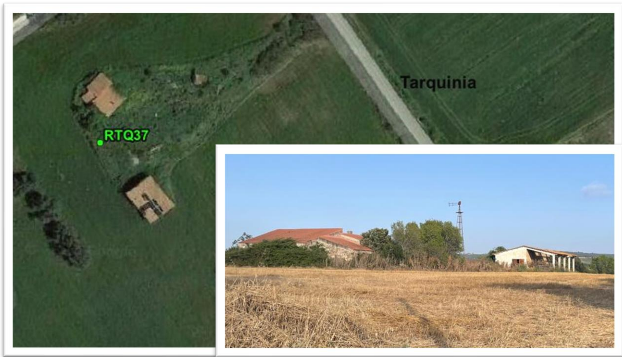
Figura 37 - Inquadramento su ortofoto e da sopralluogo RTQ37