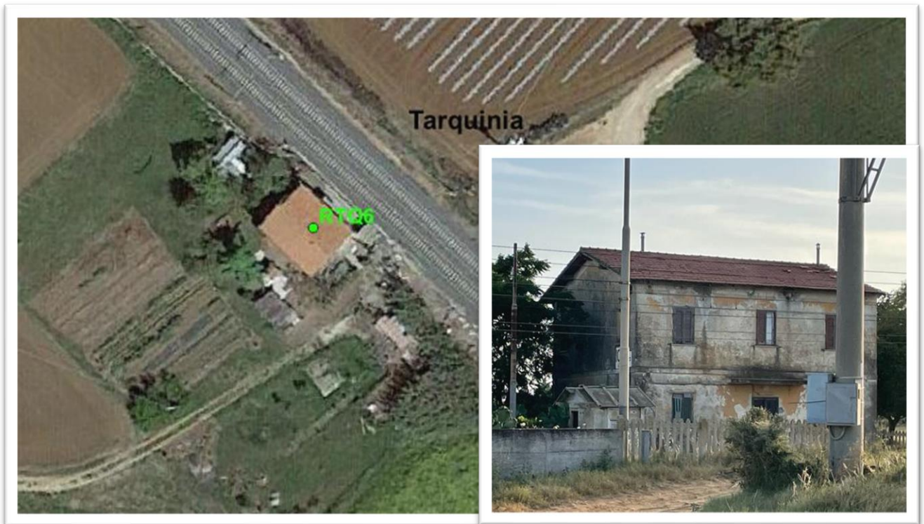
Figura 33 - Inquadramento su ortofoto e da sopralluogo RTQ6 (NC)

Il fabbricato RTQ6 non risulta censito al catasto, mentre da sopralluogo visivo risulta essere una vecchia casa cantonera in stato di fatiscenza. Pertanto viste le condizioni in cui verte ed escludendo a priori, vista la sua collocazione, interventi di recupero, non si ritiene opportuno effettuare alcuna verifica dei limiti di legge.