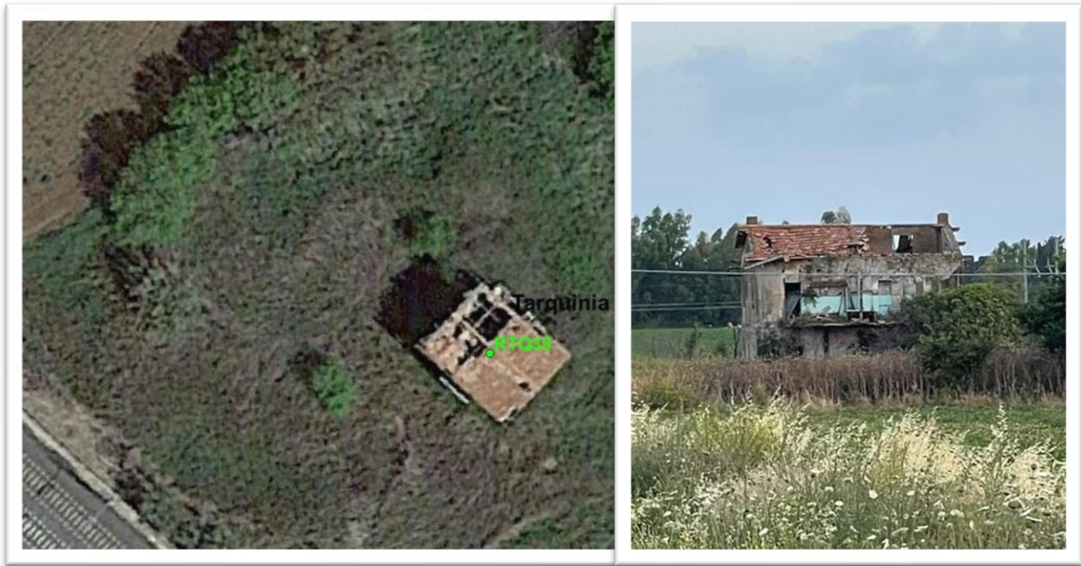
Figura 36 - Inquadramento su ortofoto e da sopralluogo RTQ35