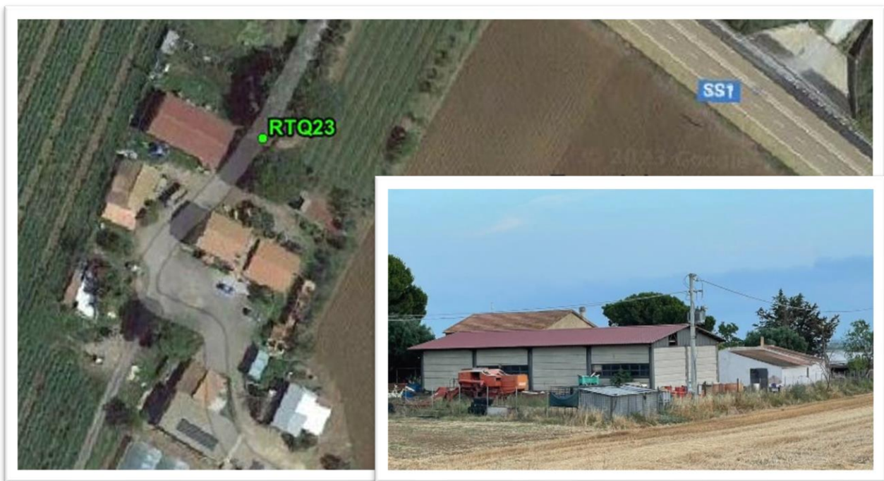
Figura 12 - Inquadramento su ortofoto e da sopralluogo RTQ23 (A3)