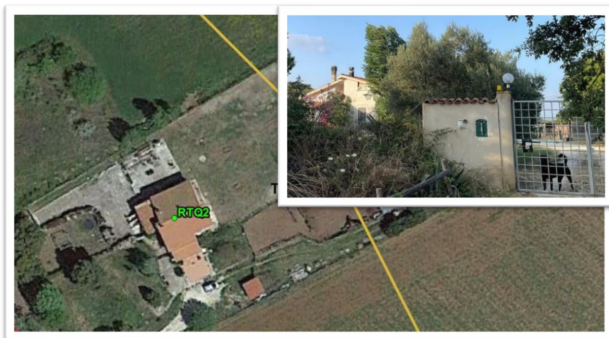
Figura 2 – Inquadramento su Ortofoto e da sopralluogo RTQ2 (A3)