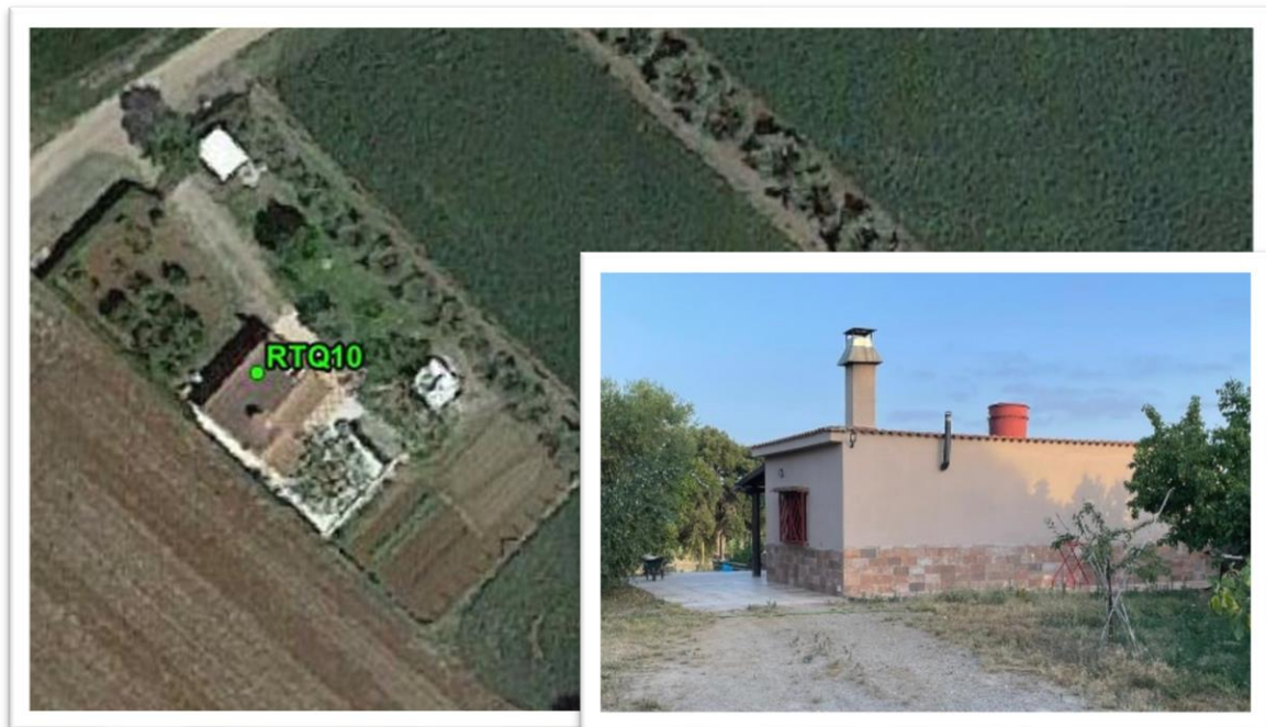
Figura 22 - Inquadramento su ortofoto e da sopralluogo RTQ10 (C2)