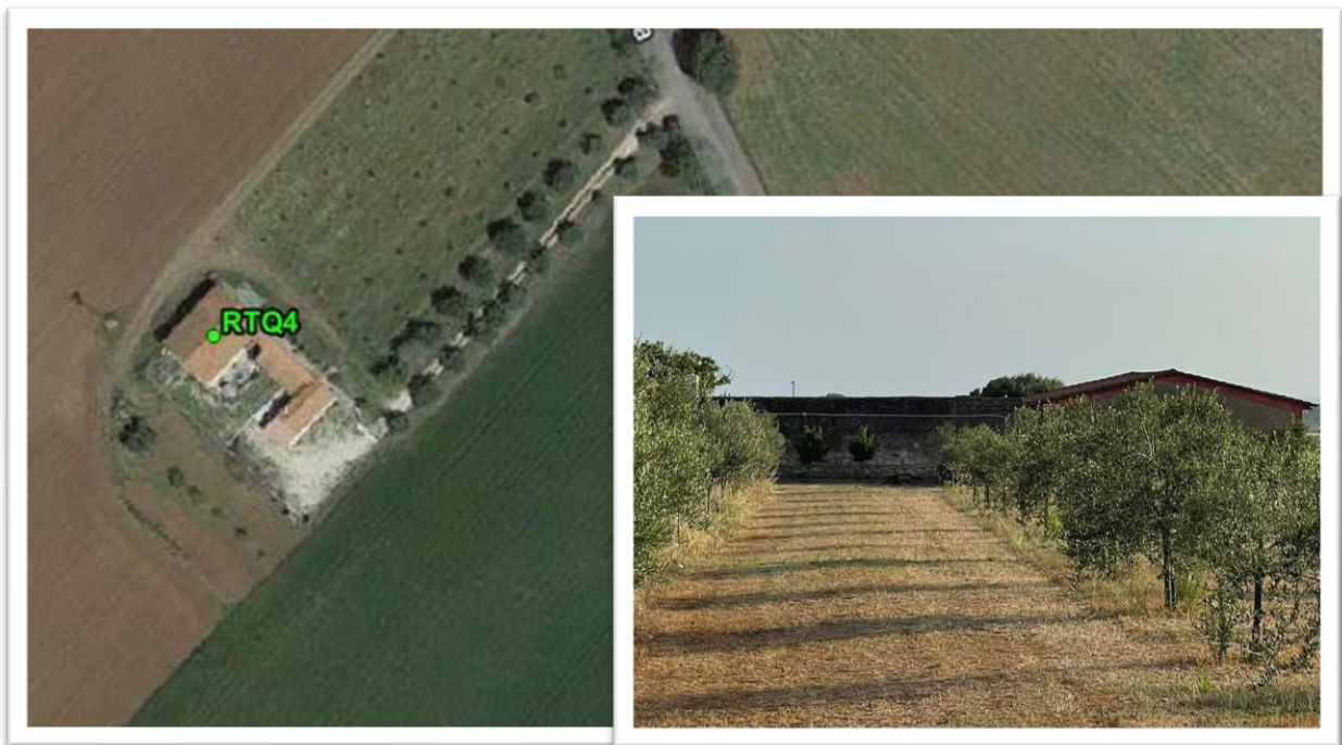
Figura 4 - Inquadramento su Ortofoto e da sopralluogo RTQ4 (A4)