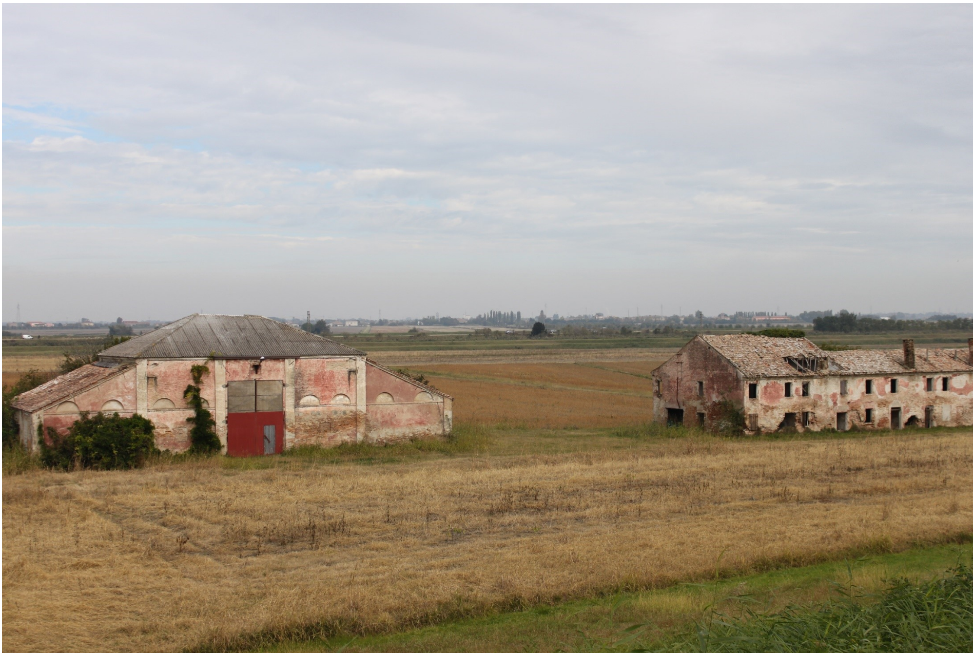
FOTO 6A – VEDUTA DELLO STATO ATTUALE DA ARGINE PO SINISTRO SENZA IMPIANTI