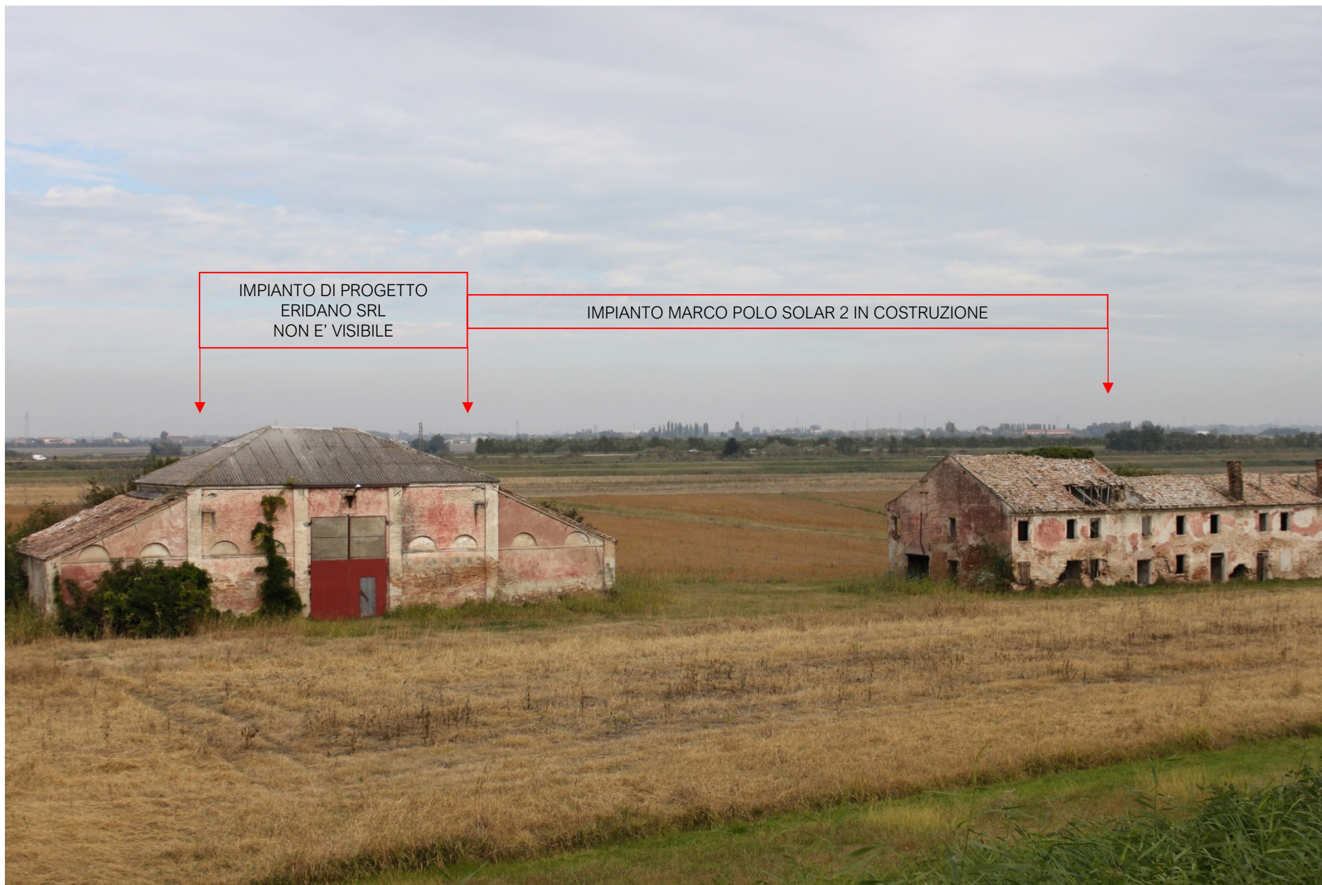
FOTO 6B – VEDUTA DELLO STATO MODIFICATO DA ARGINE PO SINISTRO CON FOTOINSERIMENTO DELGLI IMPIANTI FV MPS2 ED ERIDANO (L'IMPIANTO DI PROGETTO NON E' VISIBILE)