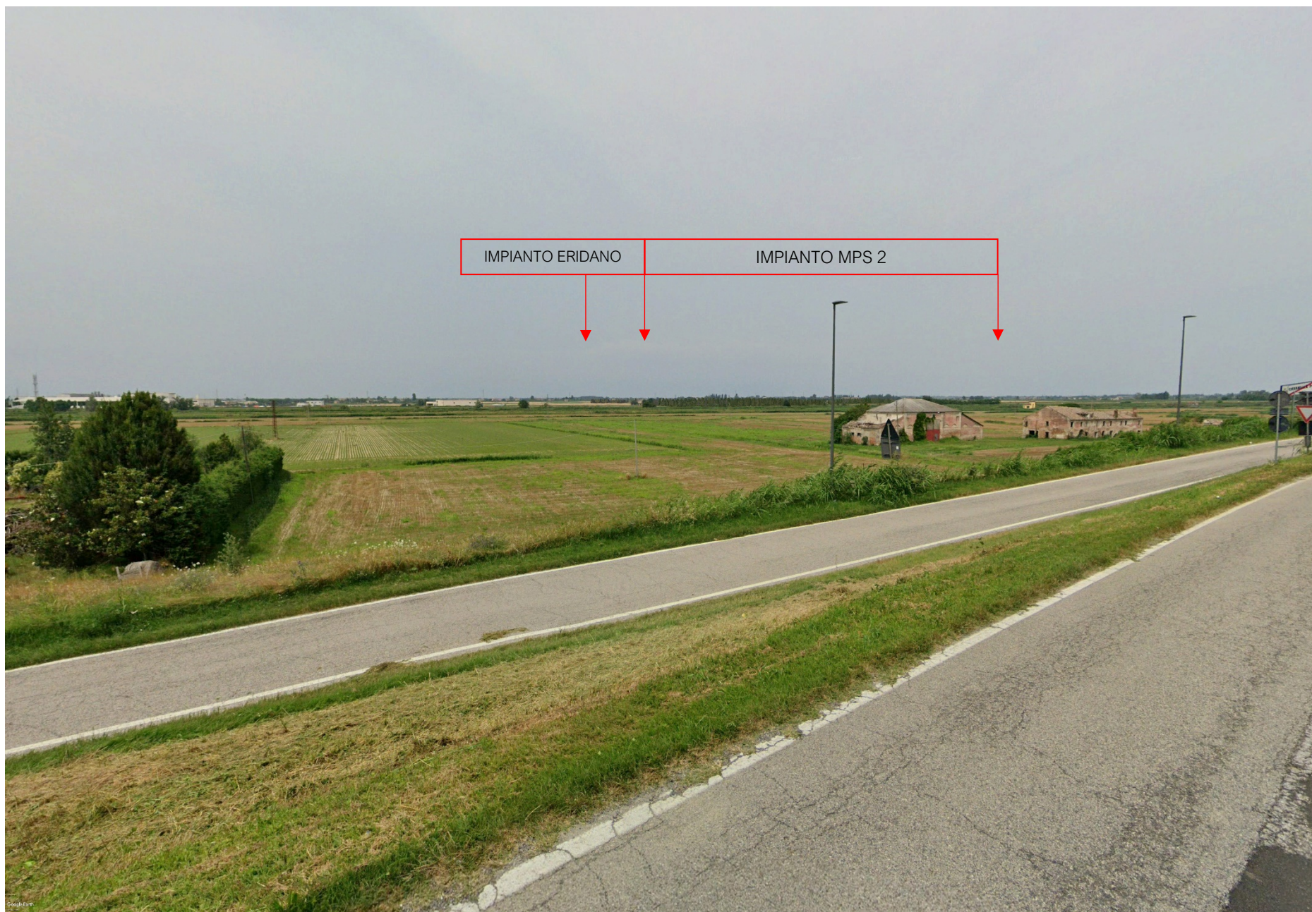
FOTO 7B – VEDUTA DELLO STATO MODIFICATO DA ARGINE PO SINISTRO CON FOTOINSERIMENTO DELGLI IMPIANTI FV MPS2 IN COSTRUZIONE E DI PROGETTO ERIDANO CON LE OPERE DI MITIGAZIONE