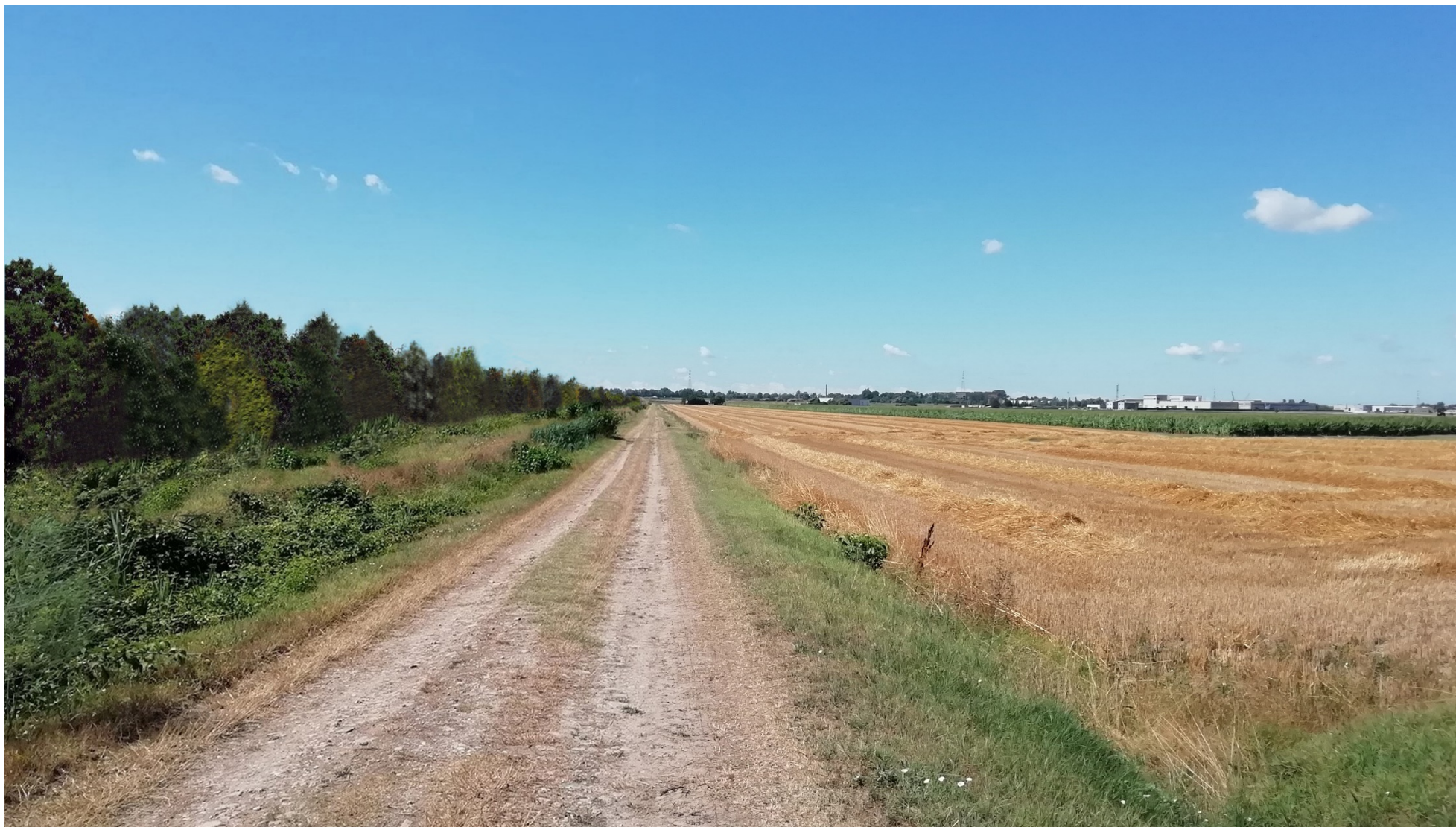
FOTO 3A - VEDUTA DELLO STATO ATTUALE LUNGO LA CAPEZZAGNA SUL CONFINE EST