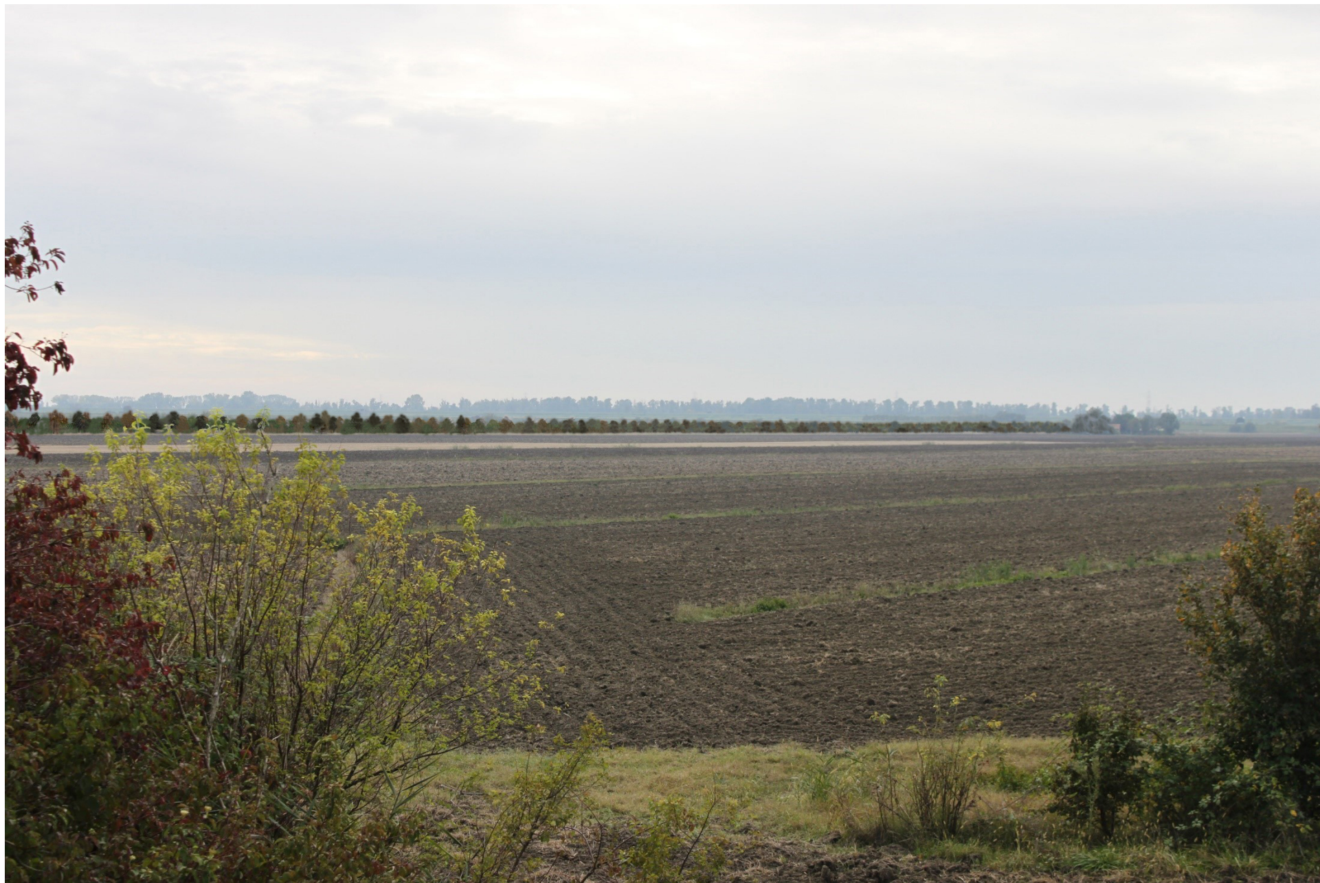
FOTO 1A - VEDUTA DELLO STATO ATTUALE DALLA STRADA ARGINALE DEL NAVIGLIO-ADIGETTO CON L'IMPIANTO DI MARCO POLO SOLAR 2 IN COSTRUZIONE