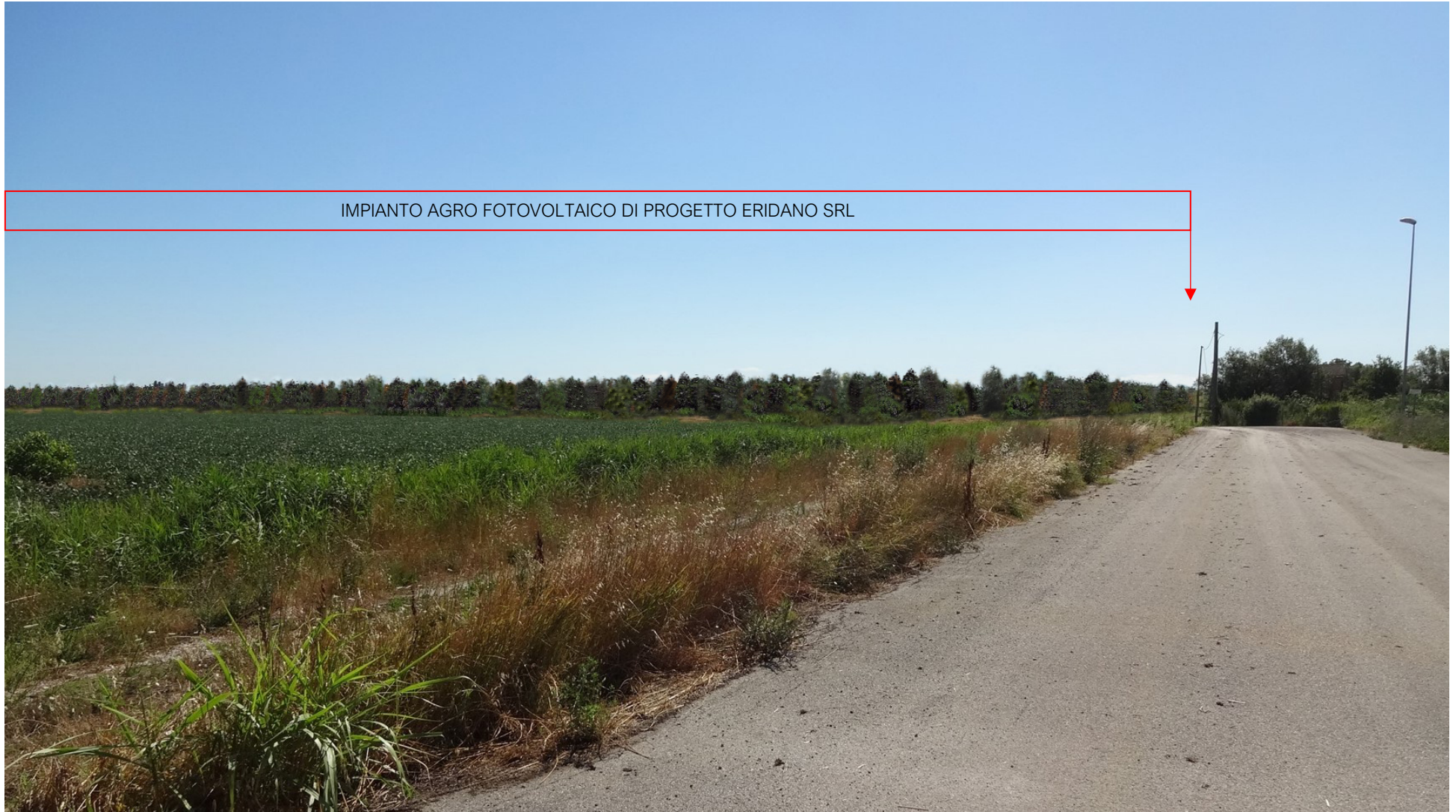
FOTO 9A – VEDUTA DELLO STATO ATTUALE LUNGO LA VIABILITA' INTERNA DELL'AREA PRODUTTIVA A.I.A. CON FOTOINSERIMENTO DELGLI IMPIANTO AGRO FOTOVOLTAICO DI PROGETTO ERIDANO CON LE OPERE DI MITIGAZIONE