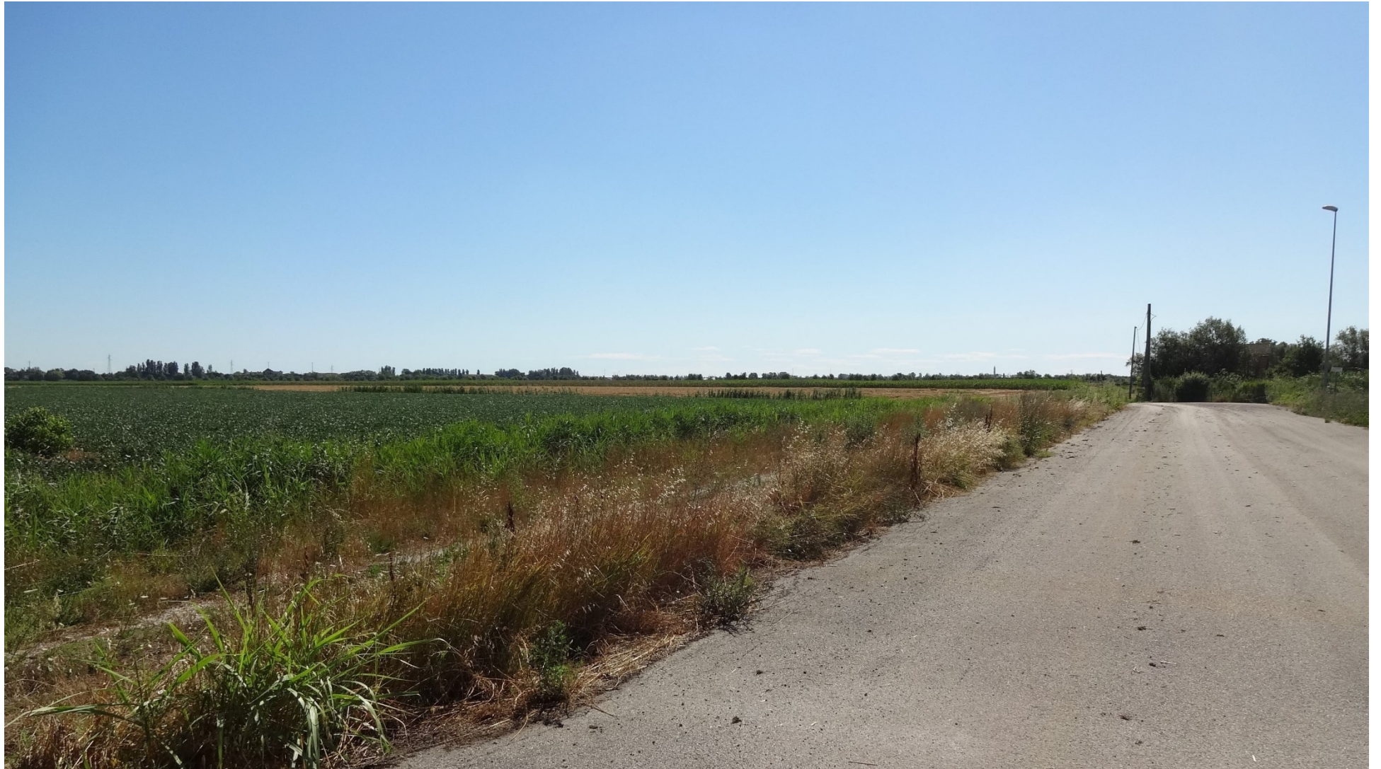
FOTO 9A – VEDUTA DELLO STATO ATTUALE LUNGO LA VIABILITA' INTERNA DELL'AREA PRODUTTIVA A.I.A. PRIMA DELL'INTERVENTO