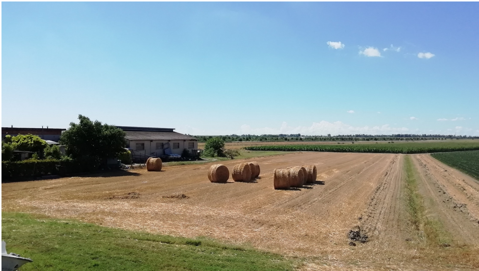
FOTO 2A - VEDUTA DELLO STATO ATTUALE DALLA STRADA ARGINALE DEL NAVIGLIO-ADIGETTO