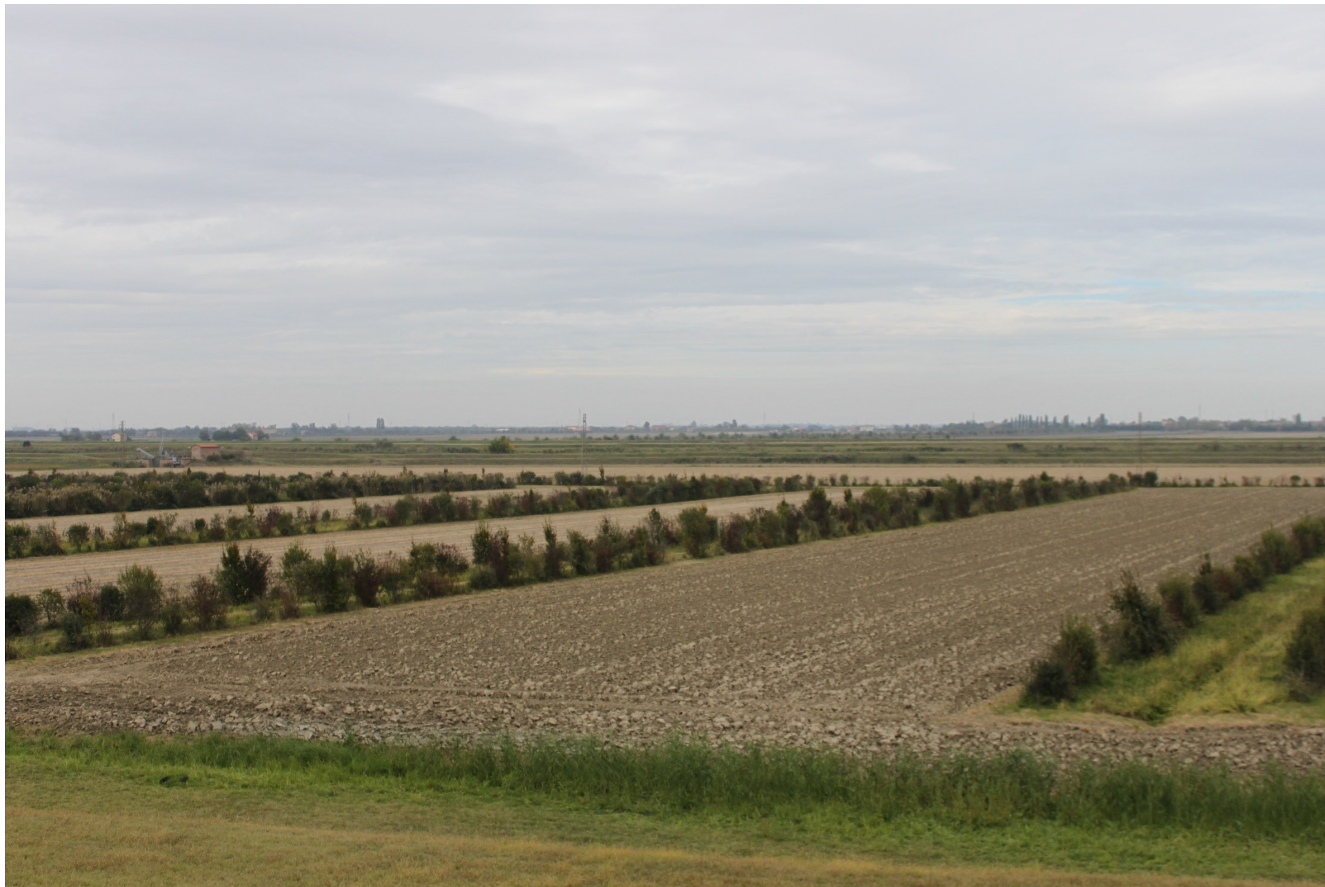
FOTO 5A – VEDUTA DELLO STATO ATTUALE DA ARGINE PO DESTRO SENZA IMPIANTI