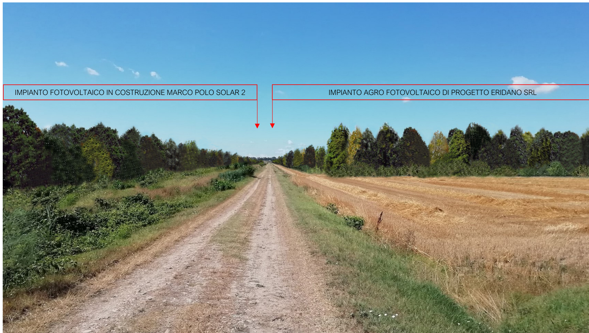
FOTO 3B - VEDUTA DELLO STATO MODIFICATO LUNGO LA CAPEZZAGNA SUL CONFINE EST CON FOTOINSERIMENTO DELL'IMPIANTO AGRO FOTOVOLTAICO DI PROGETTO ERIDANO CON LE OPERE DI MITIGAZIONE