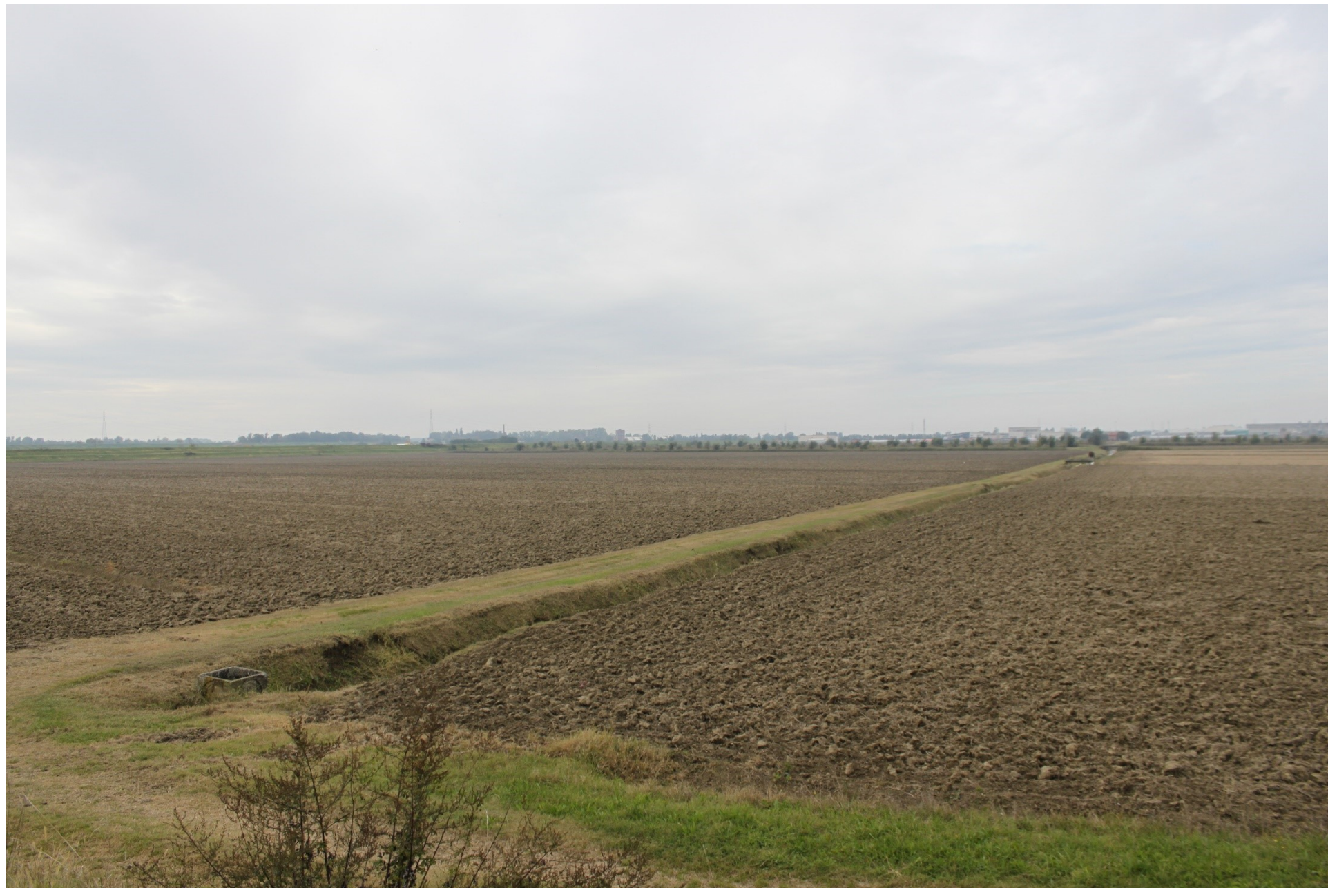
FOTO 4A – VEDUTA DELLO STATO ATTUALE DALLA STRADA ARGINALE DEL NAVIGLIO-ADIGETTO SENZA IMPIANTI