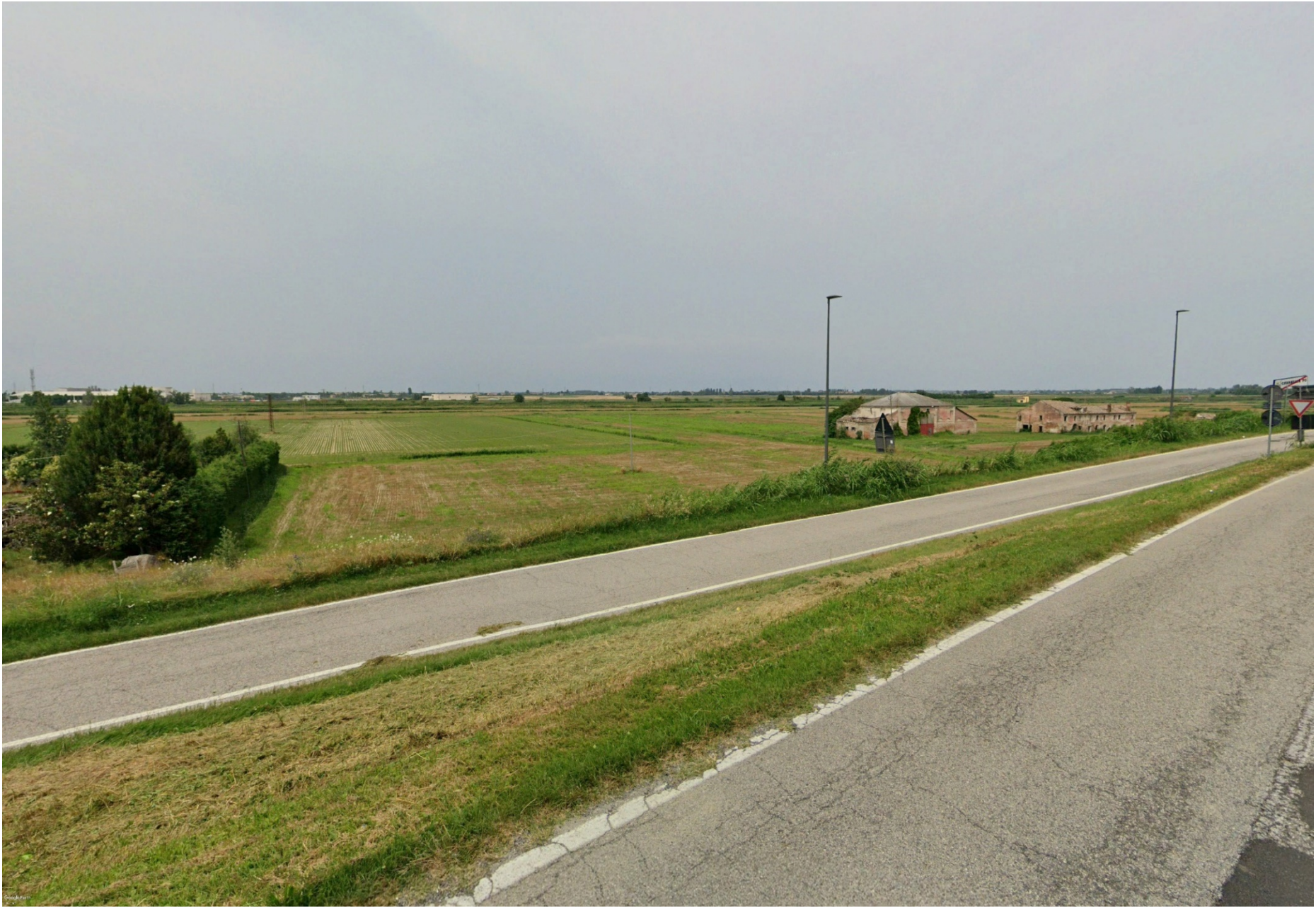
FOTO 7A – VEDUTA DELLO STATO ATTUALE DA ARGINE PO SINISTRO SENZA IMPIANTI