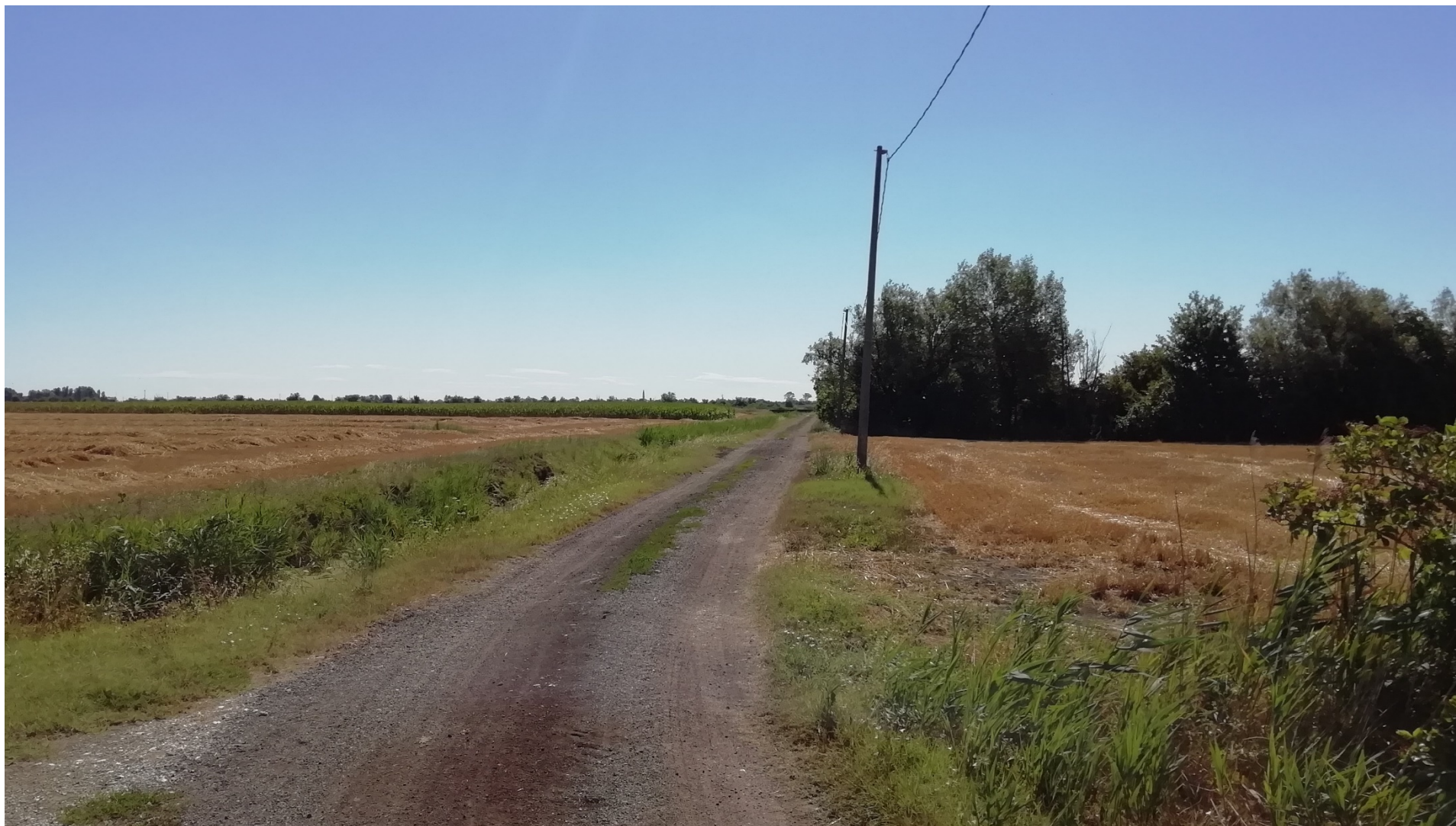
FOTO 8A – VEDUTA DELLO STATO ATTUALE LUNGO IL CANALE RETINELLA PRIMA DELL'INTERVENTO