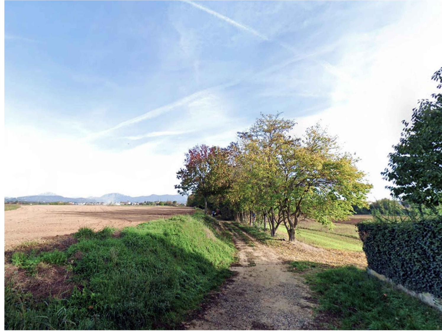
3. Vista da centro urbano Ruginello