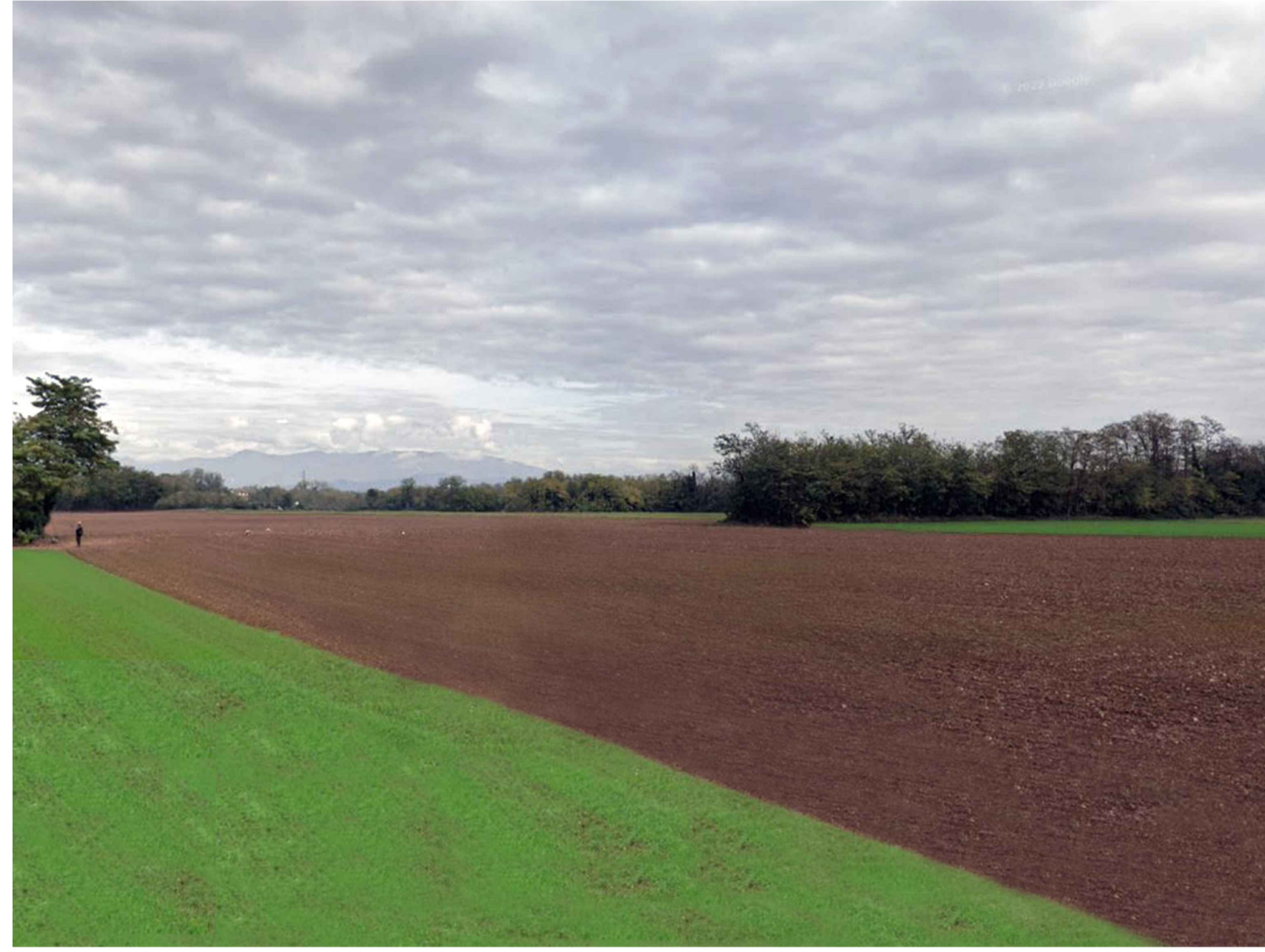
5. Svincolo di Vimercate