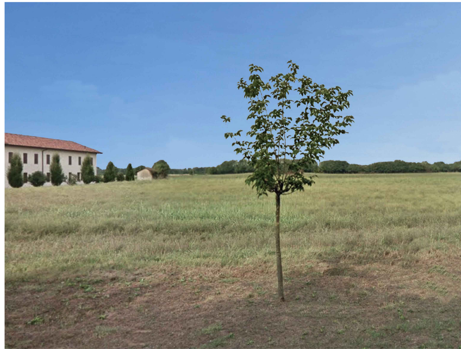
7. Cascina Baraggia