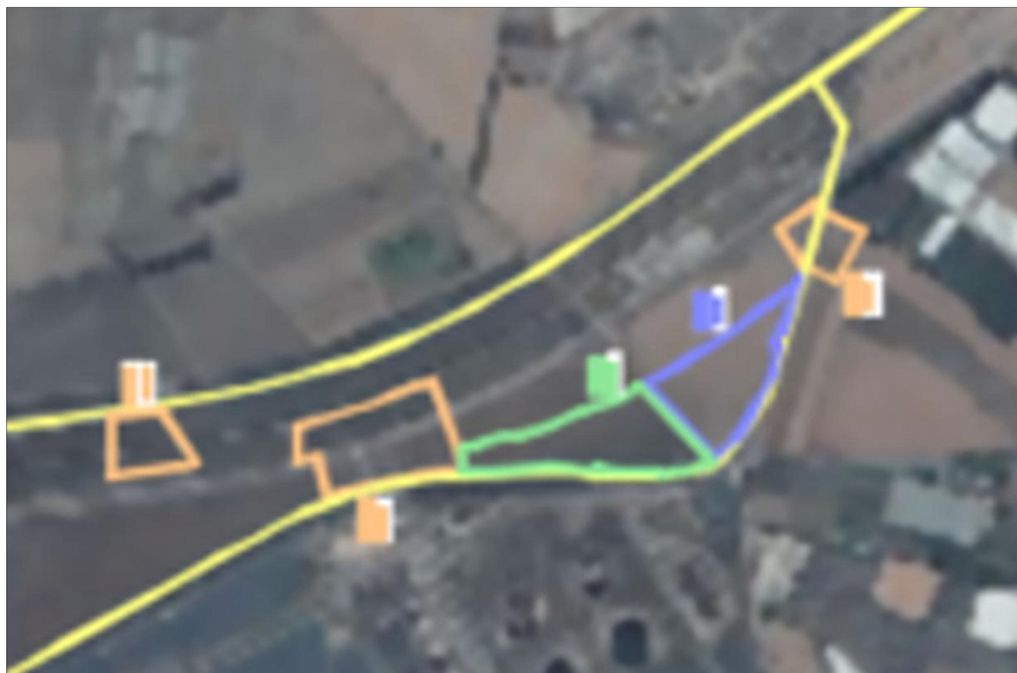
Aree Di cantiere sovrapposte a ortofoto dell'area

Nota: FASE 2 area cantiere operativo successivamente alla costruzione del nuovo progetto