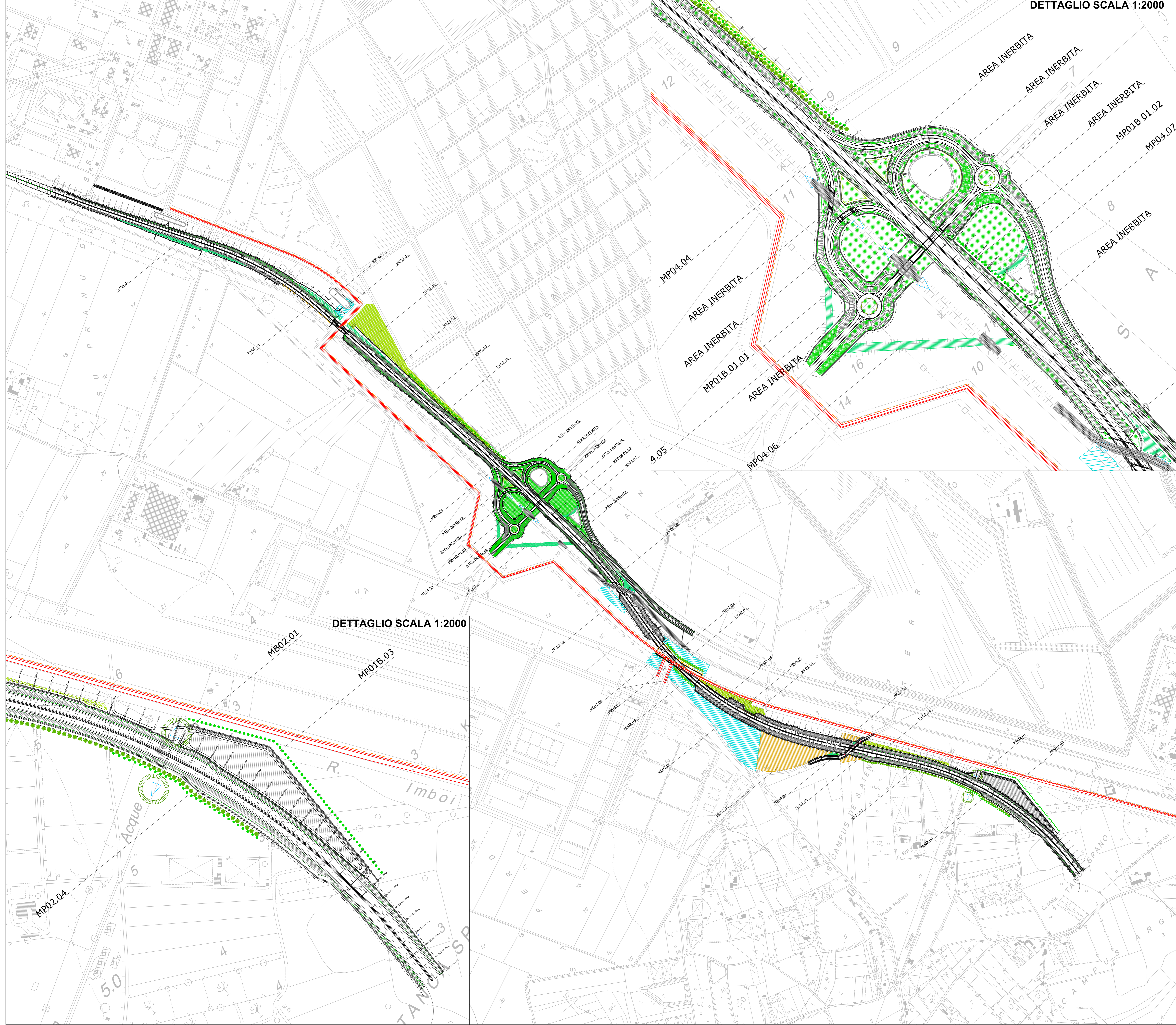
DETTAGLIO SCALA 1:2000