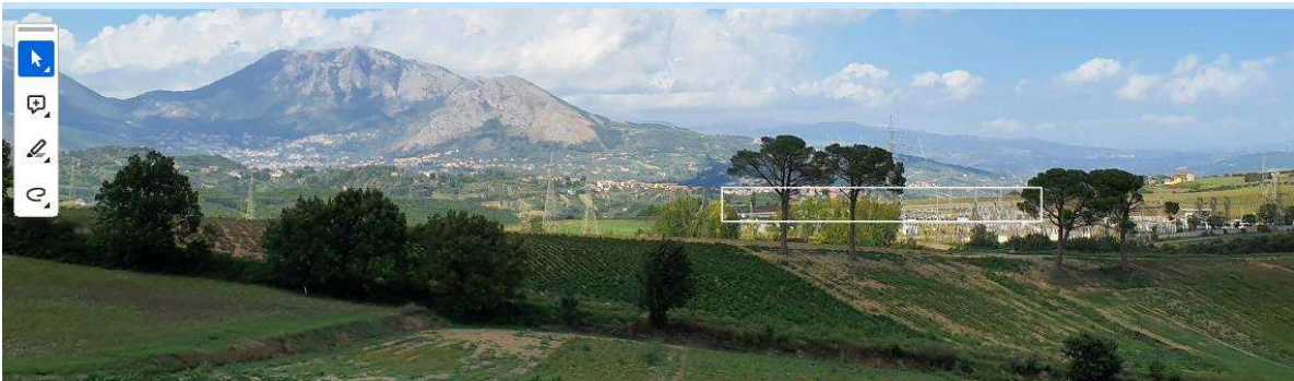
V19- VISTA RAVVICINATA