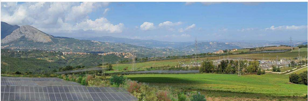
V17- VERIFICA CON FOTOINSERIMENTO