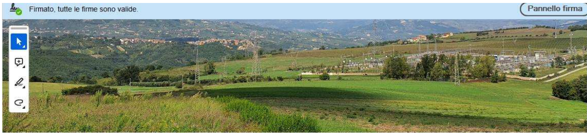
V17- VISTA RAVVICINATA