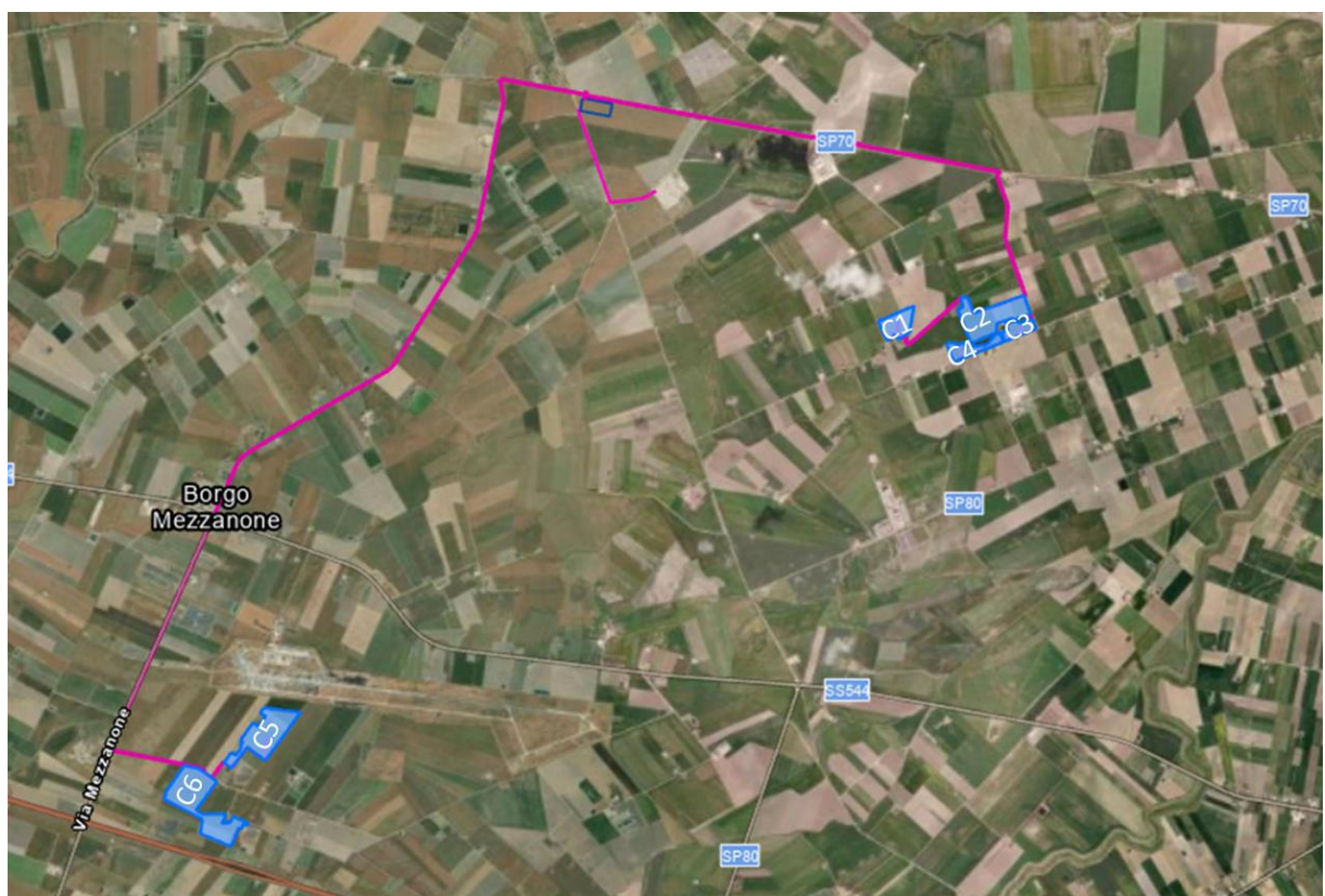
Figura 2.1: Localizzazione dell'area di intervento Blu: area impianto; Magenta: percorso di connessione)

L'area di intervento risulta essere pari a circa 72 ettari complessivi di cui 56,06 ha recintati. Le sottoaree C1+C2+C3+C4 sono rispettivamente di 31 ha catastali (24,87 ha cintati) mentre le sottozone C5+C6 misurano 41 ha (31,2 ha cintati).