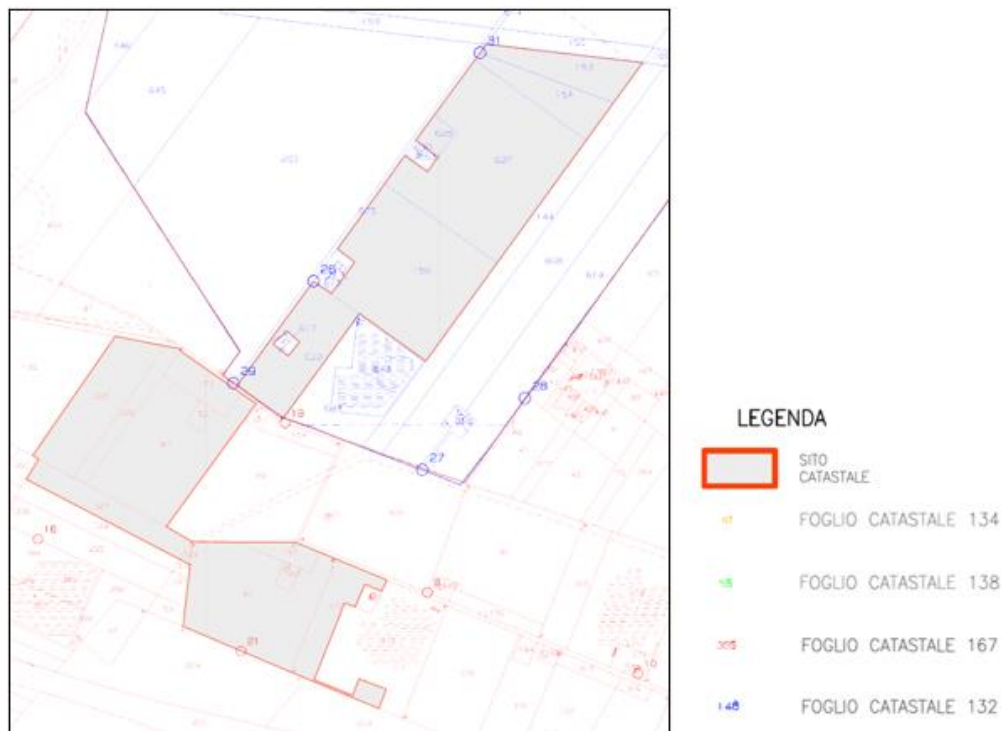
Figura 2.2: Inquadramento catastale.