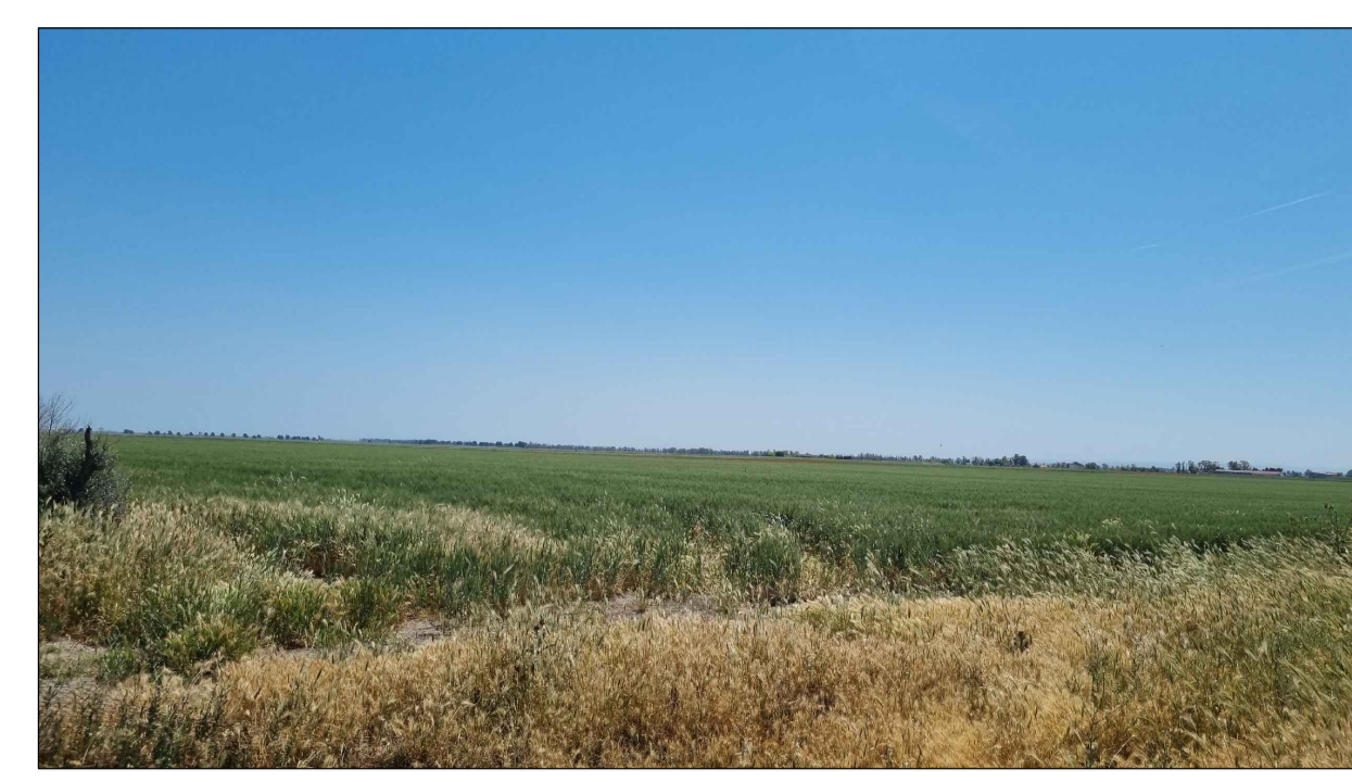
PUNTO DI PRESA FOTOGRAFICA 16