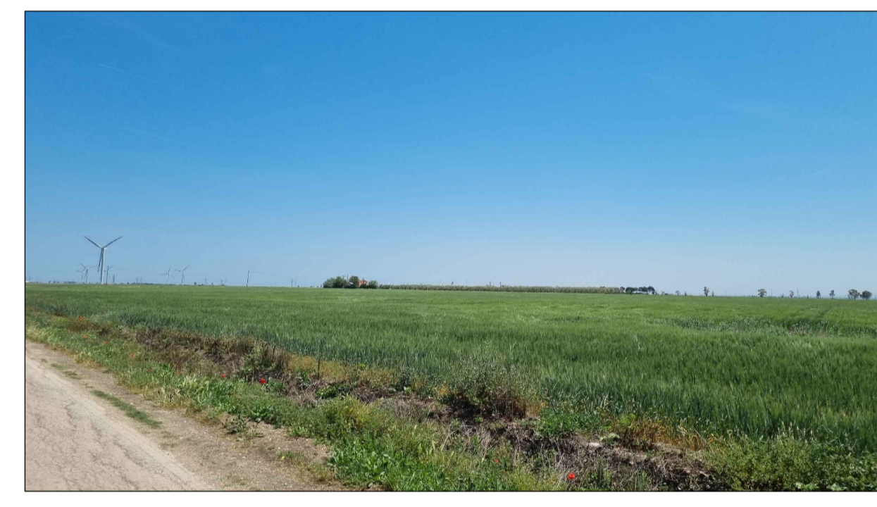
PUNTO DI PRESA FOTOGRAFICA 7