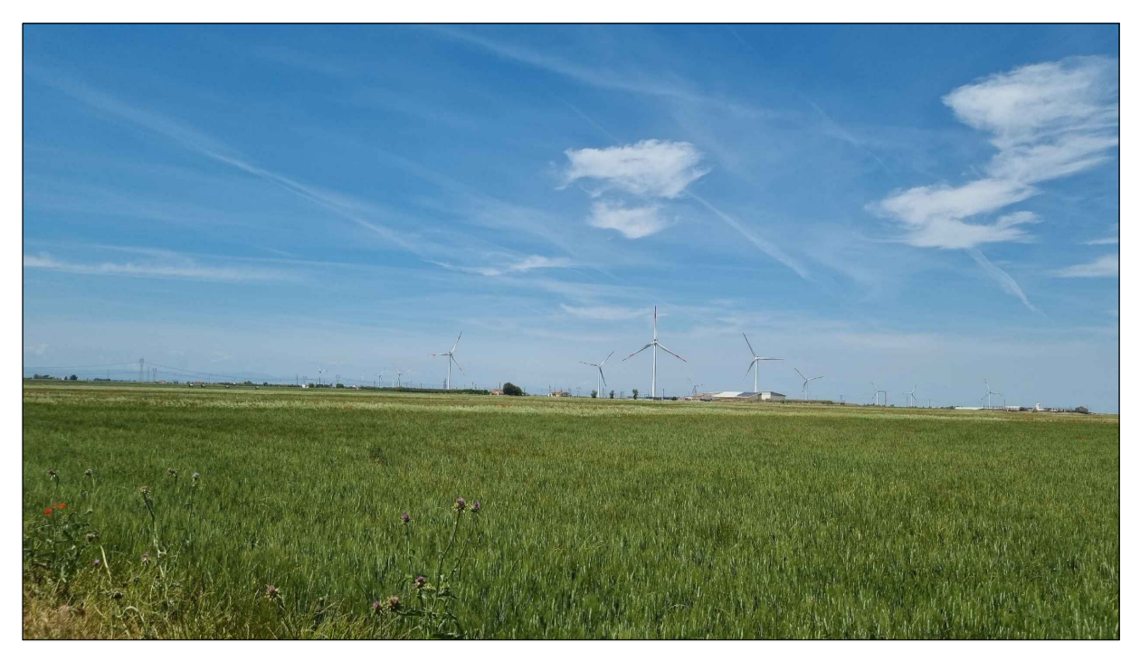
FOTOINSENERIMENTO 15 - STATO DI FATTO