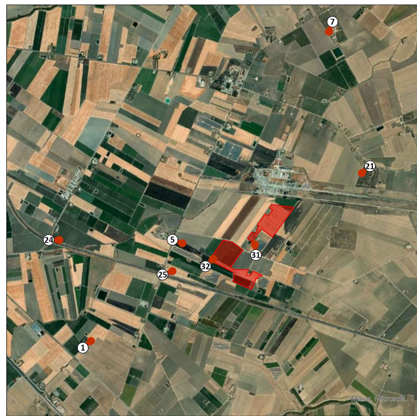
PRUE FOTOGRAFICHE - AREA NORD