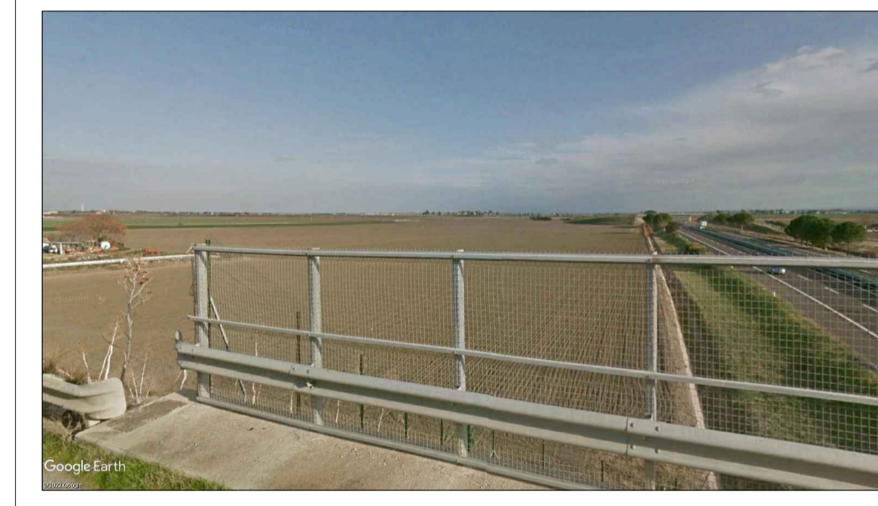
PUNTO DI PRESA FOTOGRAFICA 24