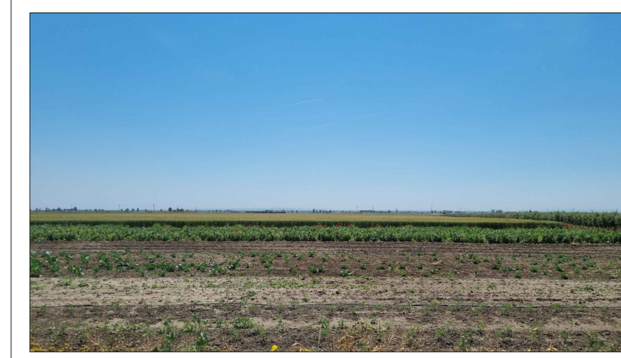
FOTOINSENERIMENTO 18 - STATO DI FATTO