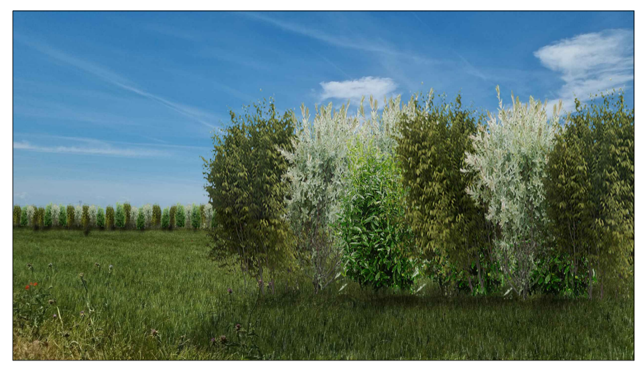
FOTOINSENERIMENTO 15 - STATO DI PROGETTO