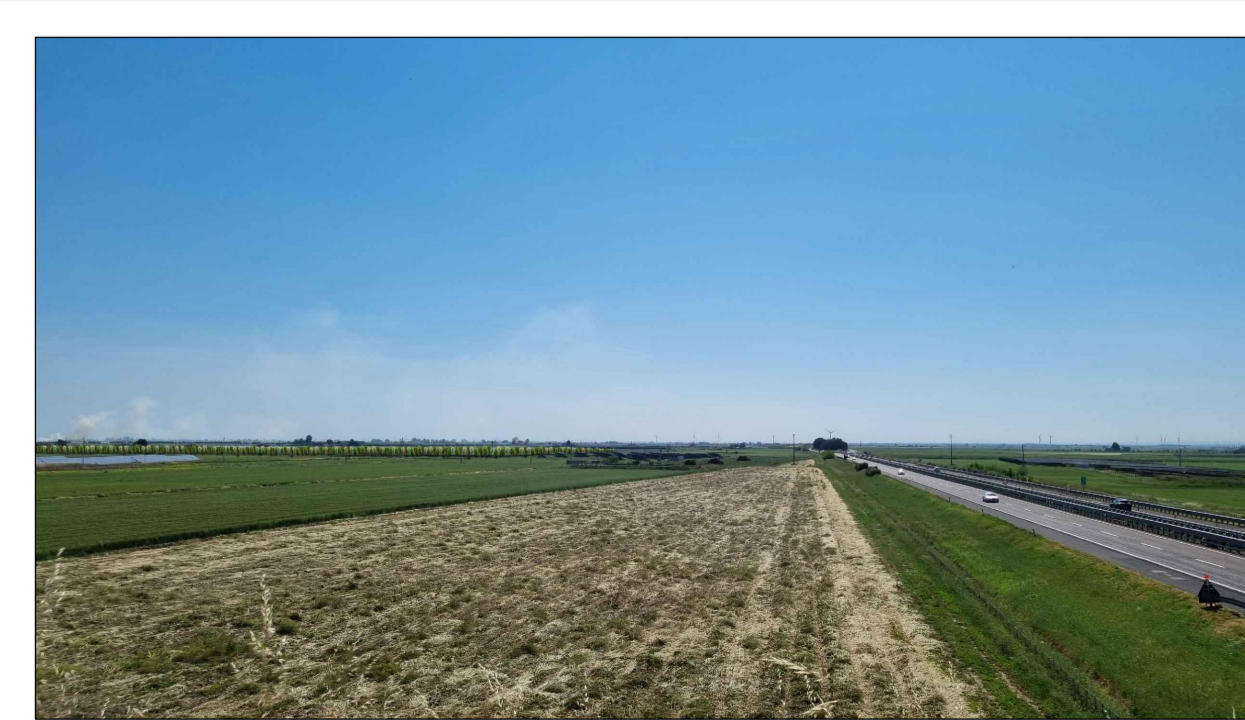
FOTOINSENERIMENTO 25 - STATO DI PROGETTO