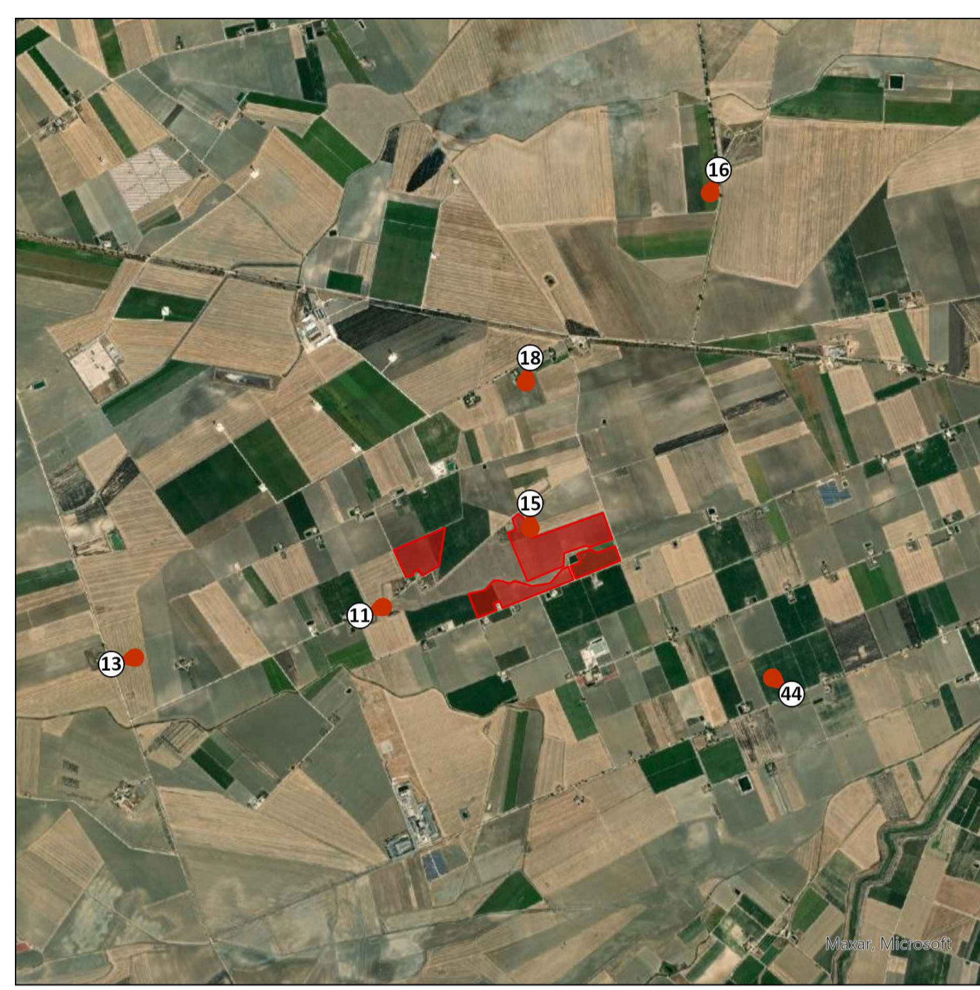
PRUE FOTOGRAFICHE - AREA NORD