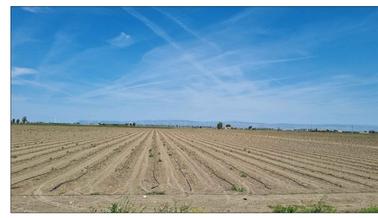
PUNTO DI PRESA FOTOGRAFICA 44