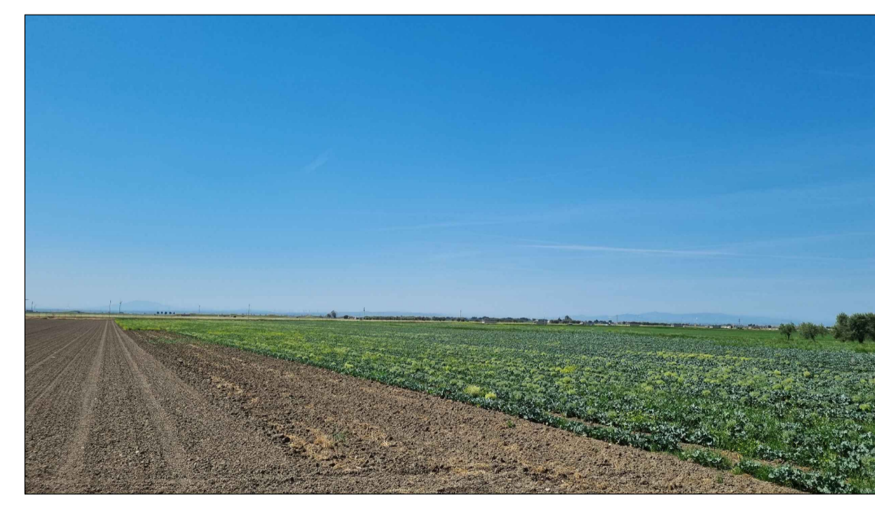
PUNTO DI PRESA FOTOGRAFICA 21