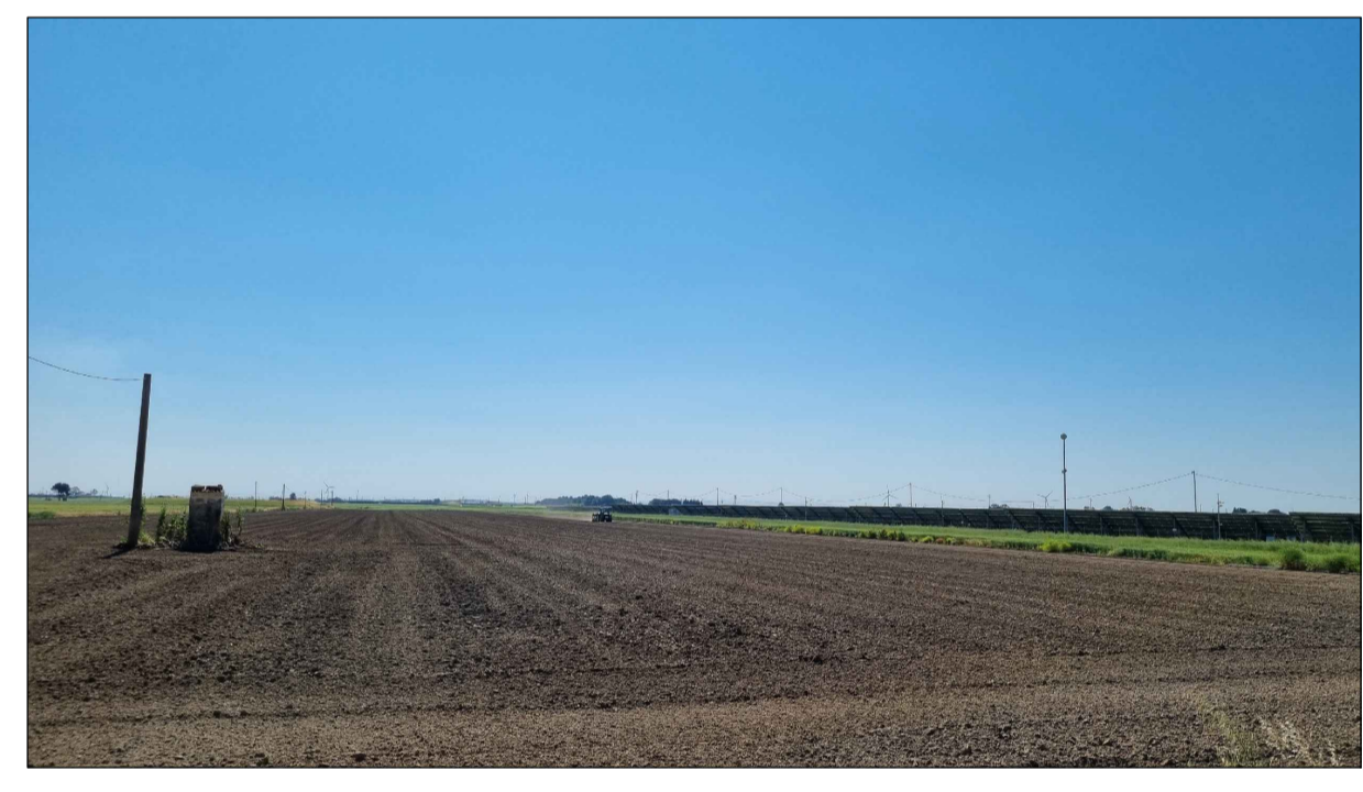
FOTOINSENERIMENTO 5 - STATO DI FATTO