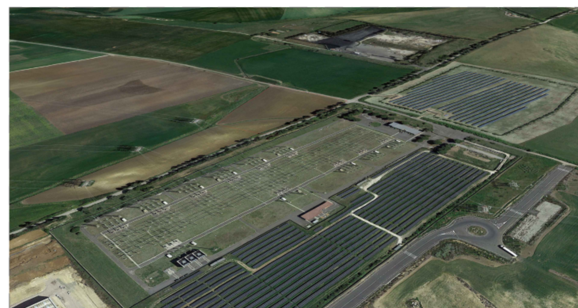
PUNTO DI VISTA "F04" - STATO DI FATTO