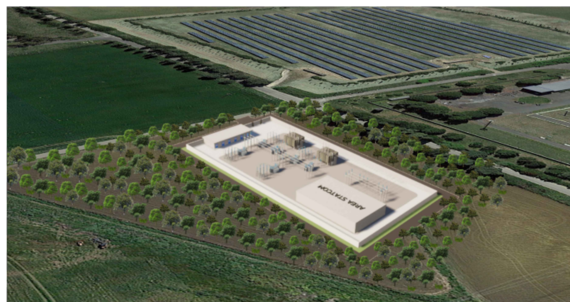
PUNTO DI VISTA "F03" - SITUAZIONE DI PROGETTO