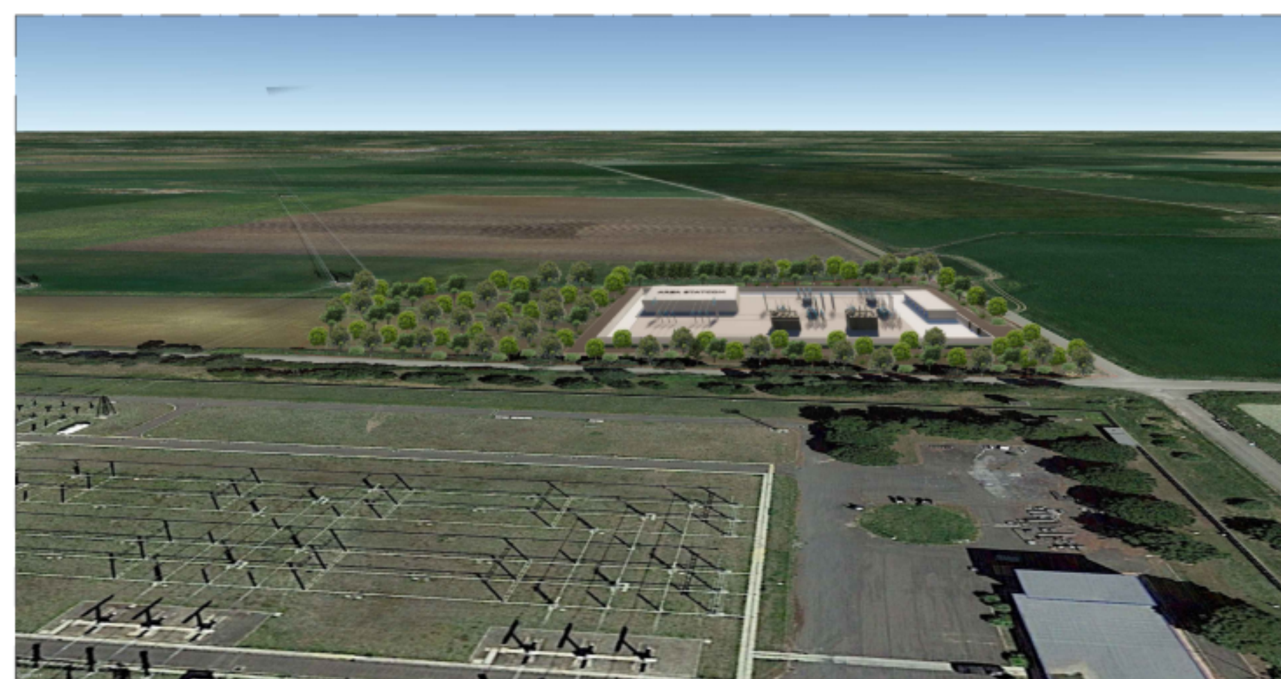
PUNTO DI VISTA "F01" - SITUAZIONE DI PROGETTO