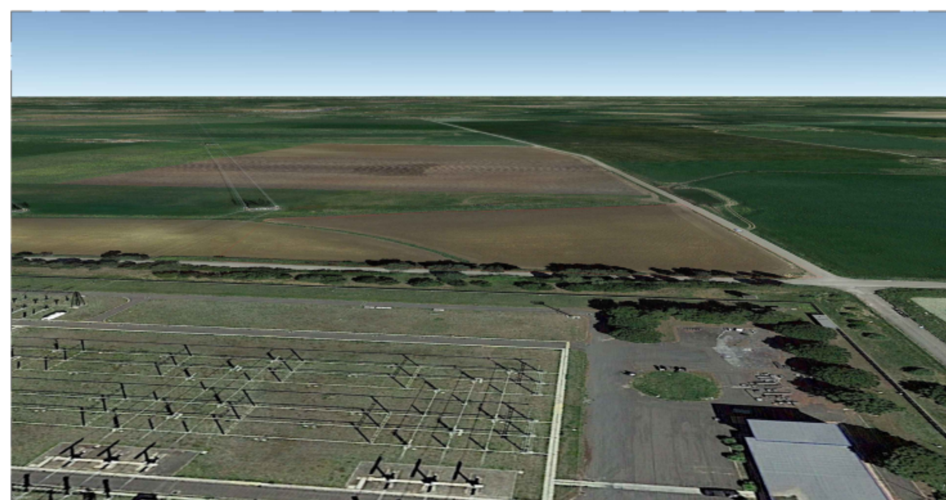
PUNTO DI VISTA "F01" - STATO DI FATTO