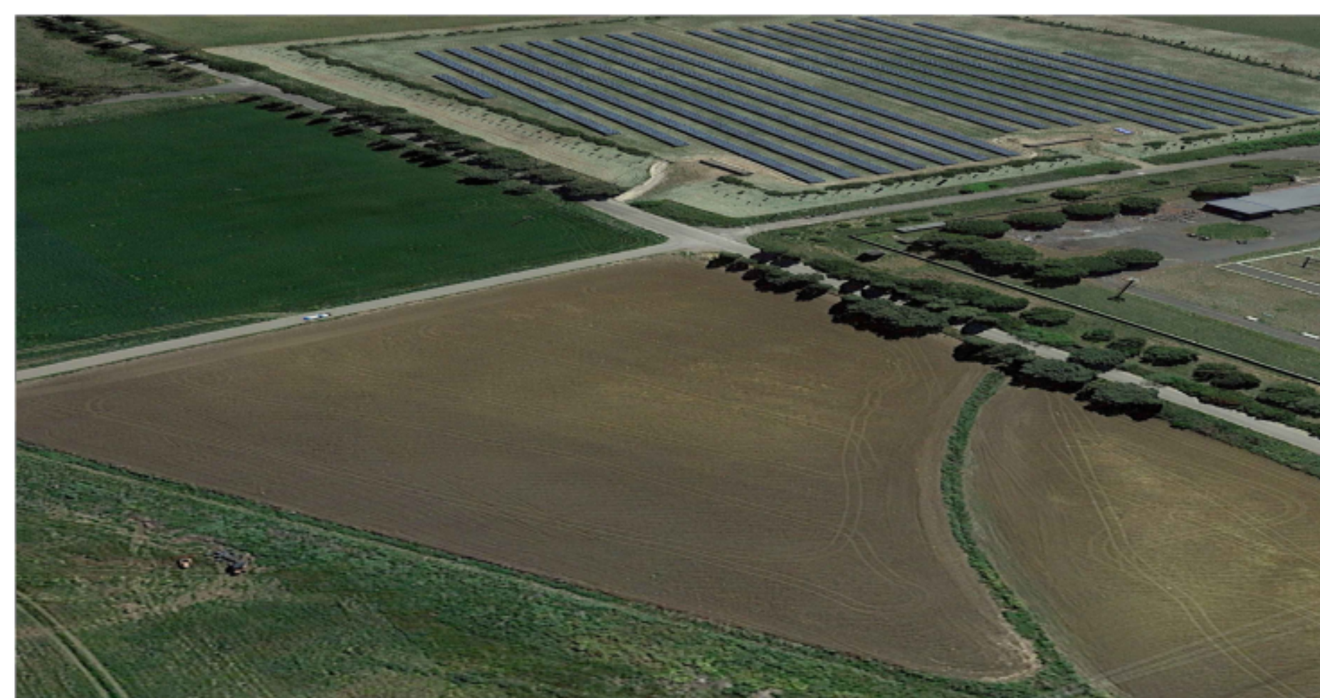
PUNTO DI VISTA "F03" - STATO DI FATTO