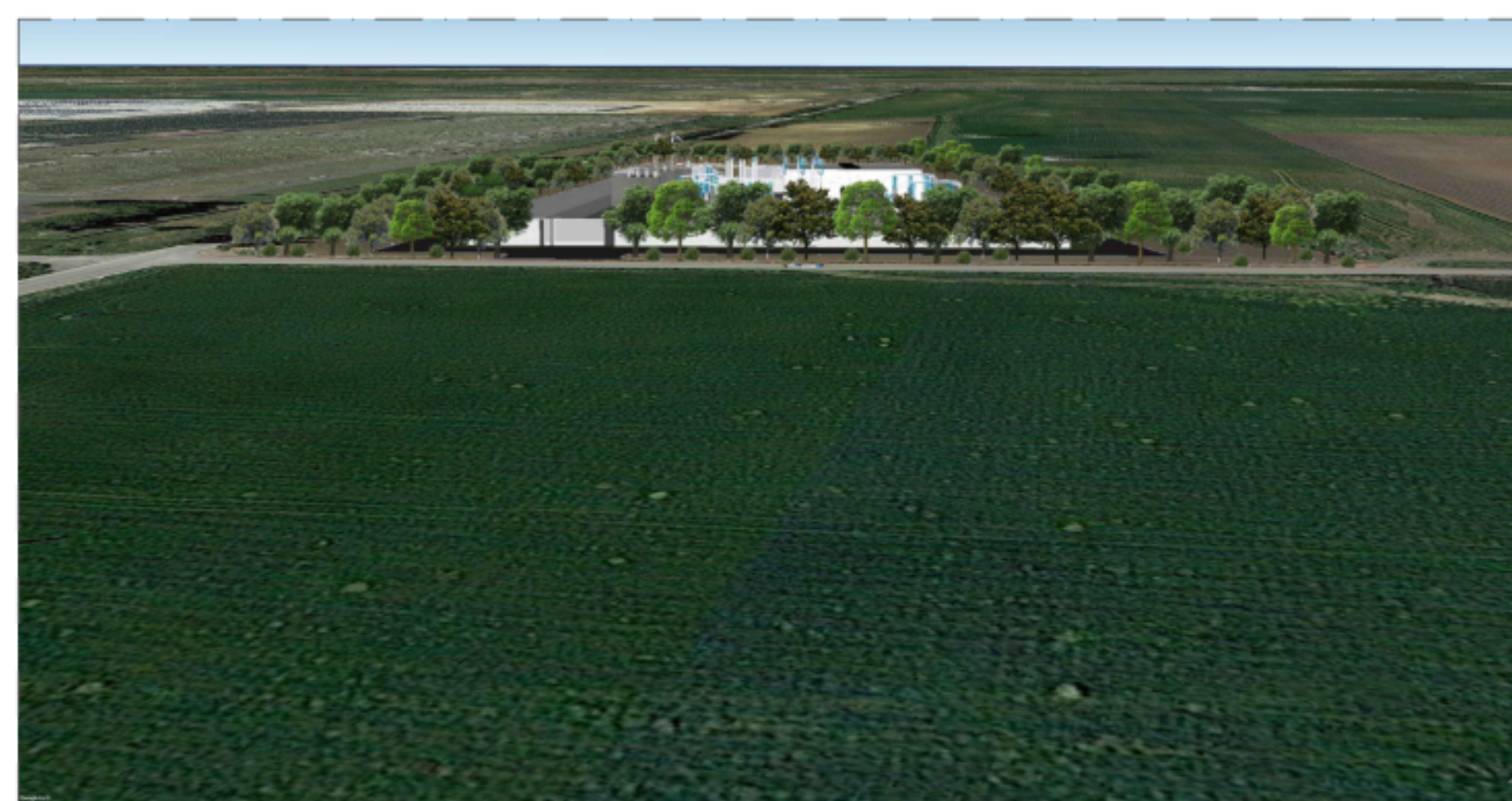
PUNTO DI VISTA "F02" - SITUAZIONE DI PROGETTO