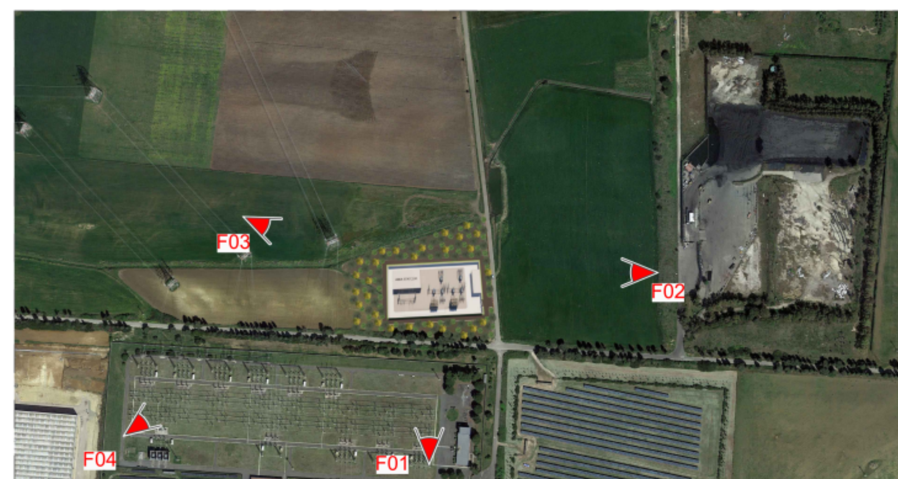
VISTA DALL'ALTO - SITUAZIONE DI PROGETTO