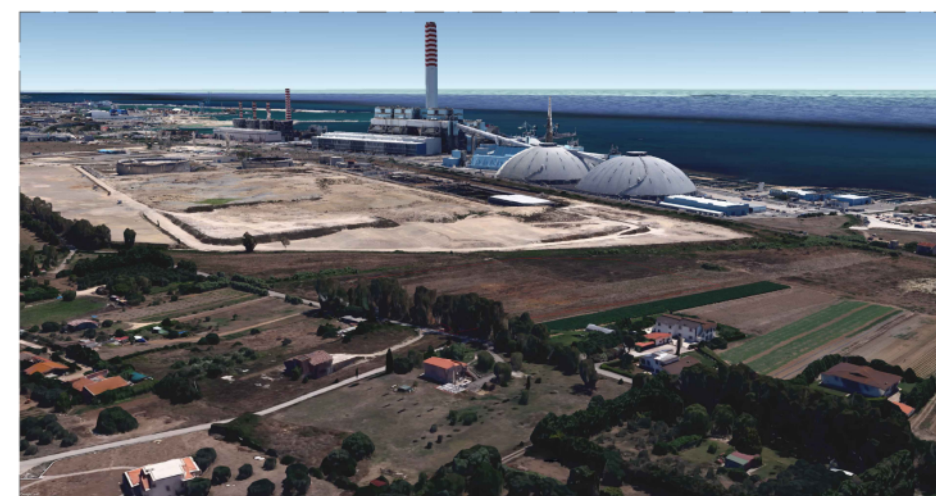
PUNTO DI VISTA "F04" - STATO DI FATTO