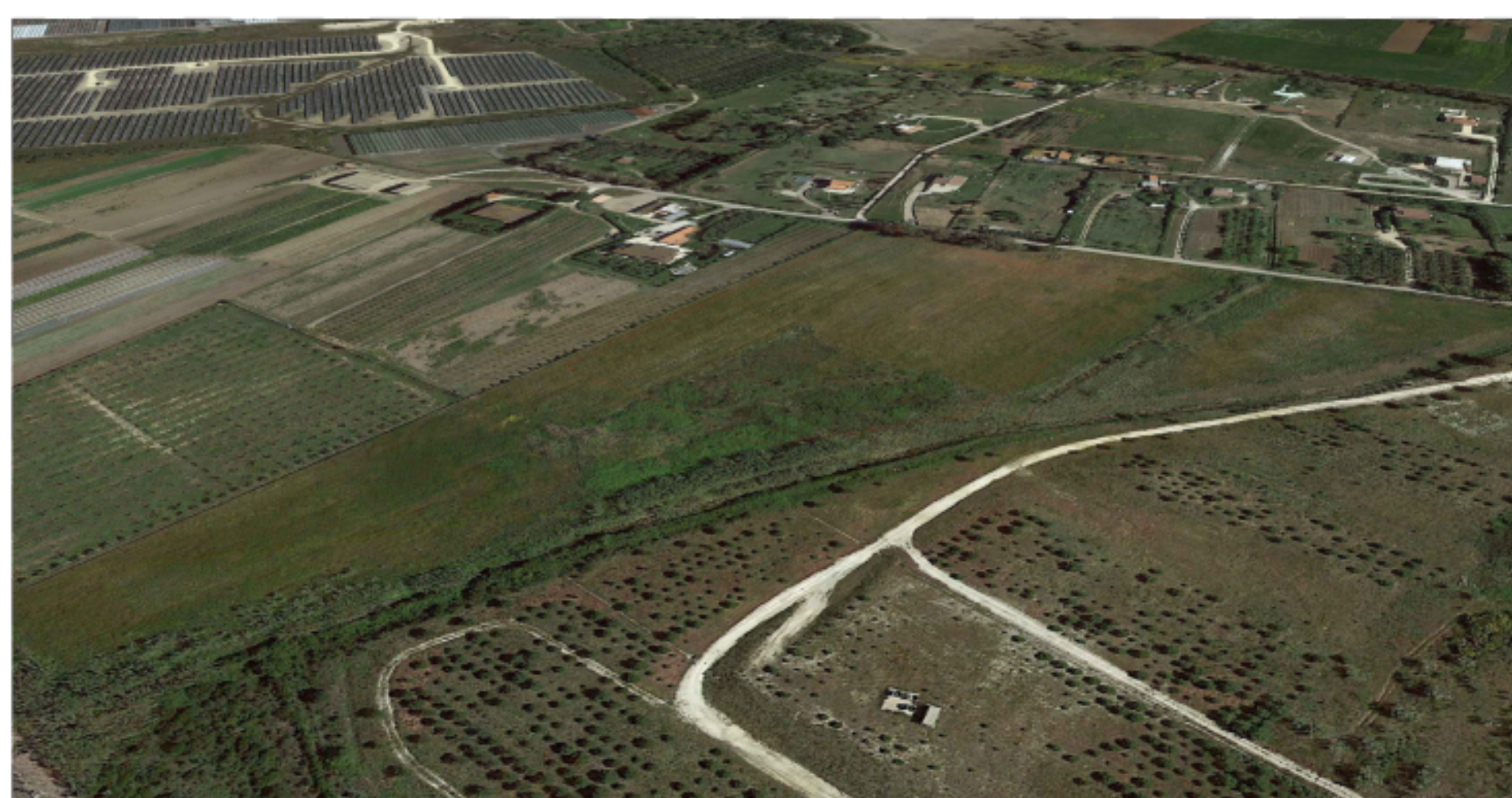
PUNTO DI VISTA "F02" - STATO DI FATTO