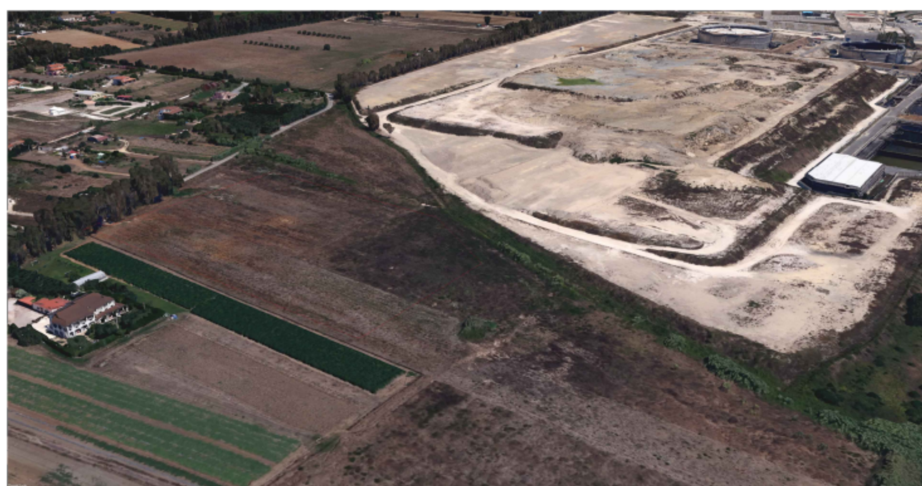
PUNTO DI VISTA "F03" - STATO DI FATTO