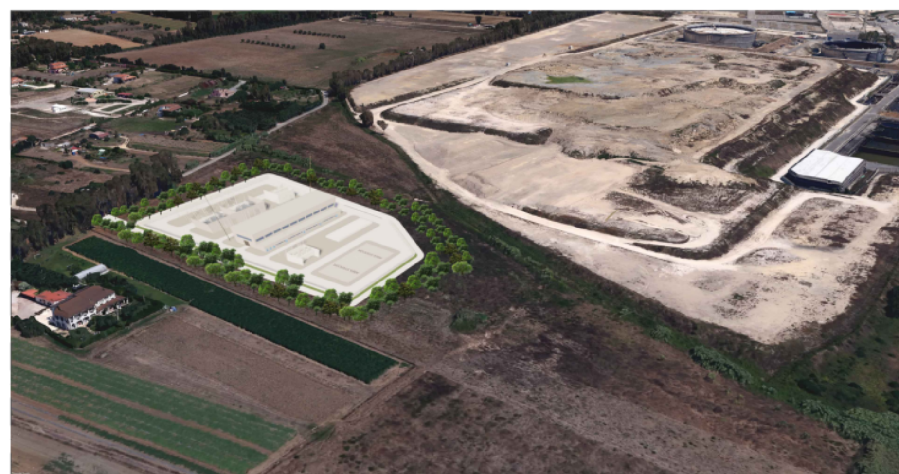
PUNTO DI VISTA "F03" - SITUAZIONE DI PROGETTO