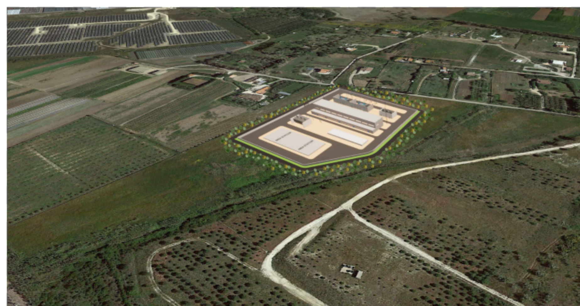
PUNTO DI VISTA "F02" - SITUAZIONE DI PROGETTO