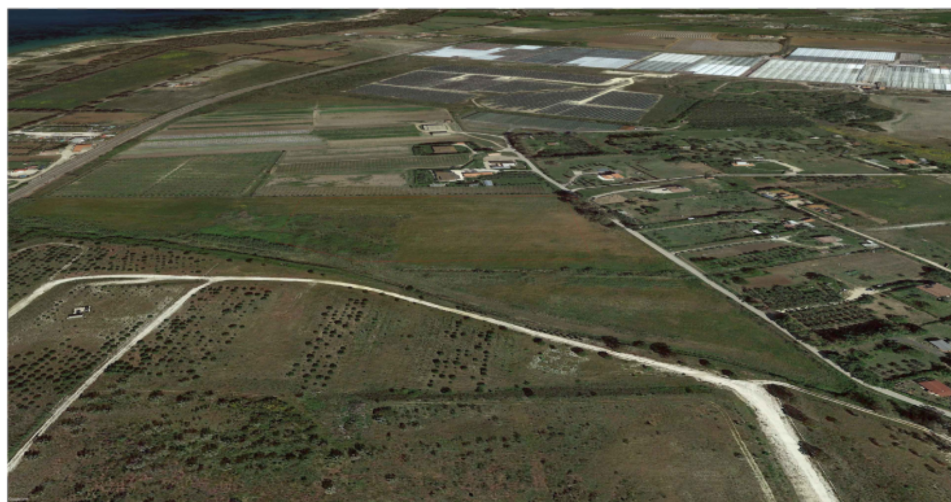
PUNTO DI VISTA "F01" - STATO DI FATTO