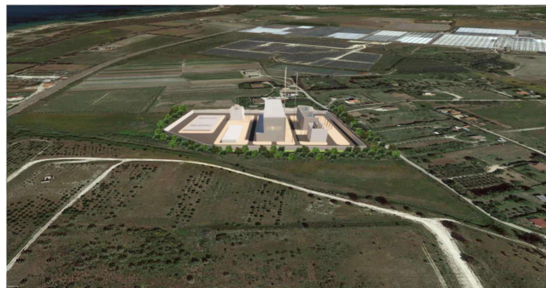
PUNTO DI VISTA "F01" - STATO DI PROGETTO