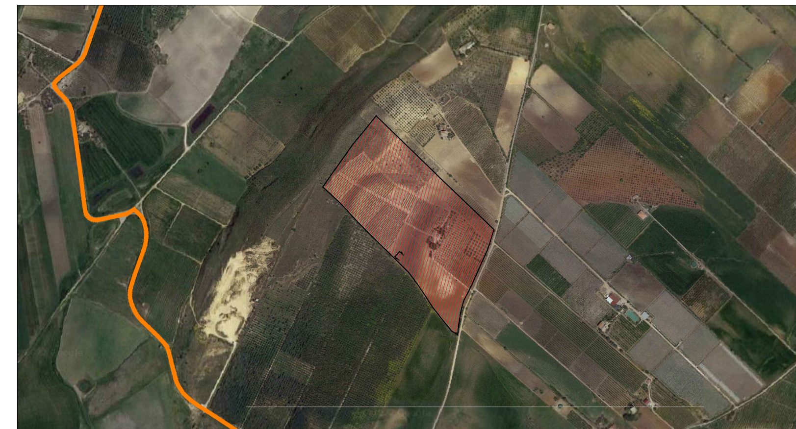
Area oggetto di intervento Scala 1:10000