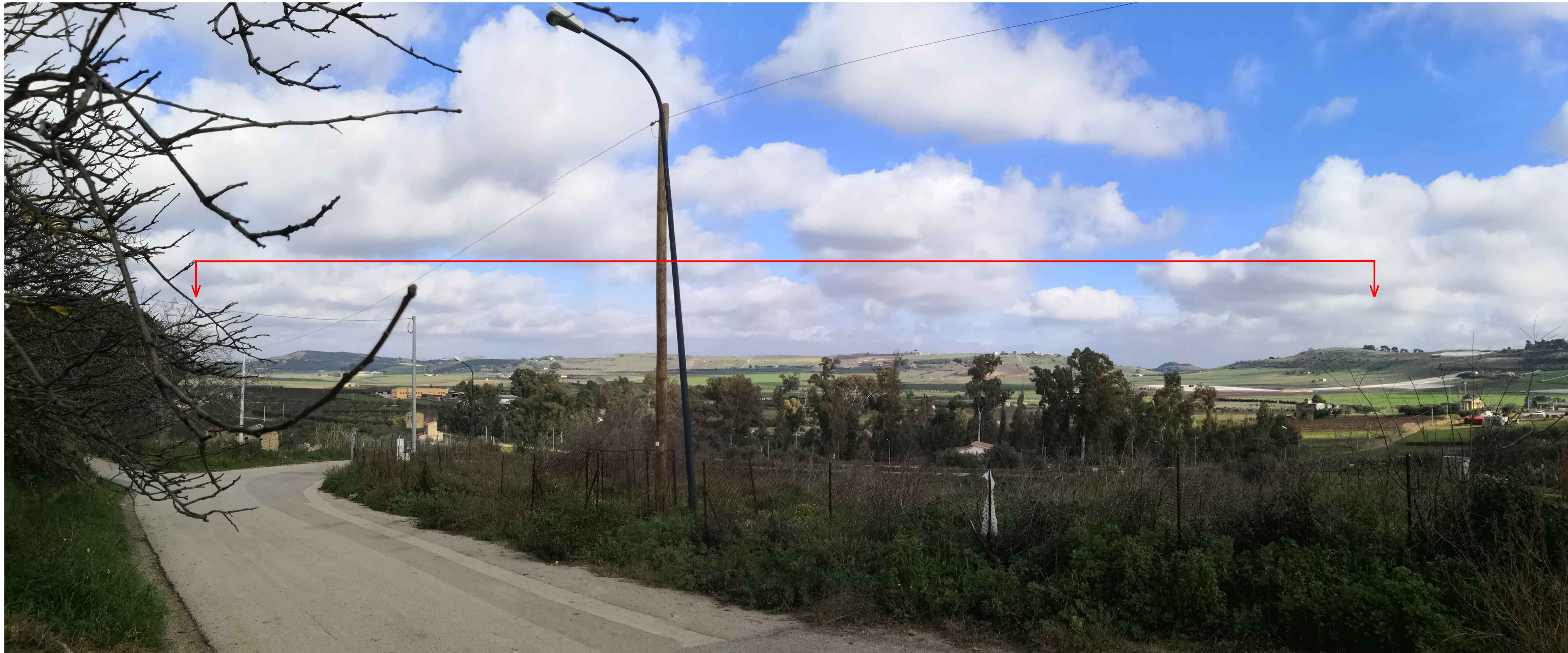
VISTA 63 - BOSCHETTO MELE - POST OPERAM