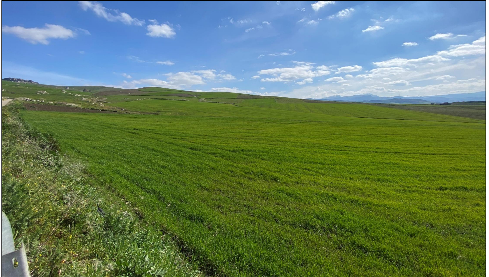
Figura 4. Stato dei luoghi ante operam Impianto PC2-Celso (POV 3: SP70)