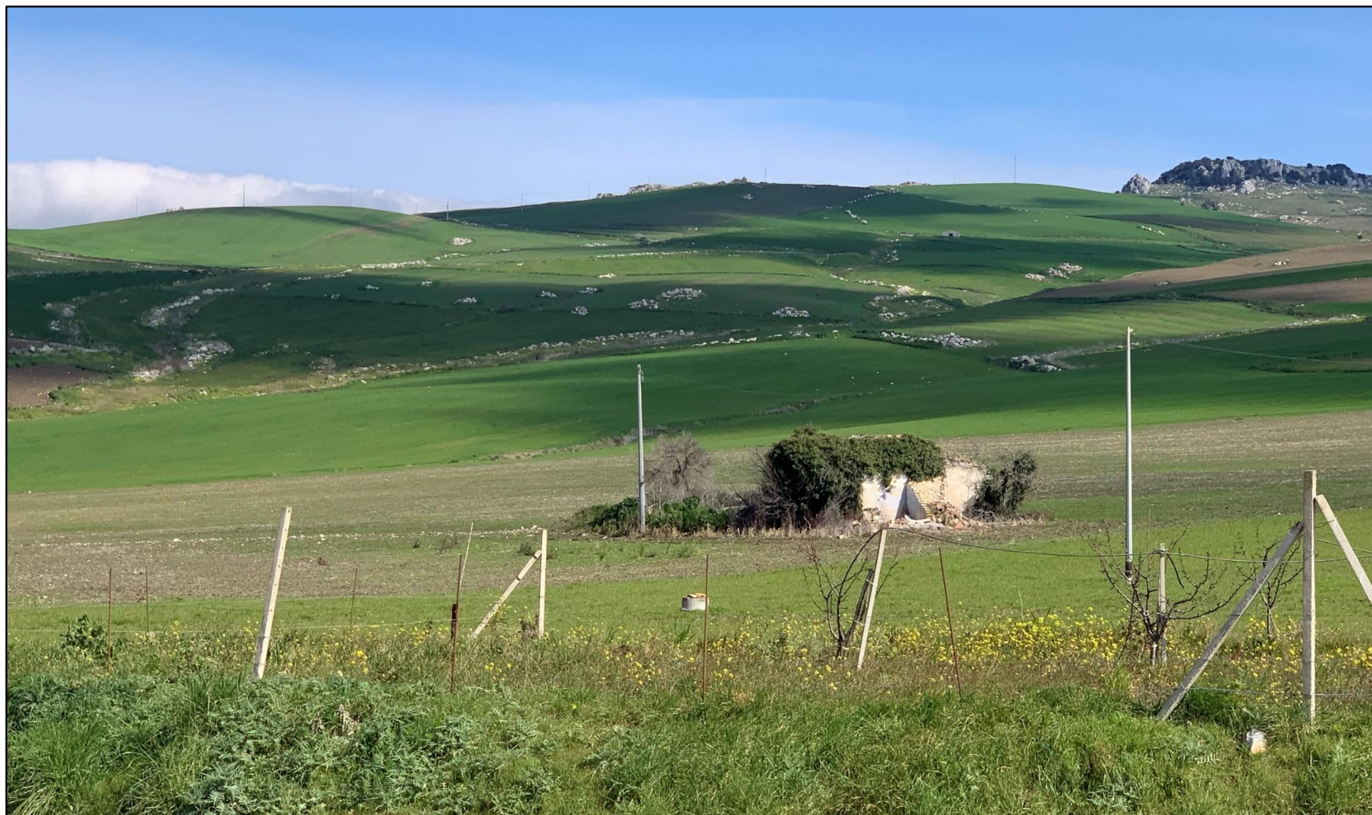
Figura 3. Stato dei luoghi ante operam Impianto PC1-Celso (POV 2)