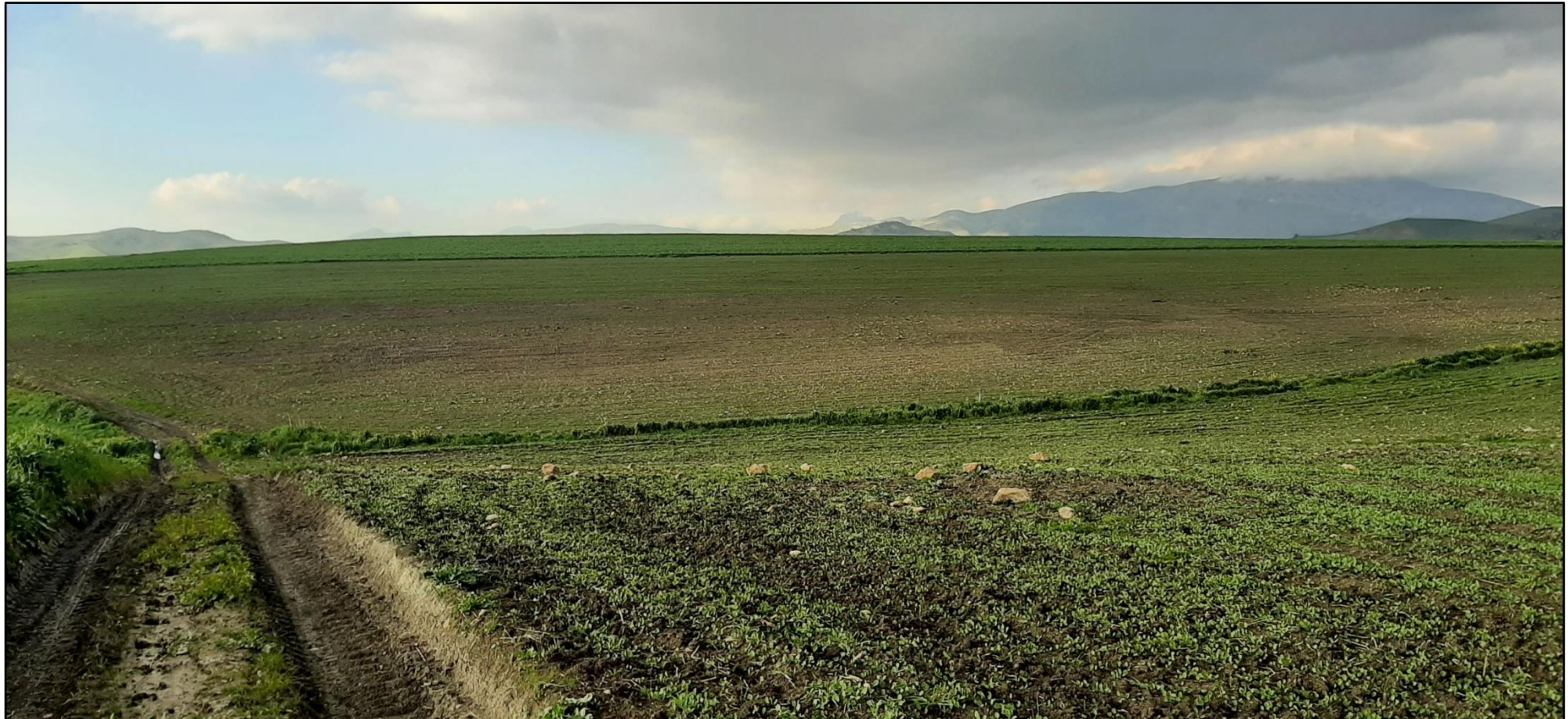
Figura 5. Stato dei luoghi ante operam Impianto Patria (POV 4)