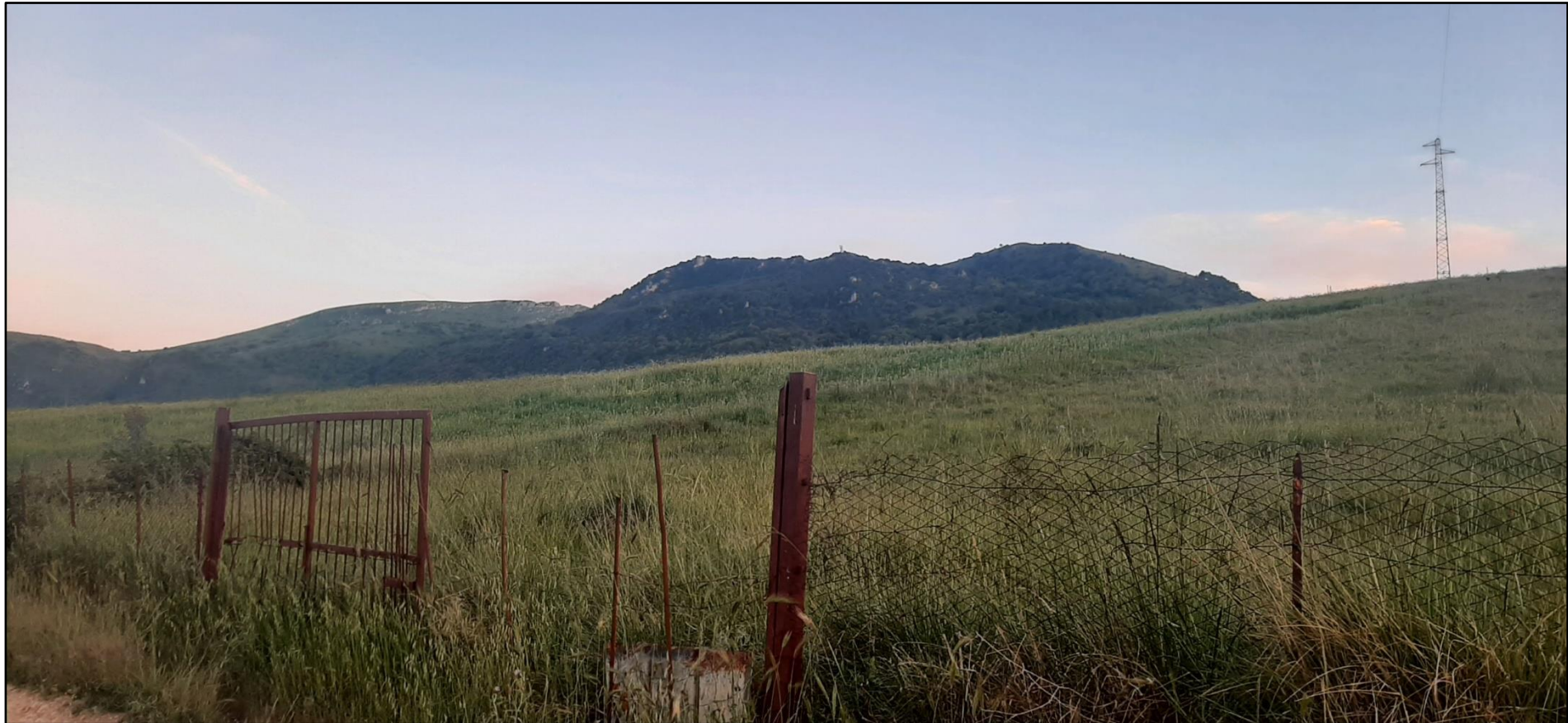
Figura 9. Stato dei luoghi ante operam della nuova Stazione Terna e Stazione Utente Palastanga.