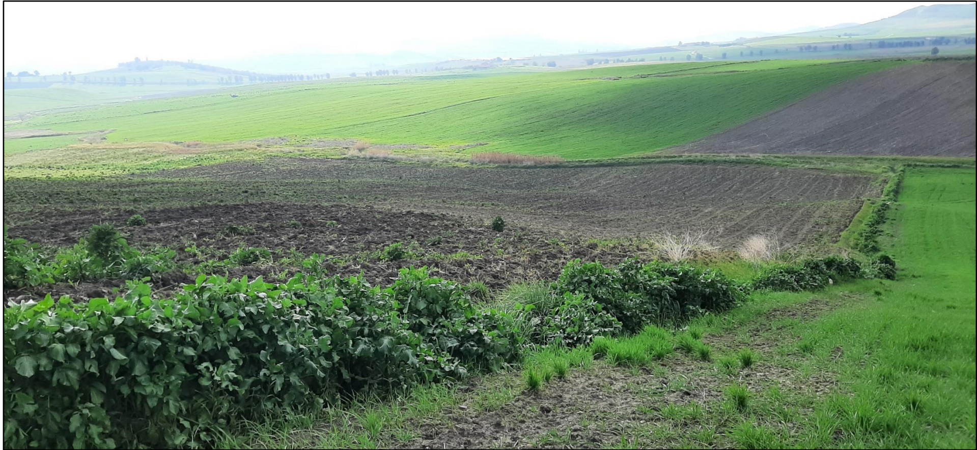
Figura 8. Stato dei luoghi ante operam Impianto Torre dei Fiori lato est (POV 7)