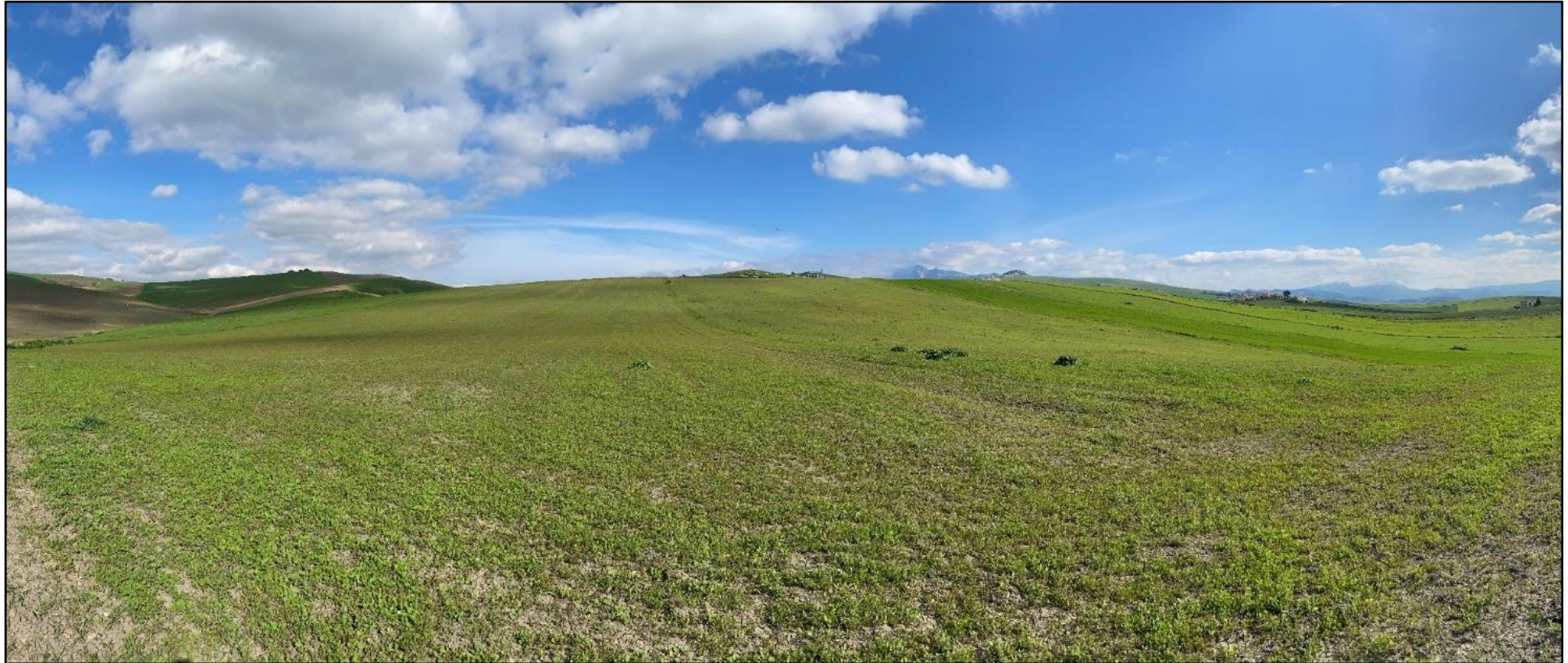
Figura 6. Stato dei luoghi ante operam Impianto Croci (POV 5)