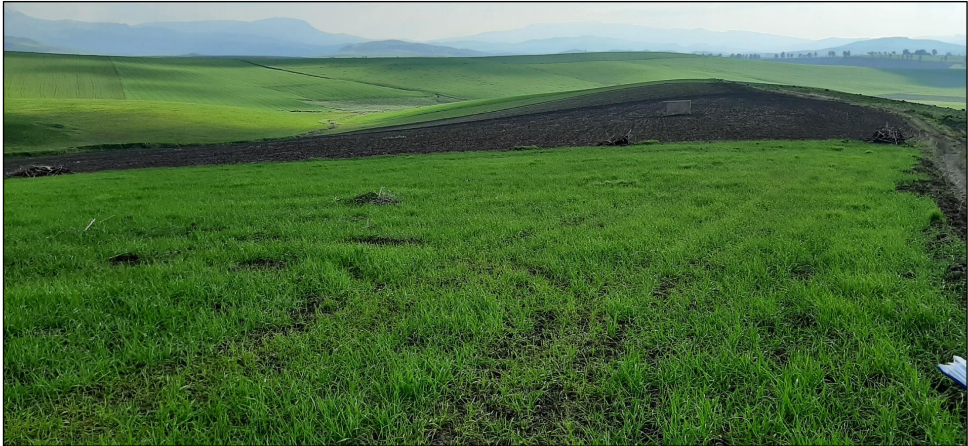
Figura 7. Stato dei luoghi ante operam Impianto Torre dei Fiori lato ovest (POV 6)