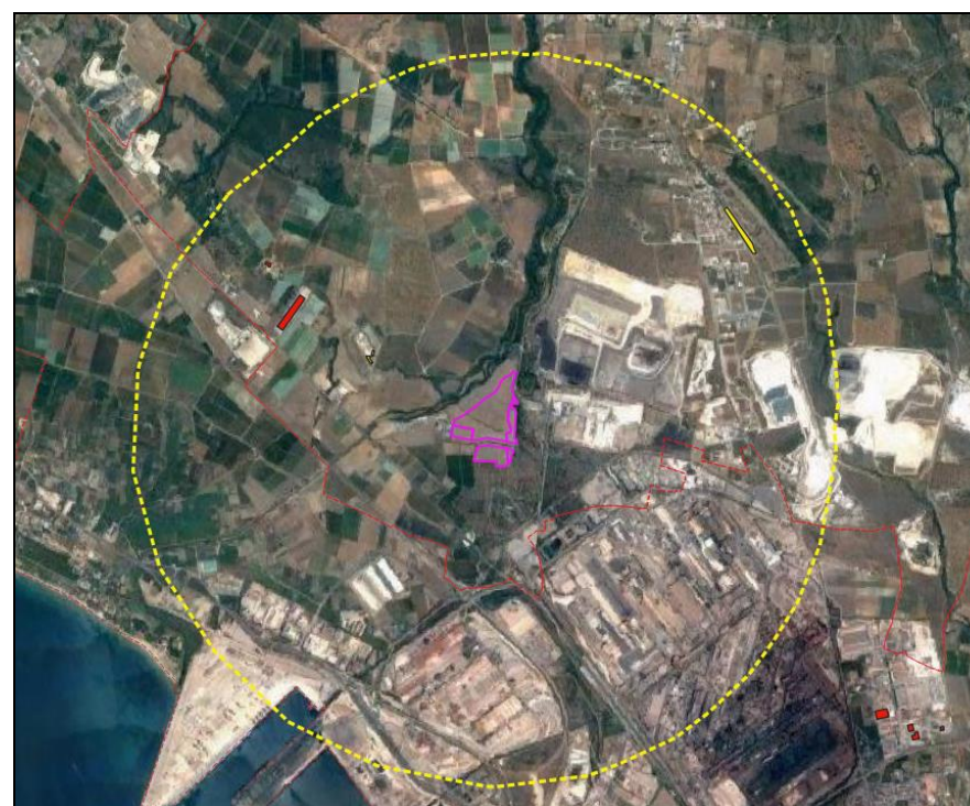
Figura 5-2: Impianti realizzati e autorizzati nella ZVT

Come si evince dall'immagine, la zona di visibilità teorica non comprende alcun centro abitato, mentre sono presenti alcuni tratti di strade provinciali e statali, oltre alla viabilità locale di accesso ai lotti agricoli.