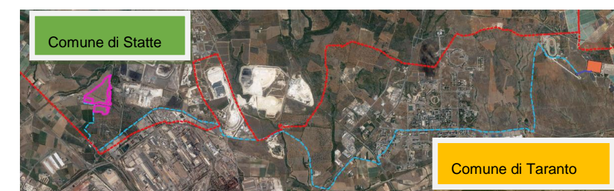
Figura 2-1: Inquadramento territoriale su Ortofoto del complesso del percorso del cavidotto di connessione MT (in azzurro)

Le opere in progetto interessano i territori dei Comune di Statte e Taranto (TA) : l'impianto fotovoltaico e l'impianto di produzione di idrogeno interessano il territorio comunale di Statte, mentre le opere di connessione interesseranno in comune di Taranto. Il cavidotto di connessione MT avrà una lunghezza complessiva di circa 17,6 km, interesserà sia il territorio comunale di Statte che di Taranto, della Città Metropolitana di Taranto. Sarà realizzato in cavo interrato con tensione nominale di 30 kV, e collegherà l'impianto fotovoltaico con la stazione di utenza in prossimità della stazione di rete Terna 380/220/150kV denominata "Taranto N2".