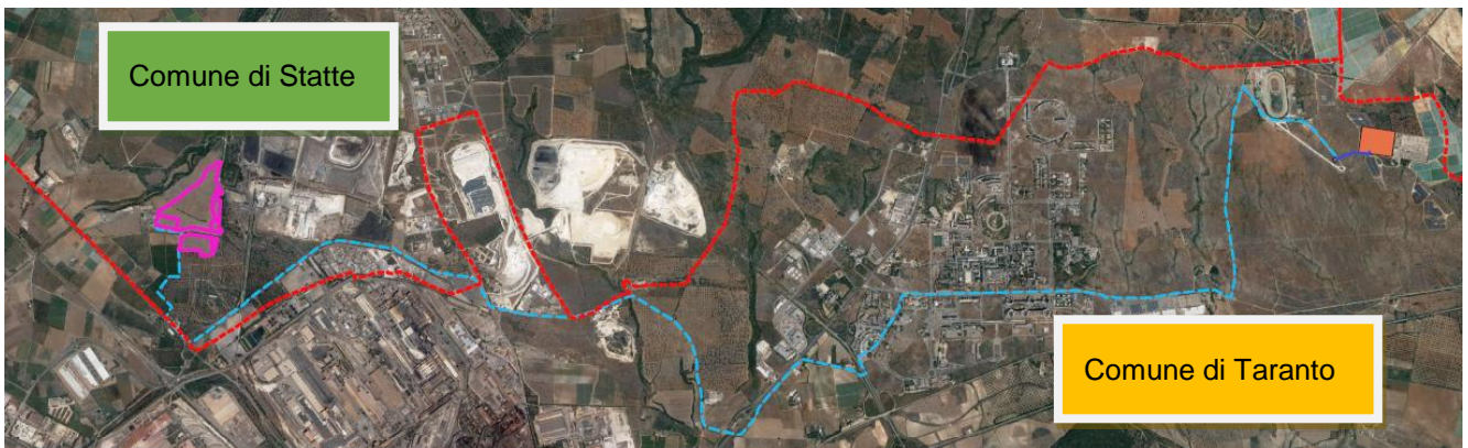
Figura 4-3: Inquadramento territoriale su Ortofoto del complesso del percorso del cavidotto di connessione MT (in azzurro)

Il cavidotto di connessione MT avrà una lunghezza complessiva di circa 17,6 km, sul territorio comunale di Statte e Taranto, della Città Metropolitana di Taranto. Sarà realizzato in cavo interrato con tensione nominale di 30 kV, che collegherà l'impianto fotovoltaico con la stazione di utenza in prossimità della stazione di rete Terna 380/220/150kV denominata "Taranto N2".