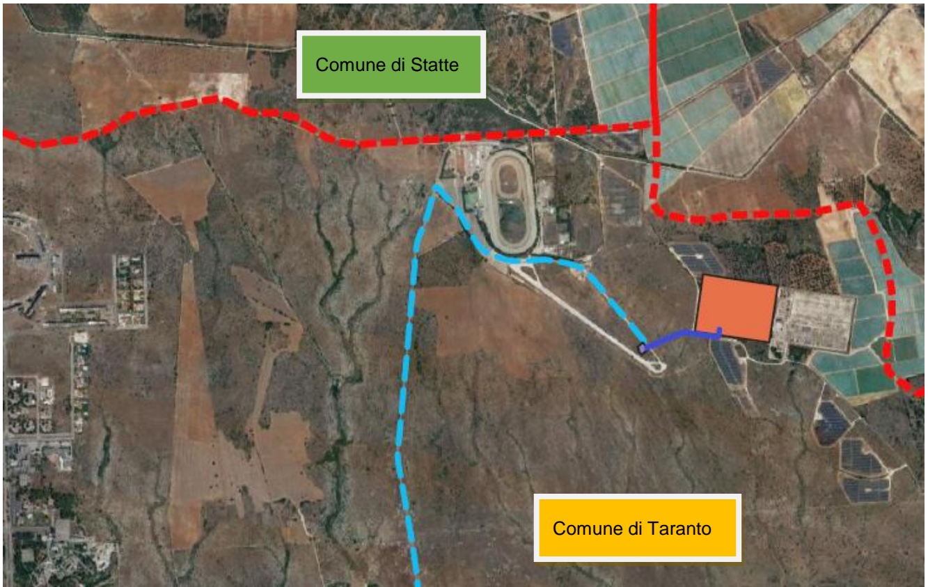
Figura 4-2: Inquadramento territoriale su Ortofoto dell'area interessata dalla Stazione Elettrica TERNA "Taranto N2" (arancione) e dalla Sottostazione Utente (viola)

Il sito interessato dall'impianto è raggiungibile dalla SS7 Taranto Massafra, percorrendo la viabilità locale esistente in località Gennarini. La superficie lorda dell'area dell'impianto è di circa 43 ha di cui solo 25 ha saranno effettivamente interessati dall'intervento. Le opere in progetto interesseranno le seguenti particelle catastali: