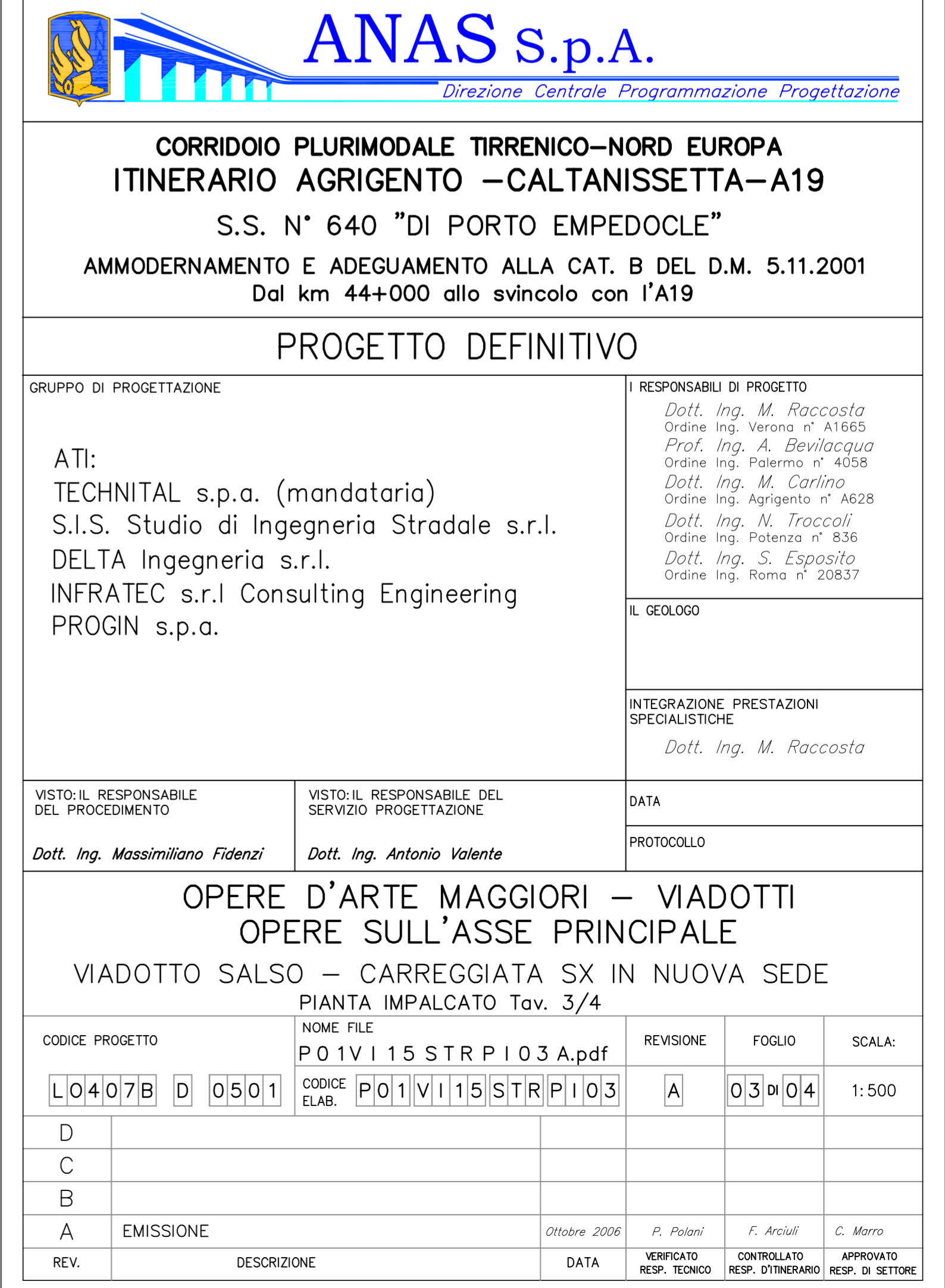
PIANTA IMPALCATO TAV 3/4 SCALA 1 : 500

N.B. : GLI INTERASSI PILE SONO MISURATI SULL'ASSE IMPALCATO LE PROGRESSIVE SI RIFERISCONO ALL'ASSE TRACCIAMENTO (ASSE Q.P.)