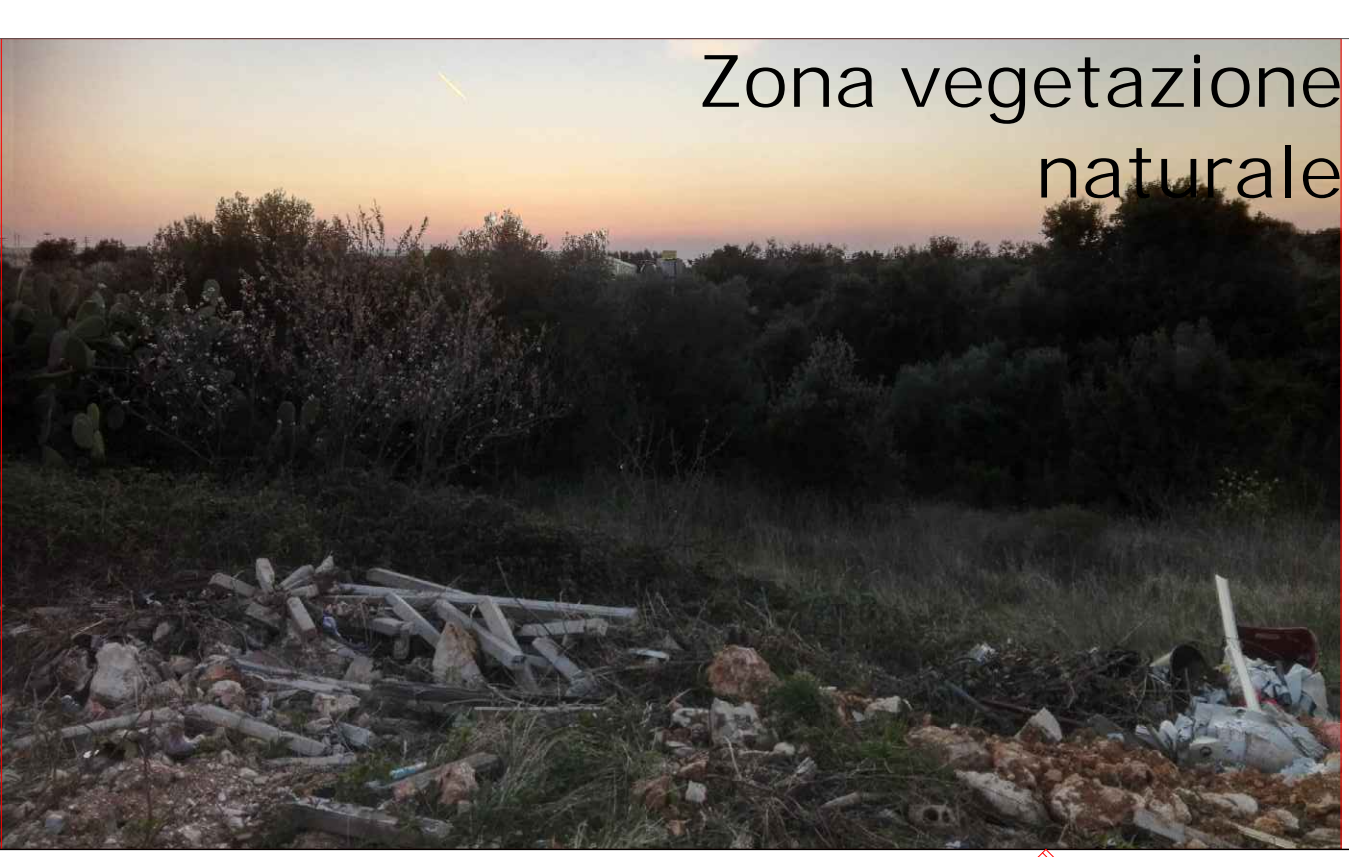
Zona vegetazione naturale