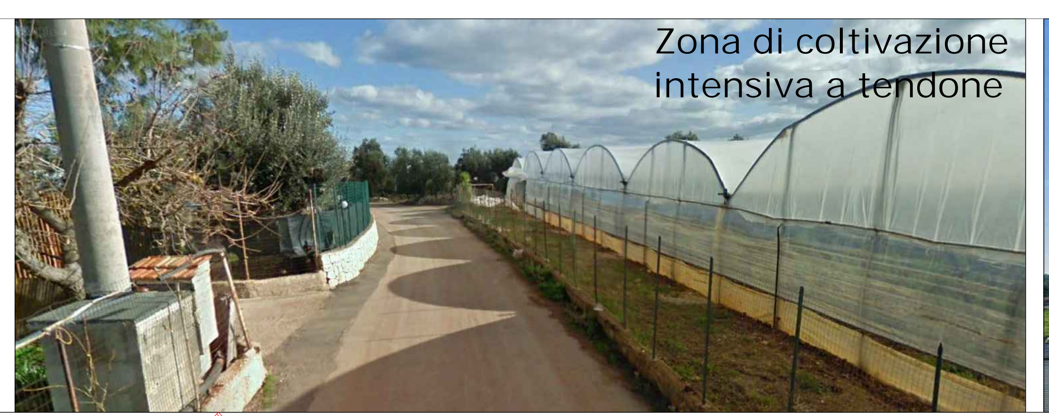
Zona di coltivazione intensiva a tendone