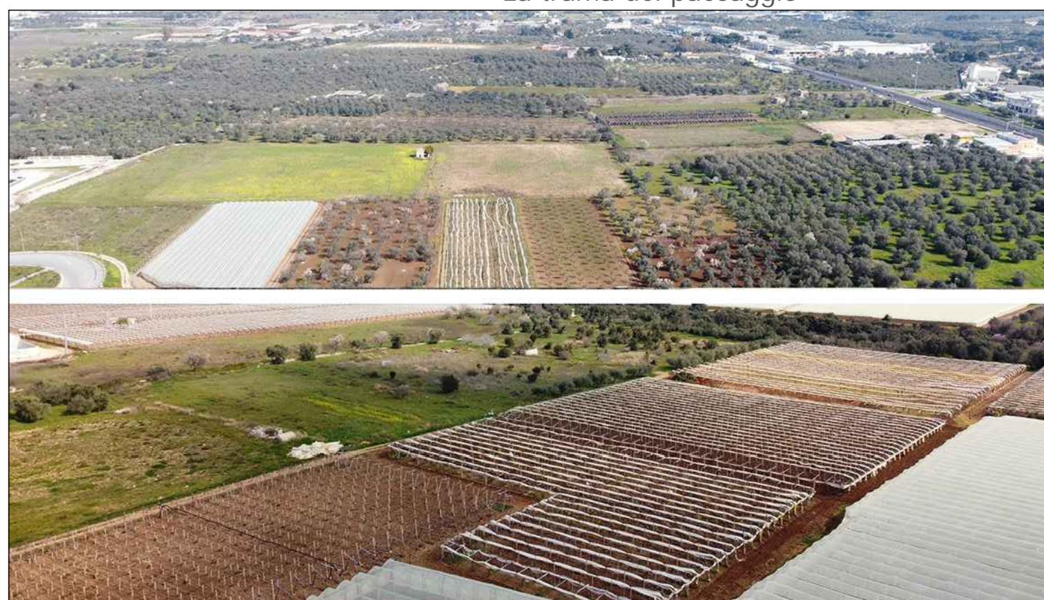
La trama del paesaggio