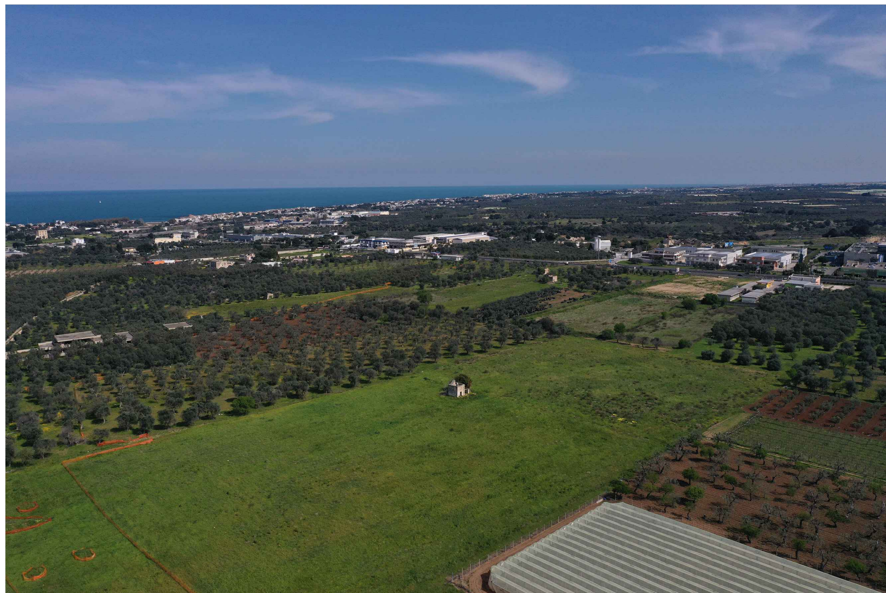
ANTE OPERAM Vista n.4 - Svincolo SV05 Triggiano, in direzione Noicattaro