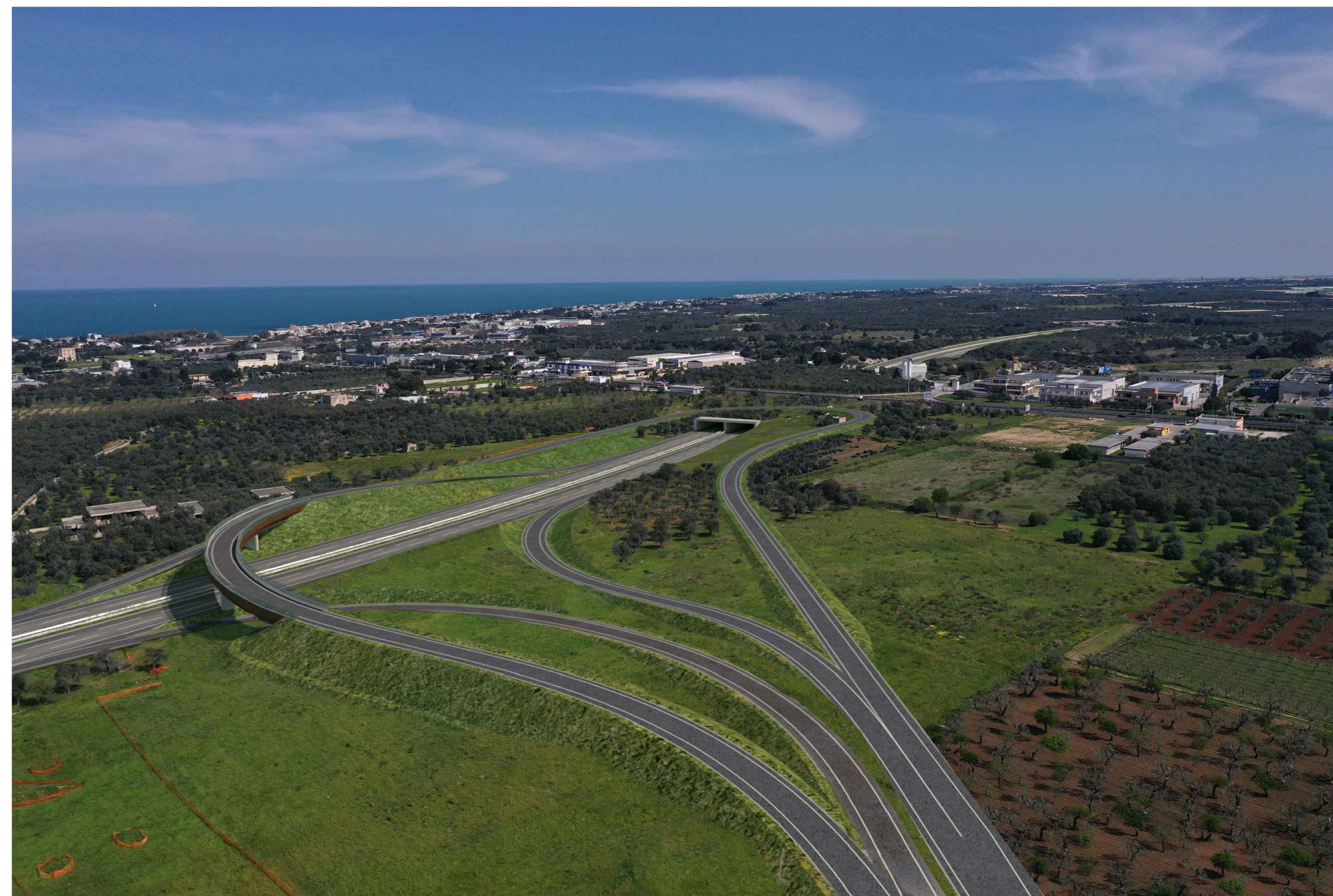
POST OPERAM Vista n.4 - Svincolo SV05 Triggiano, in direzione Noicattaro