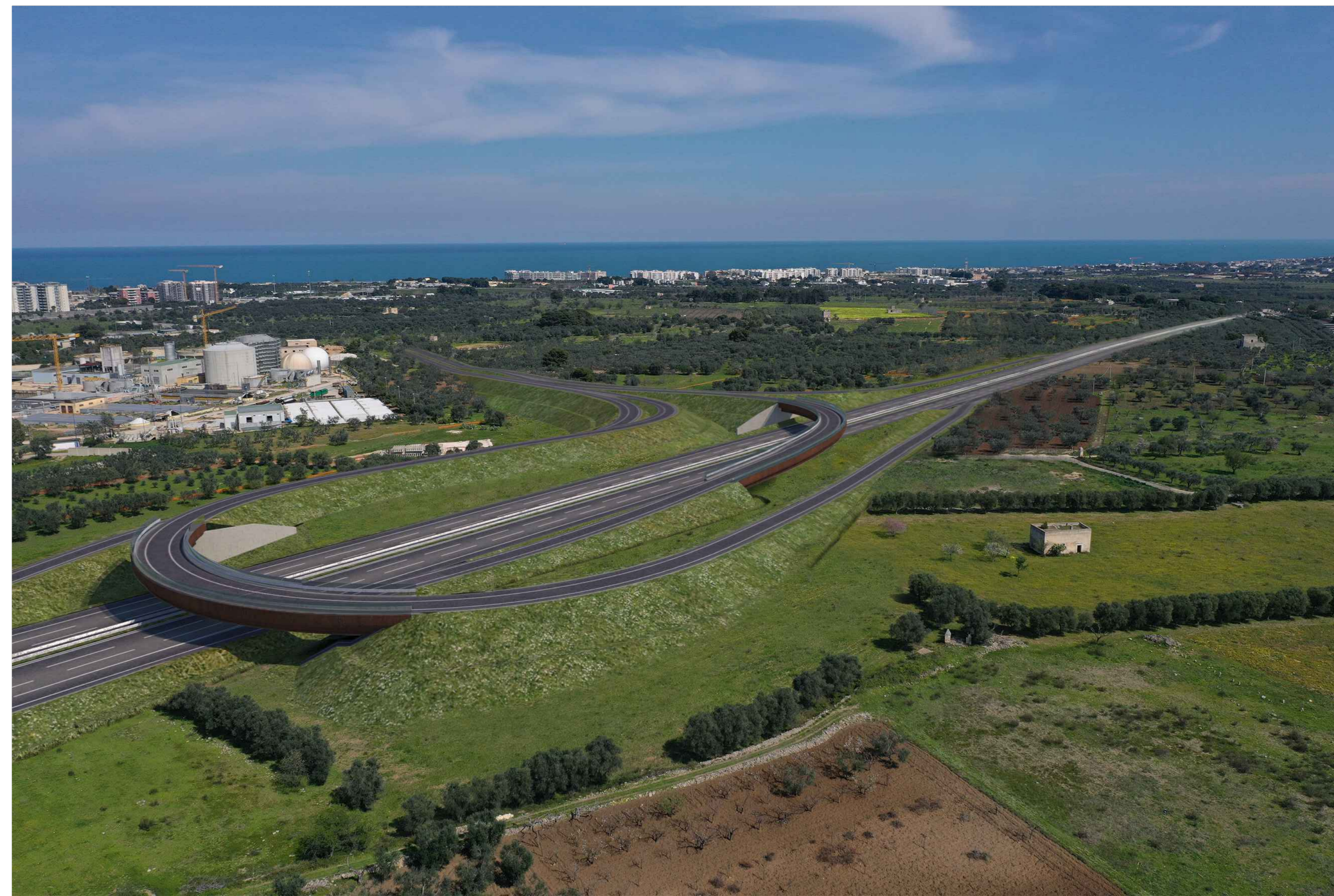
POST OPERAM Vista n.3 - Svincolo SV04 Caldarola, in direzione Triggiano