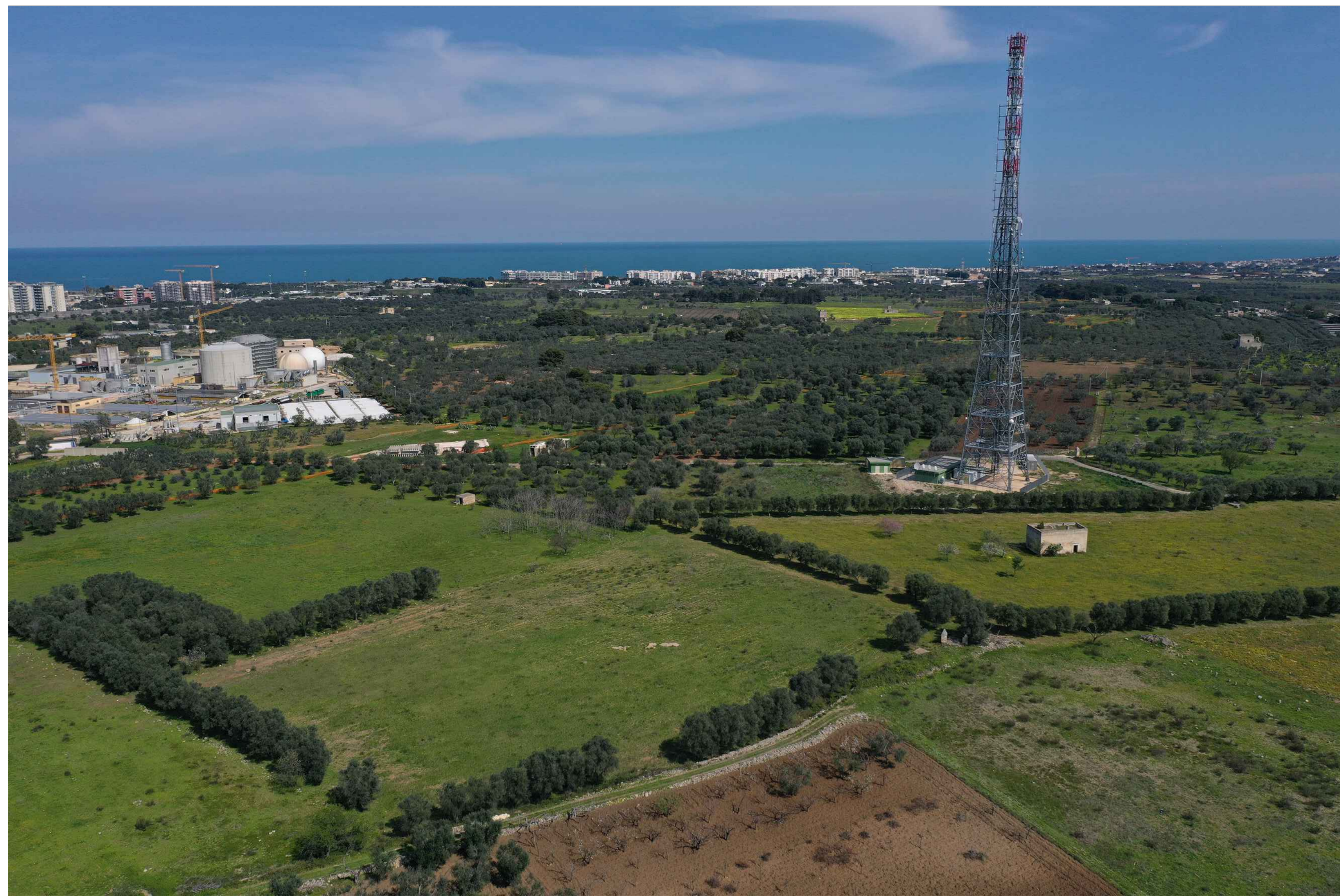
ANTE OPERAM Vista n.3 - Svincolo SV04 Caldarola, in direzione Triggiano