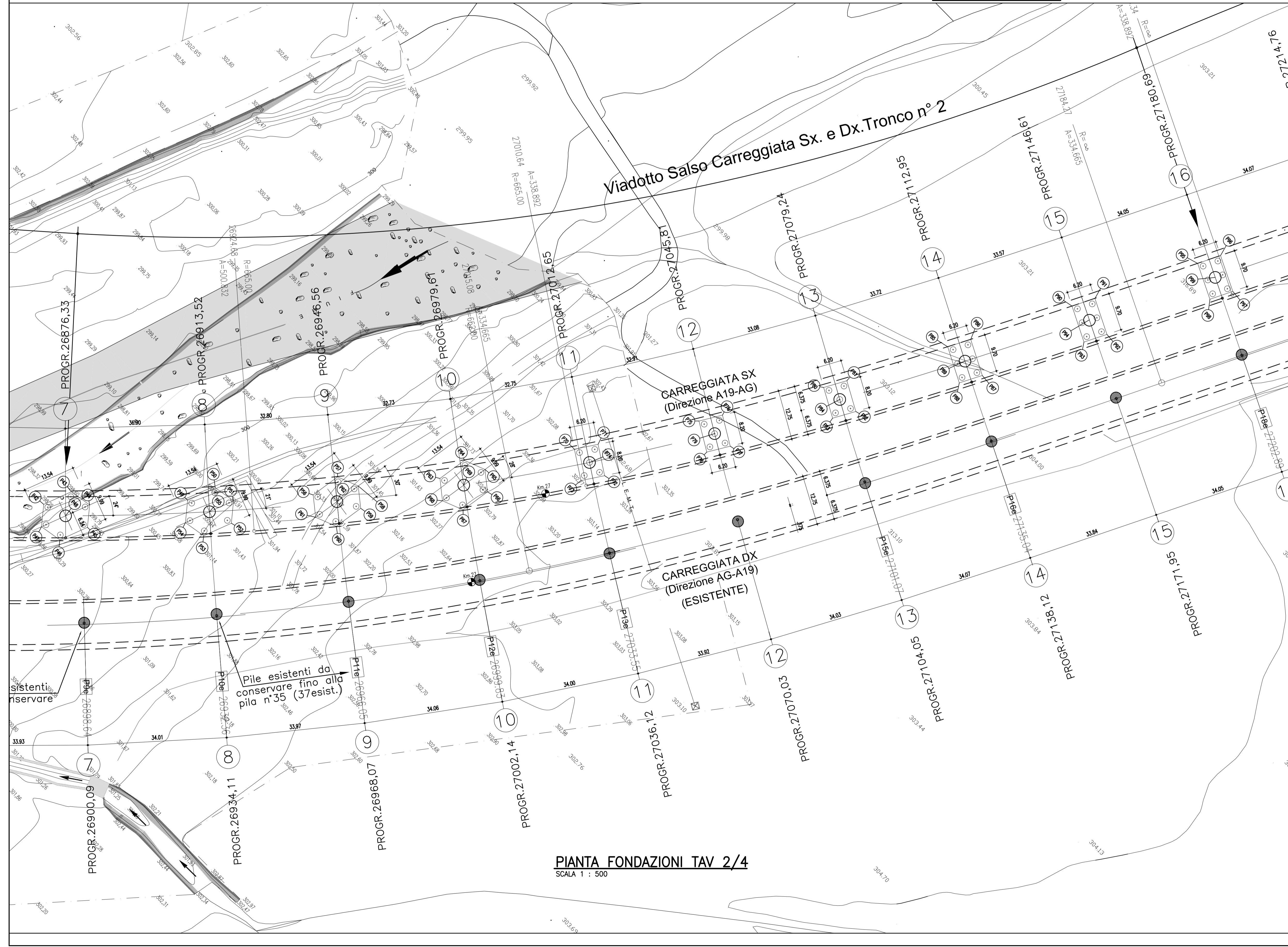
PIANTA FONDAZIONI TAV. 2/4 SCALA 1 : 500