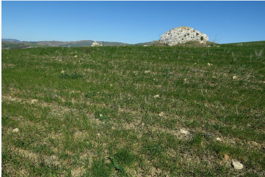
Figura 2. Incolti e pascoli