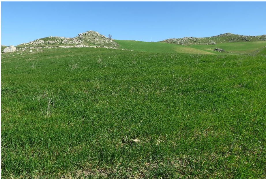
Figura 3. Seminativi