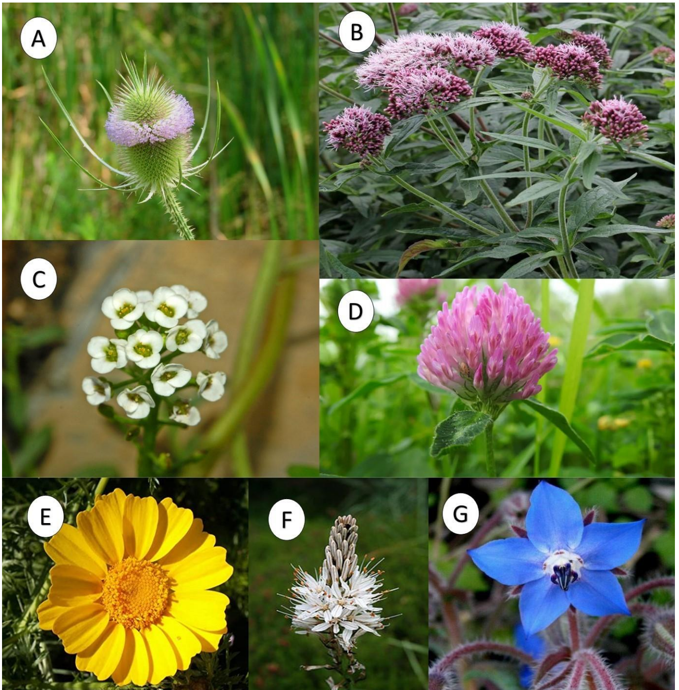
Figura 9: A. Dipsacus fullonum ; B. Eupatorium cannabinum ; C. Lobularia maritima ; D. Trifolium sp.; E. Chrysanthemum coronarium ; F. Asphodelus ramosus ; G. Borrago officinalis .