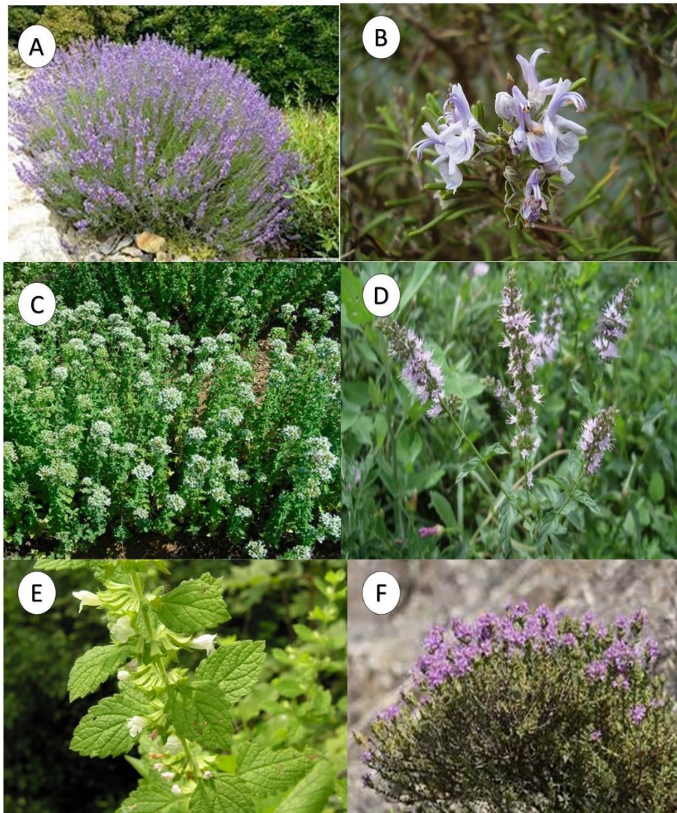
Figura 6: A. Lavandula sp.; B. Rosmarinus officinalis ; C. Origanum vulgare ; D. Mentha spicata ; E. Melissa officinalis ; F. Thymus capitatus .

La redditività della coltivazione di queste specie è proporzionata alle capacità tecniche e all'esperienza dell'agricoltore, nonché al tipo di lavorazione post raccolta che si riesce ad effettuare in azienda (essiccazione, distillazione, ecc.). Per quanto riguarda la lavanda, la percentuale di oli essenziali che si può estrarre varia da 0,8 a 1,0% in peso di prodotto grezzo.