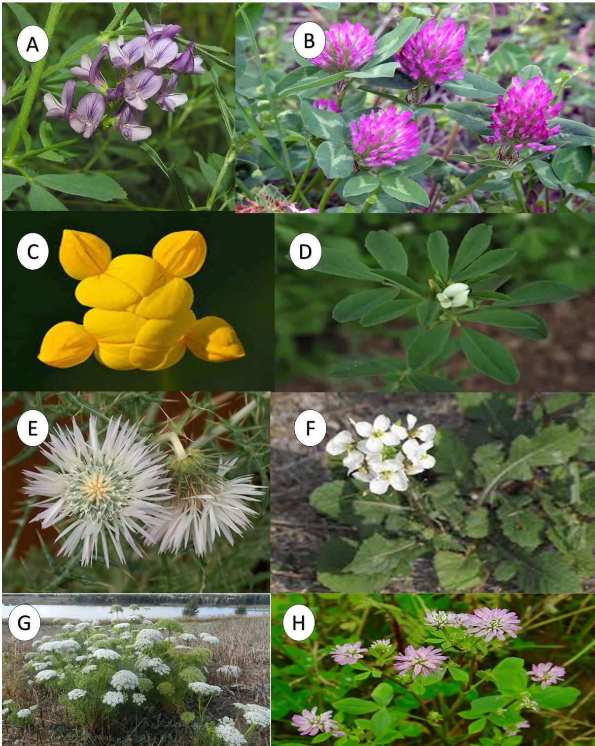
Figura 10: A. Medicago sativa ; B. Trifolium pratense ; C. Lotus corniculatus ; D. Trigonella foenumgraecum ; E. Galactites tomentosus ; F. Diplotaxis eruroides ; G. Visnaga daucooides ; H. Trifolium resupinatum .