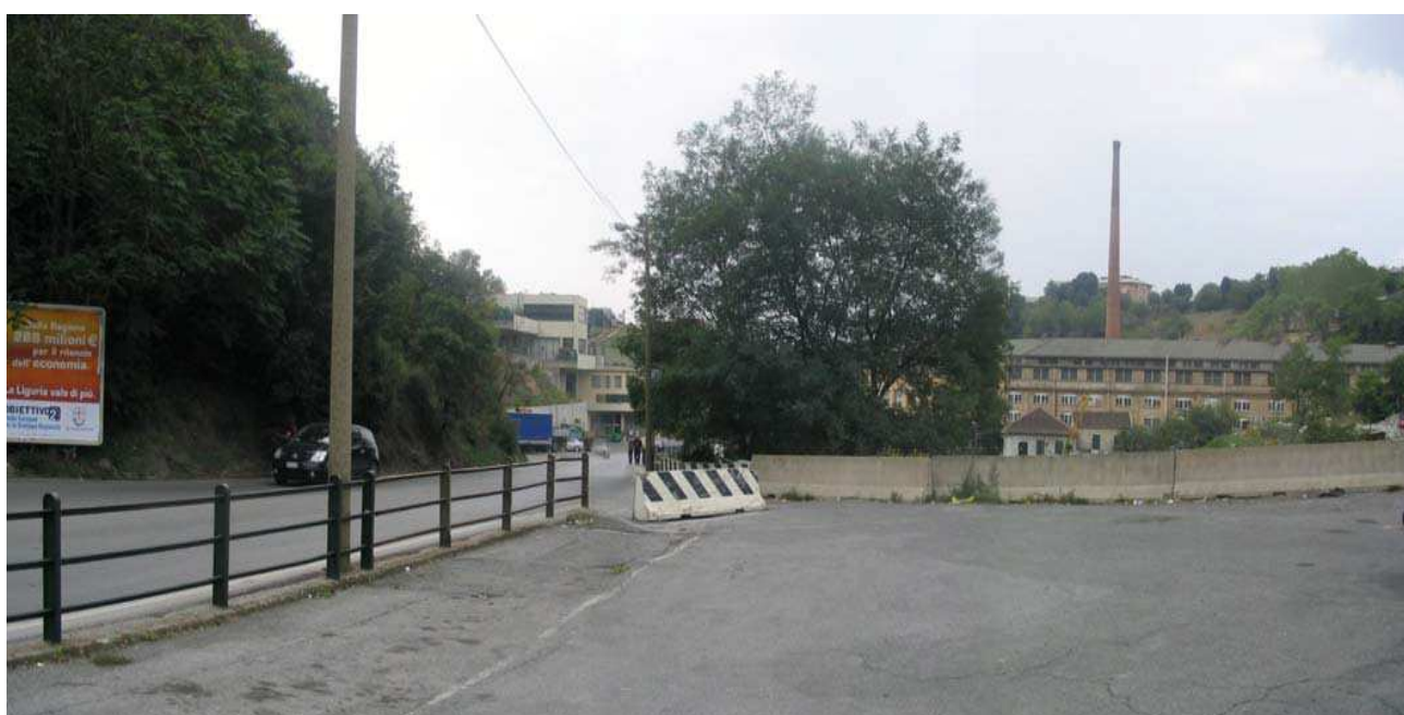
Fig. 1 : Area del COV 1 stato di fatto nella Progettazione Definitiva

Le modifiche intervenute sull'area COV1, rispetto al PD che prevedeva un'unica area operativa e insieme logistica, si sono rese necessarie in quanto è stata realizzata una nuova viabilità che si innesta in via Borzoli dove nel PD c'era un parcheggio ed era prevista l'area di cantiere.