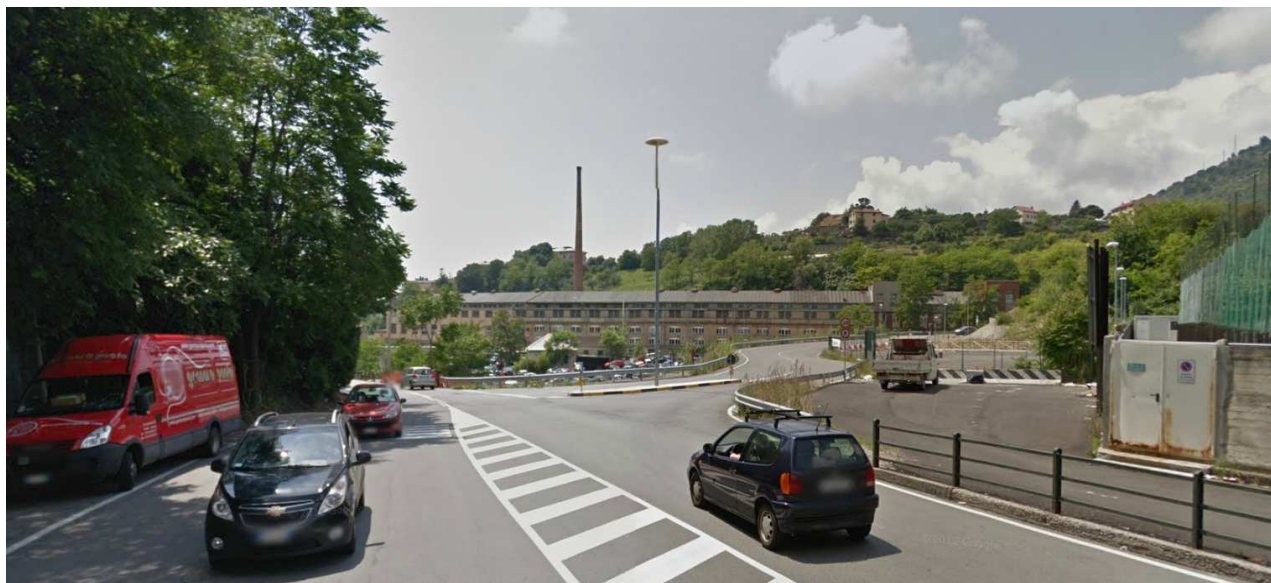
Fig. 2 : Area del COV 1 stato attuale

I cantieri operativi COV1 e COV1bis sono situati in un'area urbana ed in gran parte occupano aree destinate alla viabilità o a servizio di questa e dunque asfaltate e prive di vegetazione.